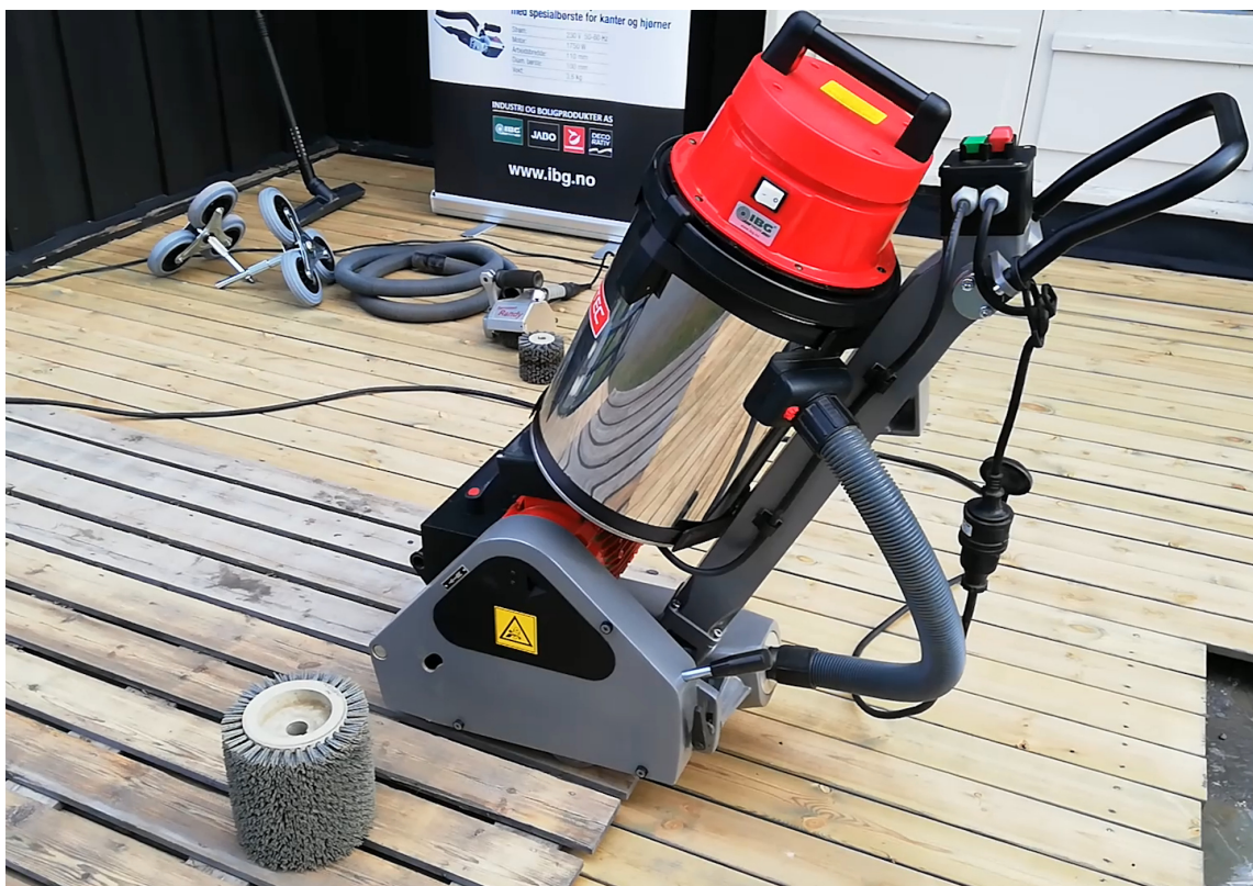
UTSTYRET: Maskinen kan leies fra faghandel og utleieselskaper.