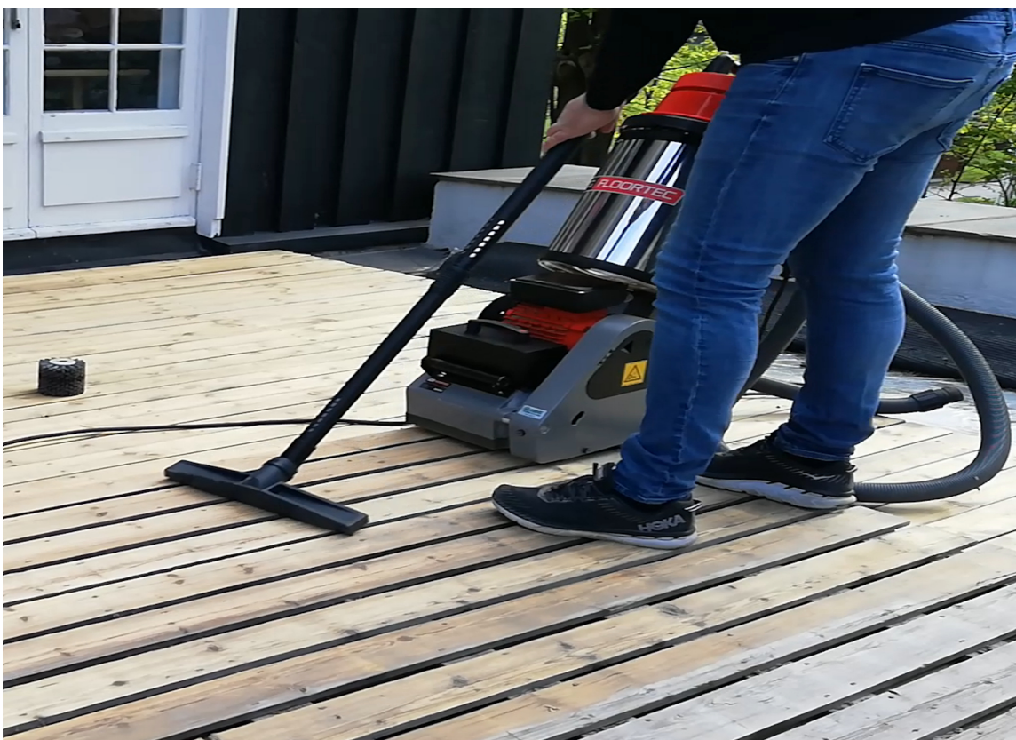
STØVSUGER: En integrert støvsuger samler opp støv fra sliping fra både håndholdt og stor maskin. Før overflatebehandling støvsuges treterrassen med den samme støvsugeren.