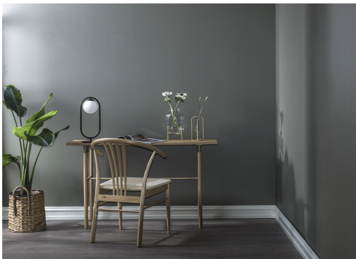
GRØNNSPETT: Sammen med lyst treverk gir den mosegrønne «Grønnspekk» et beroligende interiør.