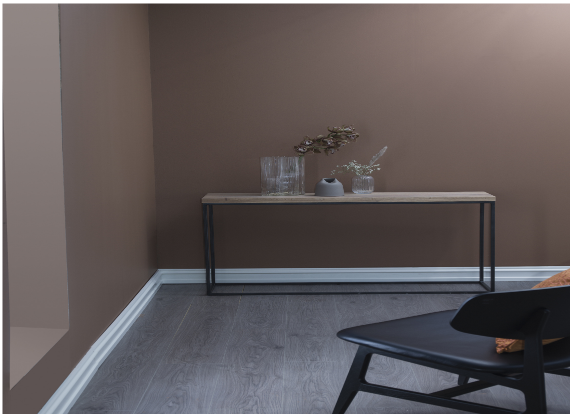
HUBRO: Mange av fargene i fargekartet har fuglnavn. «Hubro» er en varm, brent jordfarge.

– Det er en brukervennlig palett som rettleder deg godt. Alle farger passer sammen med hverandre, sier hun.