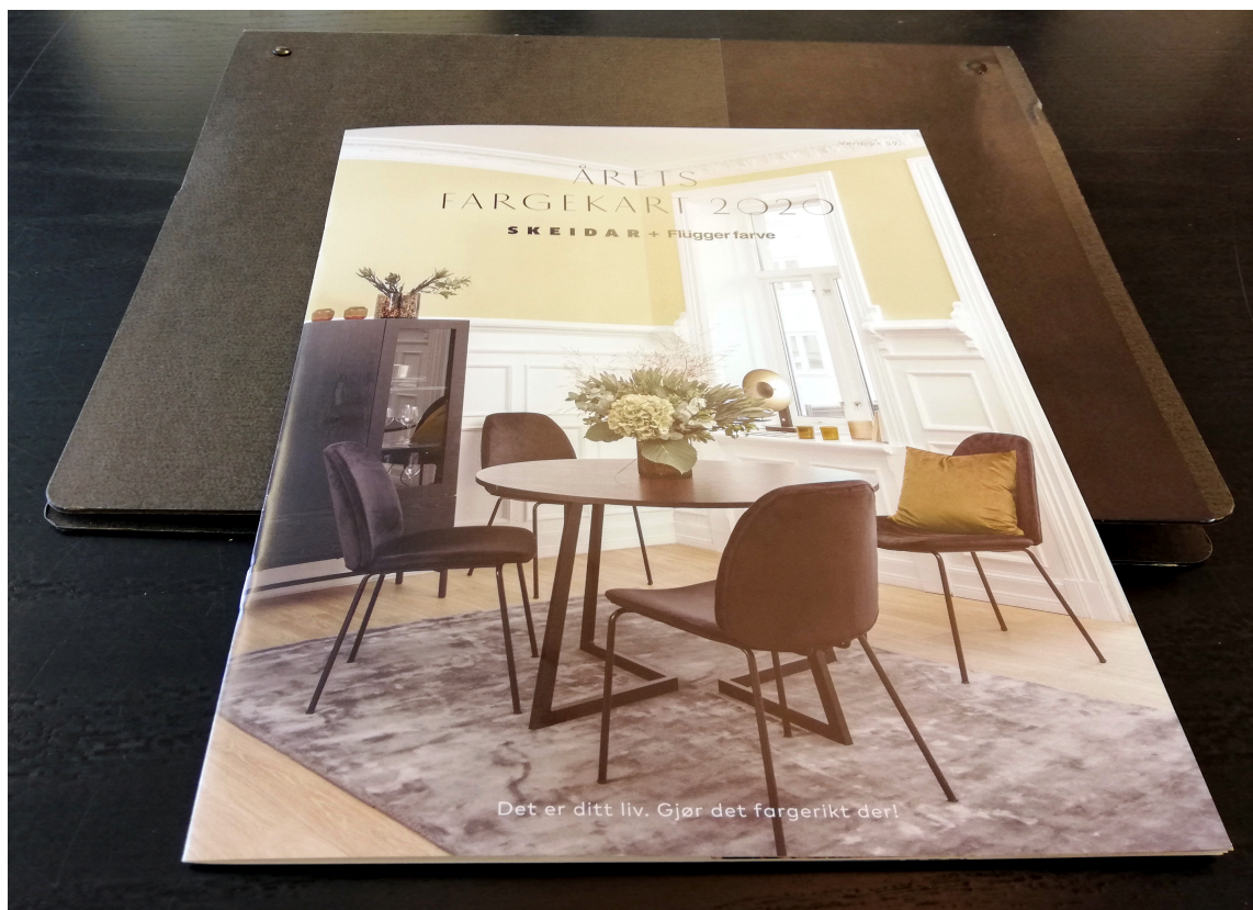
SAMARBEIDSPROSJEKT: Fargekartet er laget i et samarbeid mellom møbelkjeden Skeidar og Flügger Farve.