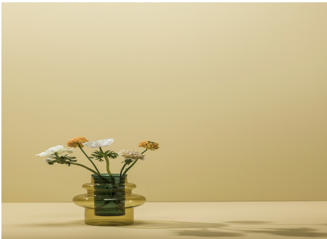
GULSPURV: Denne fargen hører til paletten «NatureAlly», og tilfører både sollys og optimisme til interiøret.