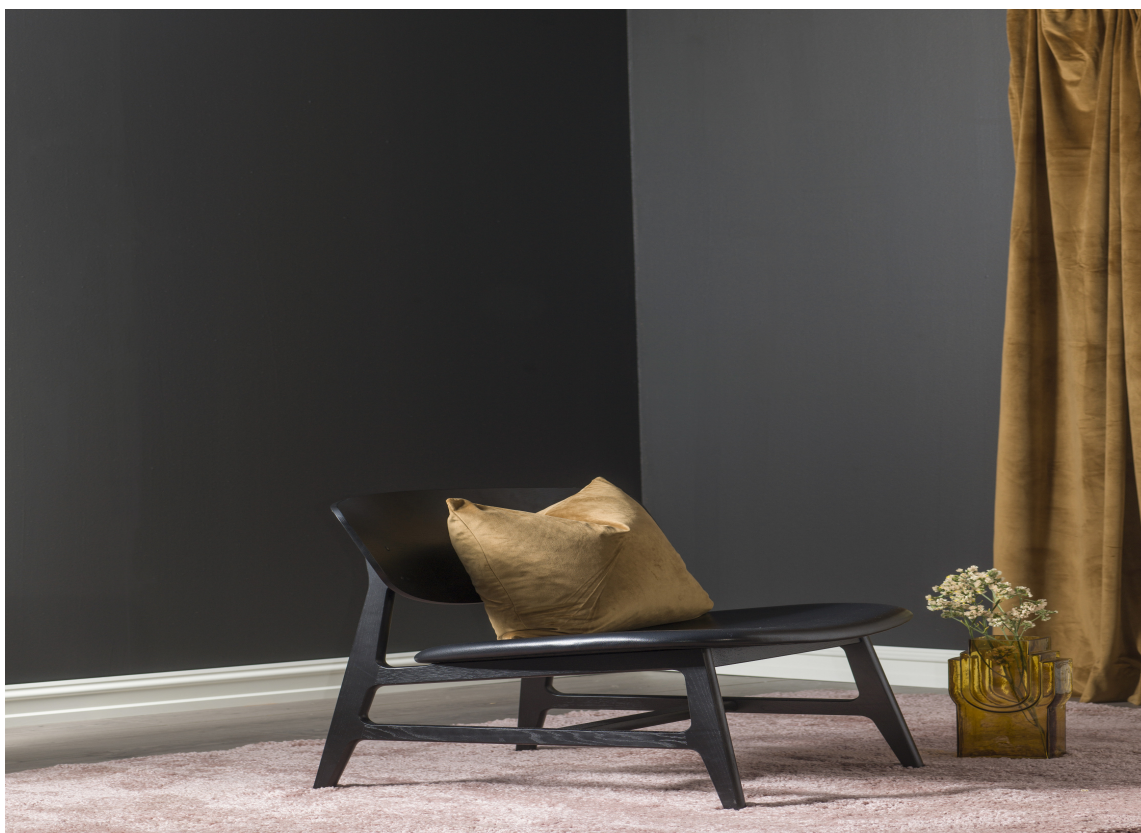
NEUTRAL GREY 10: Denne mørke, nesten sorte farge finner du i paletten «Classic Greatness», sammen med andre jordfarger.