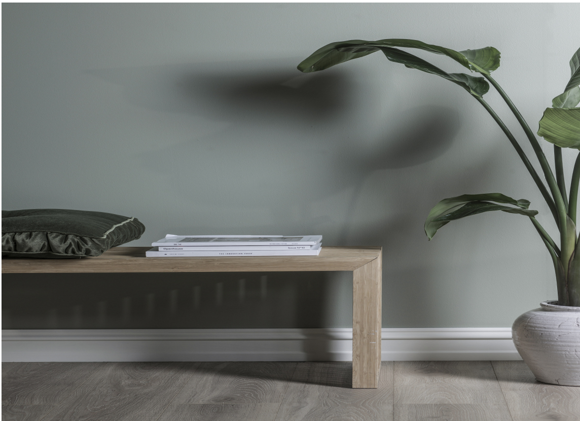
GRØNNFINK: I fargekartet, og i Skeidars butikker, vises fargene i miljøer sammen med møbler fra møbelkjeden. Dette er fargen «Grønnfink».