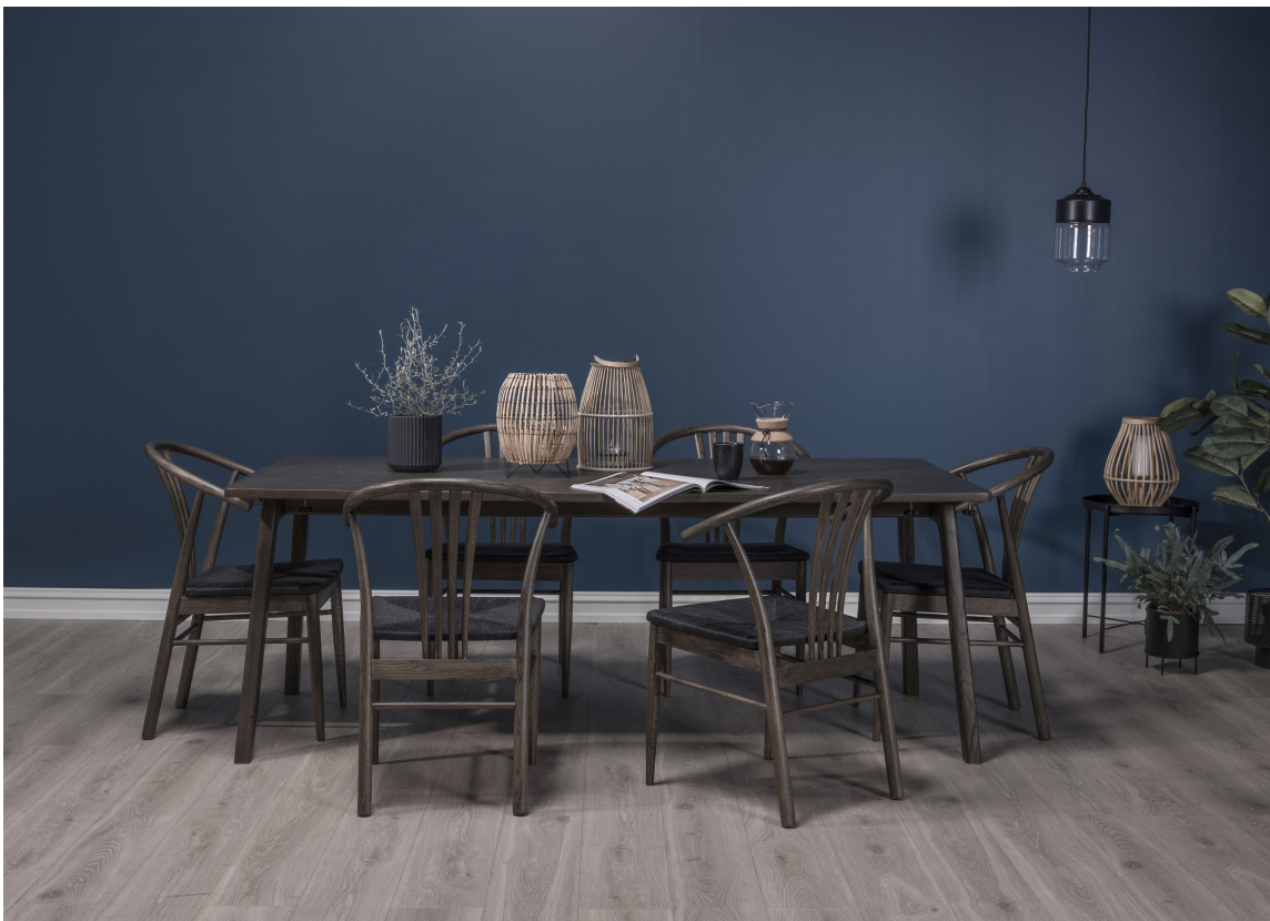
LERKE: Dette er en dyptblå farge som passer godt sammen med mørkbeiset treverk.