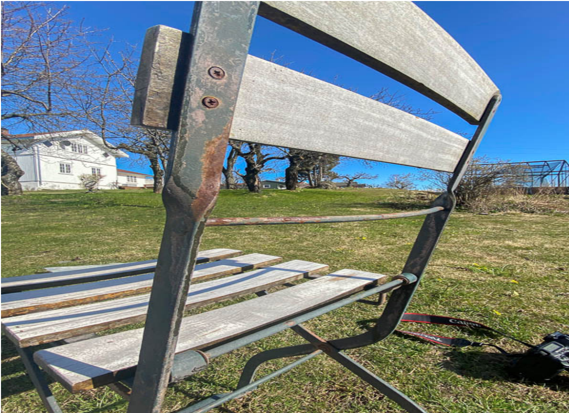
RUSTFLEKKER: Fjern løs rust, og spray på med Quick Bengalack Rett på rust for et resultat som varer lenge.