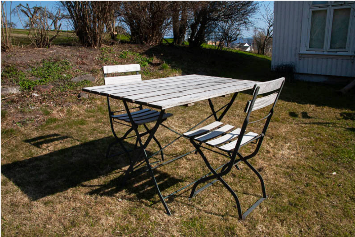
FØR: En sliten sittegruppe med rustflekker og slitt treverk.