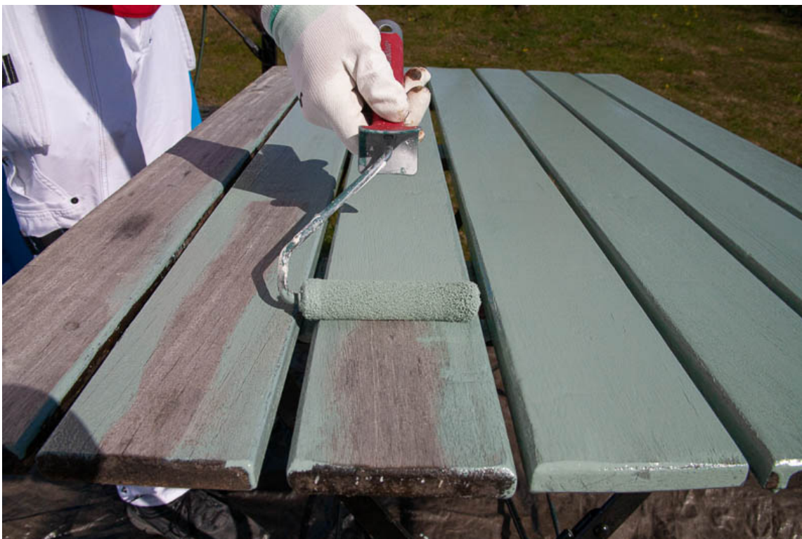
FØRSTE STRØK: Her males bordplaten med Quick Bengalack Universal på spann, i fargen "Core".