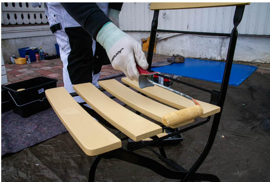
ANDRE STRØK: Etter to strøk er du ferdig.