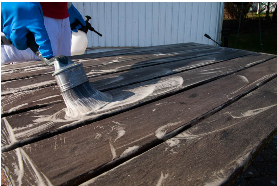
VASK FØRST: Bruk et sterkt rengjøringsmiddel for å fjerne fett, sot og begroinger. Vi bruker Butinox Husvask og Kraftvask.