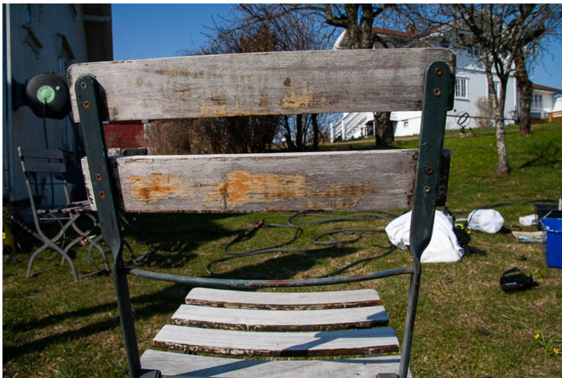
SLITT TREVERK: Denne stolen ser kanskje falleferdig ut, men den kan enkelt fornyes.