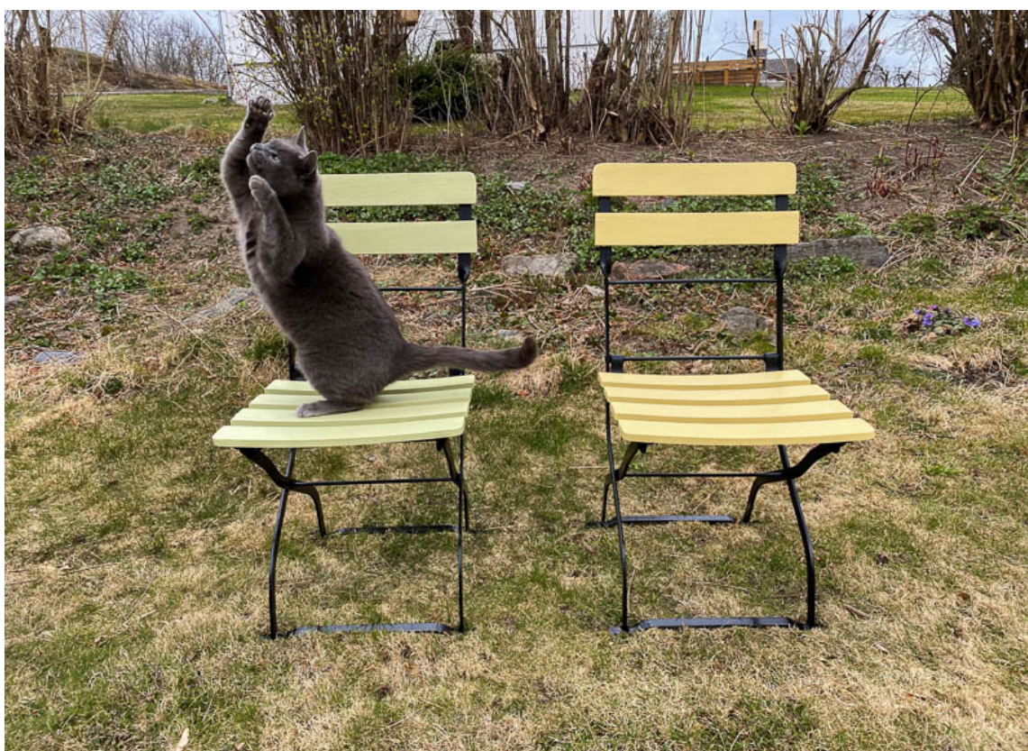
FARGERIKE STOLER: Med Quick Bengalack får du enkelt fornyet gamle møbler. Katten ser også ut til å være fornøyd med resultatet.