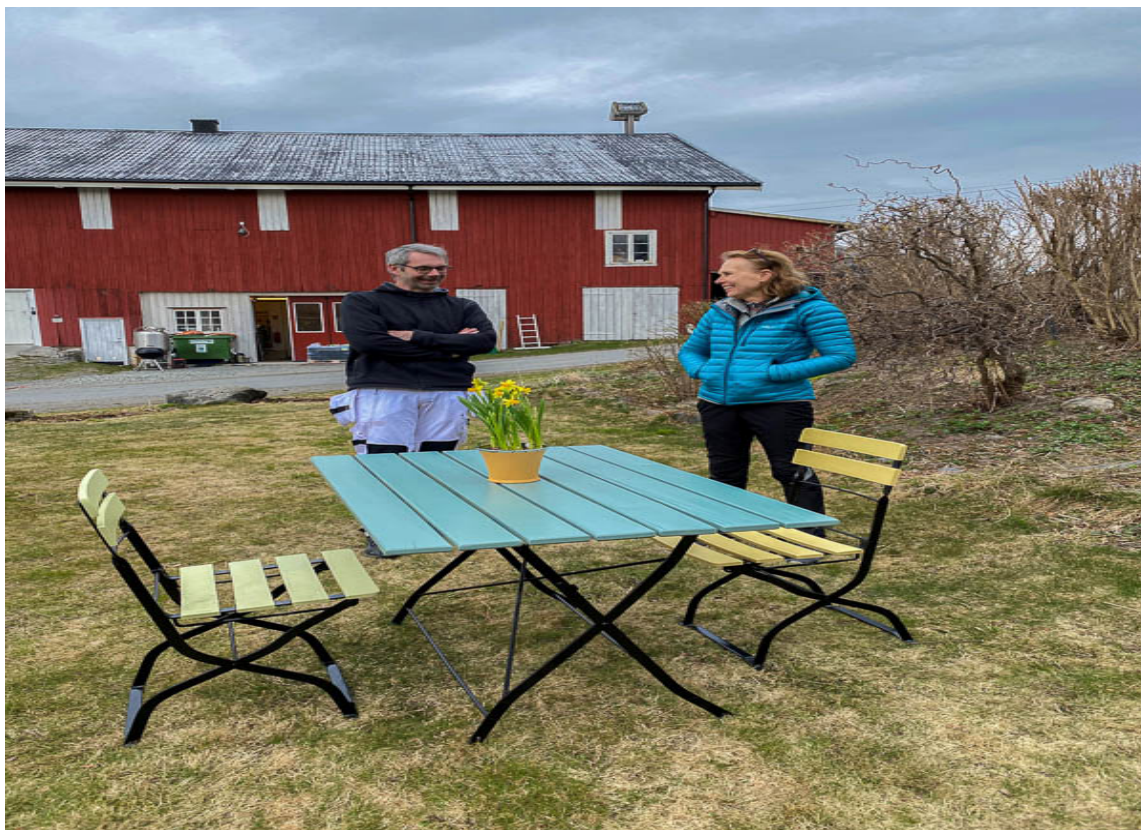
FORNØYDE: Teknisk sjef og produksjef hos Quick Bengalack er fornøyde med resultatet.