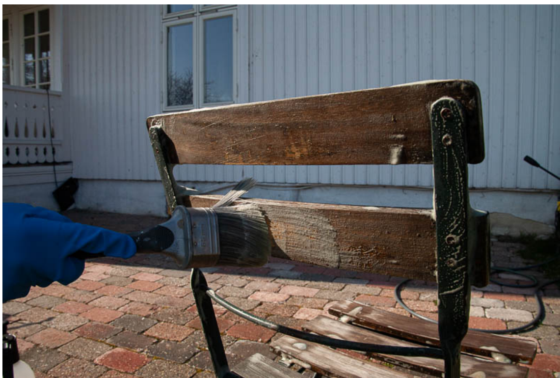
SKRUBB: Bruk gjerne en pensel til å skrubbe. Unngå for grov skrubb.