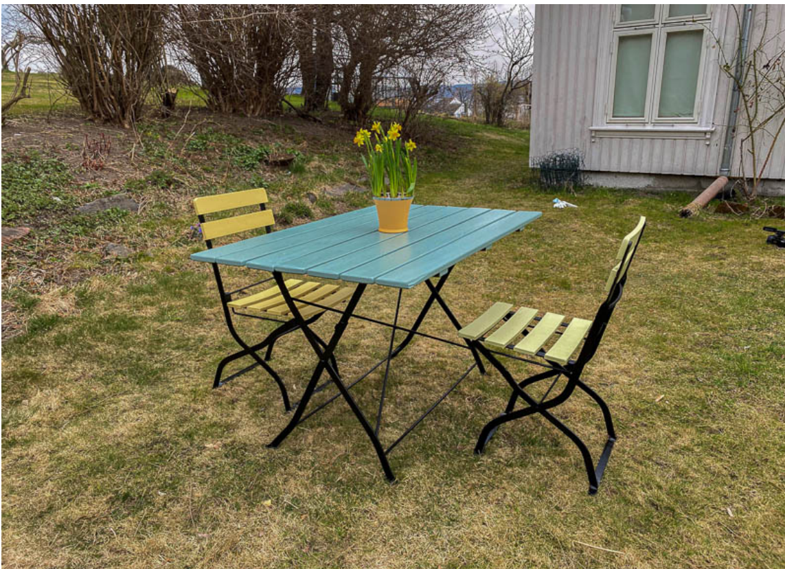
ETTER: En rustfri, frisk og fargerik sittegruppe som vil vare i mange år til.