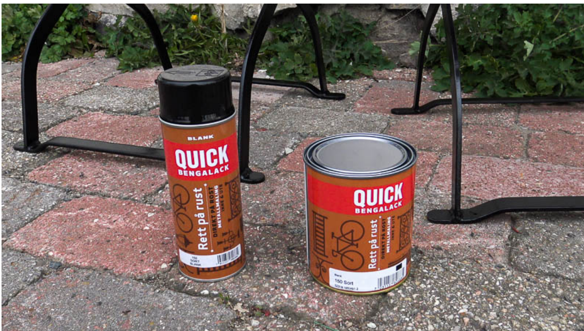
RETT PÅ RUST: Malingen finnes på spray og spann, og har rustbeskyttelse, grunning og toppstrøk i ett.