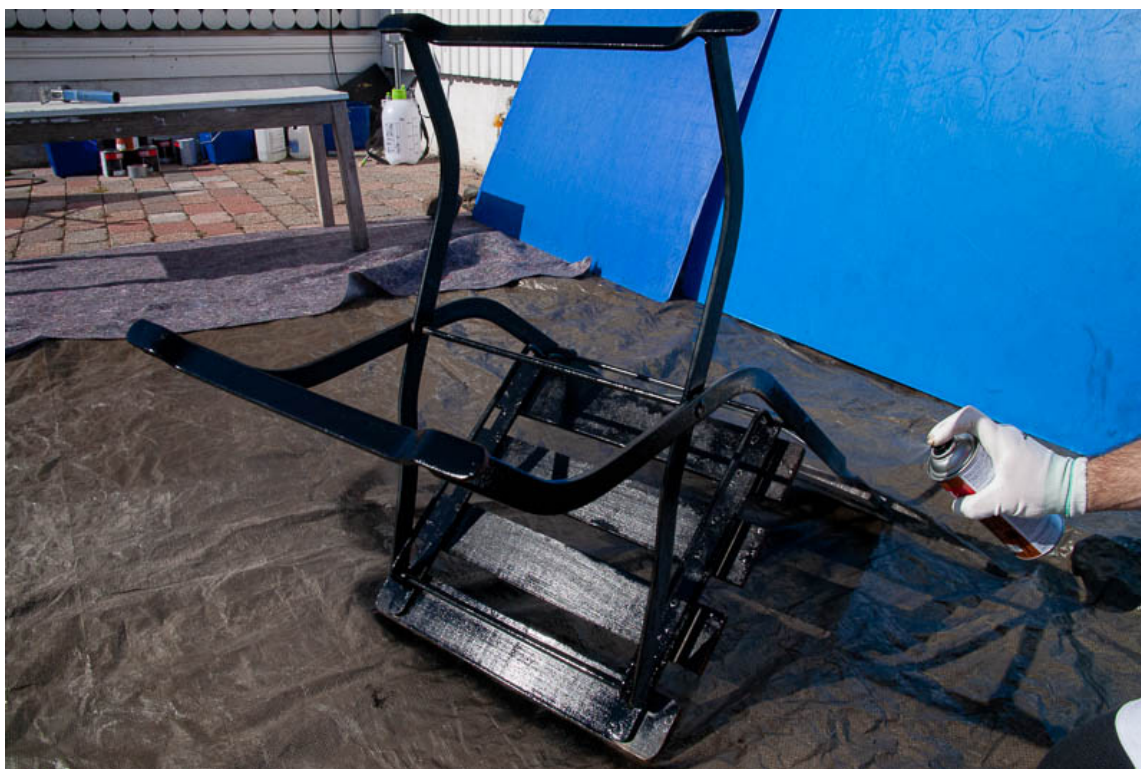
SPRAY PÅ METALLET: Der det er vanskelig å komme til bruker vi Quick Bengalack på sprayboks.