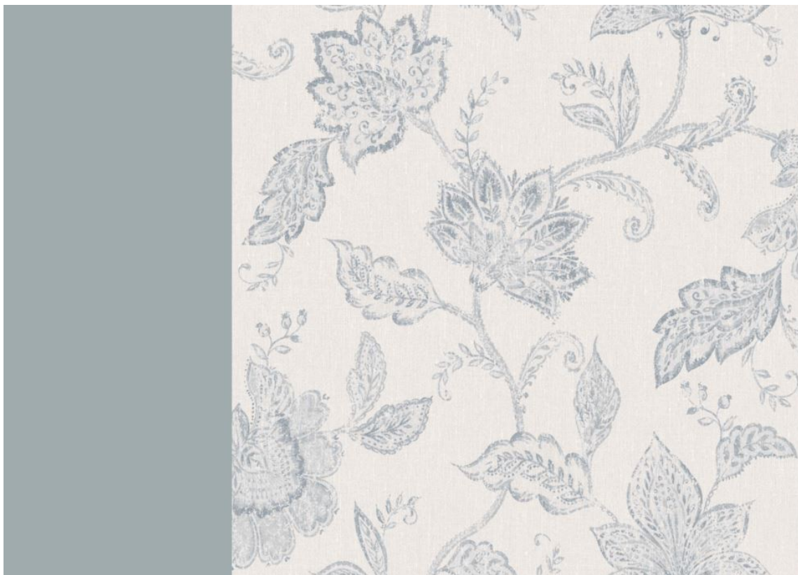
BLOMSTERTREND: Kombinasjonen blått og blomster er helt etter trenden i 2020. Her er Bølge kombinert med et design fra Oriental Dreams fra Borge.