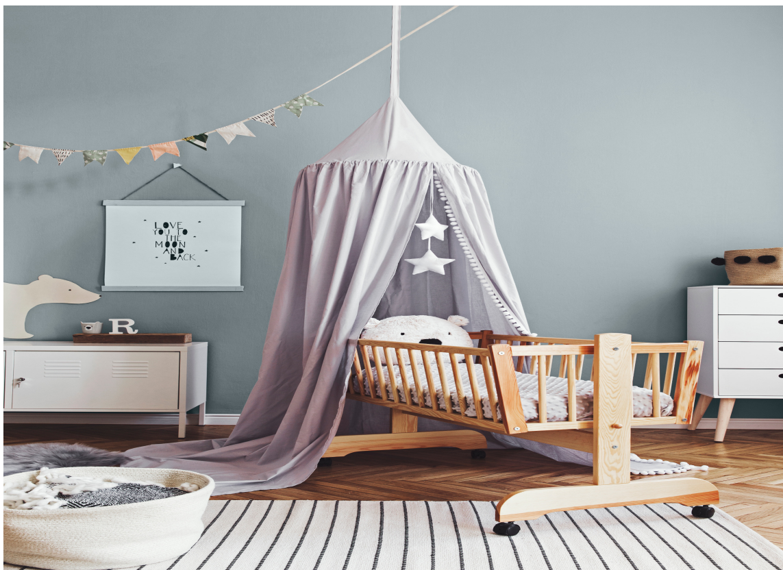
BLÅTT SOVEROM: Den blå BØLGE passer fint som veggfarge på soverom, både til barnerommet og foreldrenes rom.

som er meget fornøyd med kundenes favorittfarge.