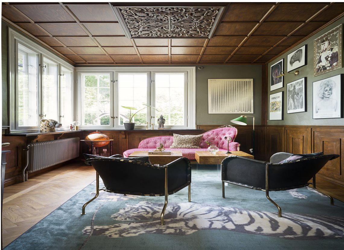
PERSONLIG: La deg inspirere og finn dine kombinasjoner. Skap den atmosfæren du trives med. Teppet her er fra Golvabia og designet av Lisa Bengtsson.