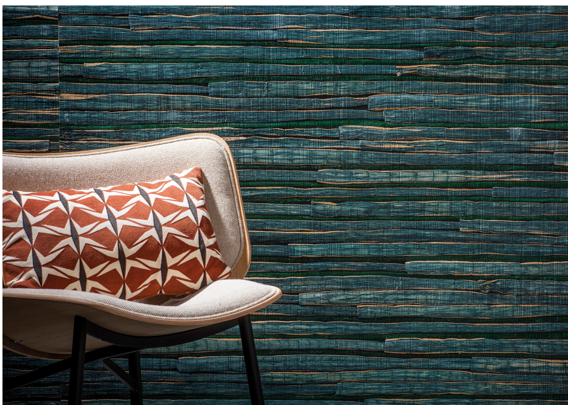
STRÅTAPET: Med tapet får vi farge, atmosfære og stil i en pakke. Tapetet Aruba fra Omexco har det taktile, farger og tyngd som gir god balanse mellom ro og livgivende energi. Tapetet er fra Intag.