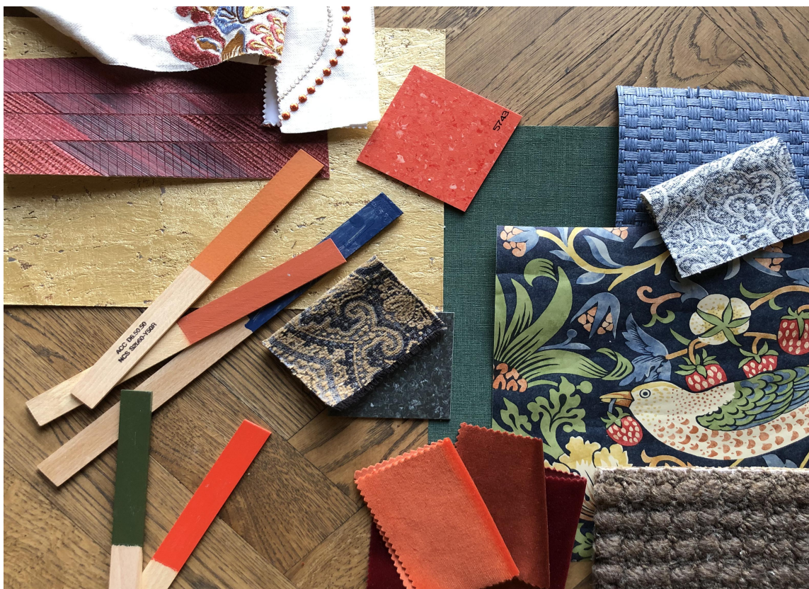
MØNSTER OG FARGER: Her er det er det stort rom for å boltre seg med ulike materialer, farger og mønster. Og du har funnet veien til et lunt, hyggelig og personlig hjem.