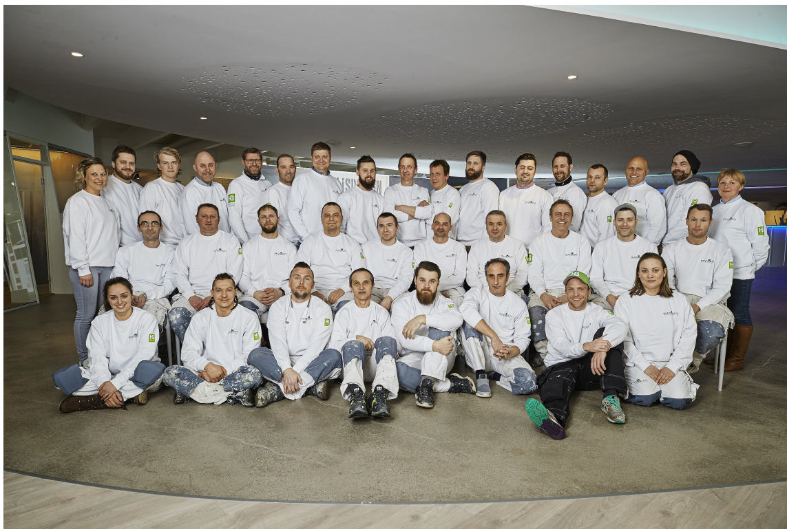
REGNBUEEN: De over 60 ansatte i Regnbuen Malermesterbedrift utfører alt av tradisjonelt malerarbeid, legging av gulvbelegg og tepper, flislegging, gulvsliping, totalentrepriser på fasaderehabilitering.