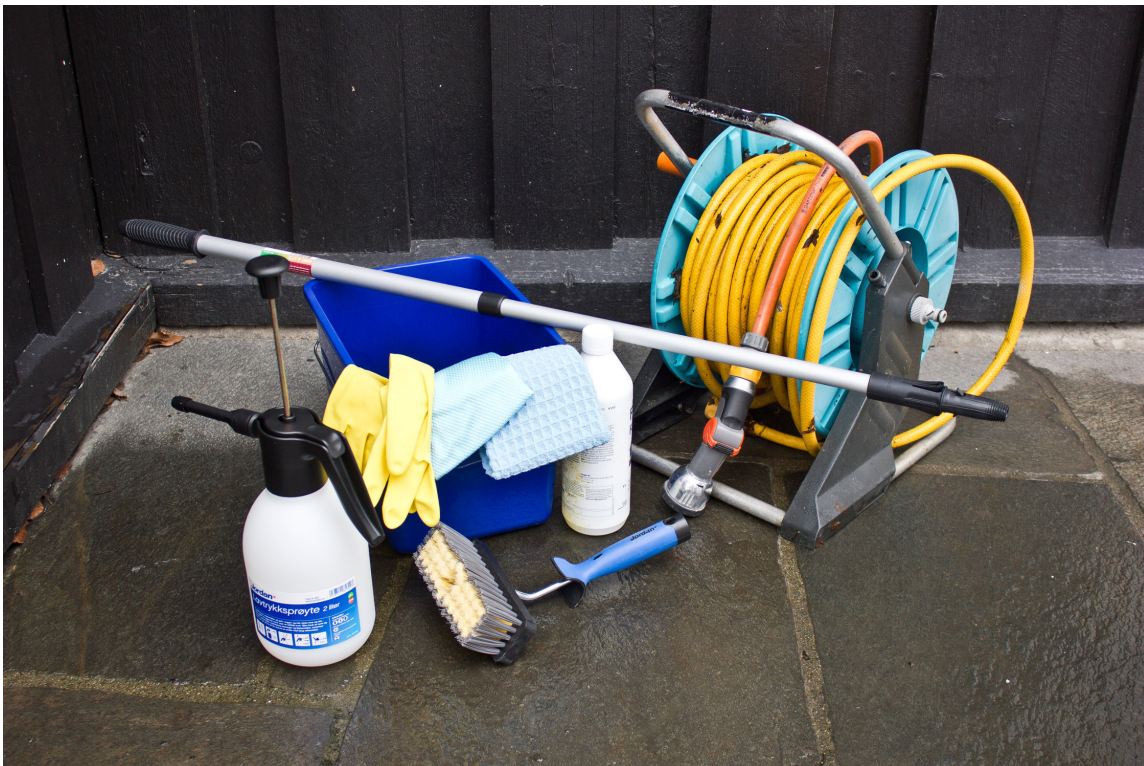
DETTE TRENGER DU: Det viktigste verktøyet er vann, såpe beregnet for husvask og en vaskekost.

Gardintrapp eller stige med støtte. Ved høyt hus kan det være behov for stillas eller arbeidsplattform. Hageslange koblet til vann, eller en høytrykksspyler med regulerbart trykk og skumdyse. Bøtte med varmt vann. Vaskekost med forlengerskaft. Rengjøringsmiddel beregnet for vedlikeholdsvask. Pumpekanne eller lavtrykkssprøyte. Gummihansker, vernebriller (eller solbriller om du ikke har) og slagstøvler