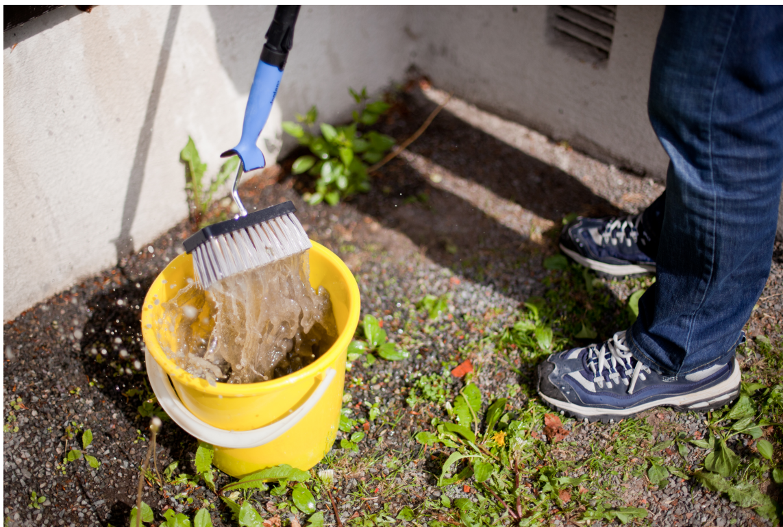
MEKANISK BEARBEIDING: Enten du påfører med lavtrykksprøyte eller med høytrykksvaskeren, bør fasaden koster for å fjerne smuss og begroing som sitter godt fast.