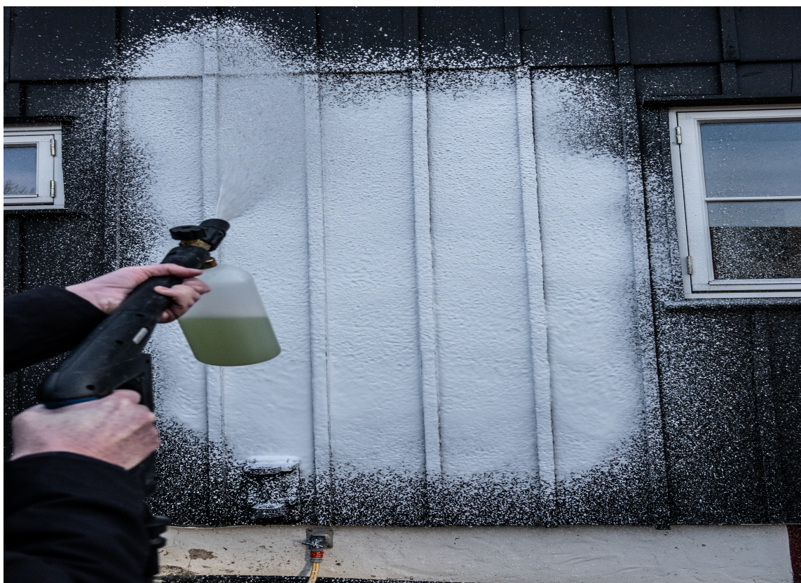
VEGGSJAMPO: Det finnes også midler som påføres med høytrykksvasker og skumkanon, og som danner et tykt skum som henger på fasaden i virketiden.