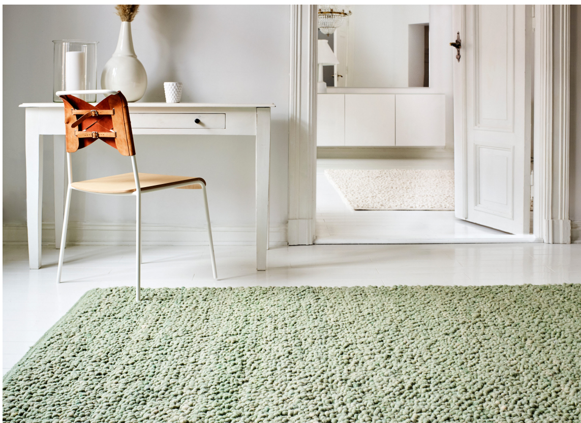
START: Lysten på mer farge og et personlig uttrykk kan også vekkes med et teppe. Det vevede teppet Sans fra InHouse gir rommet nytt liv, og finnes i flere aktuelle farger.