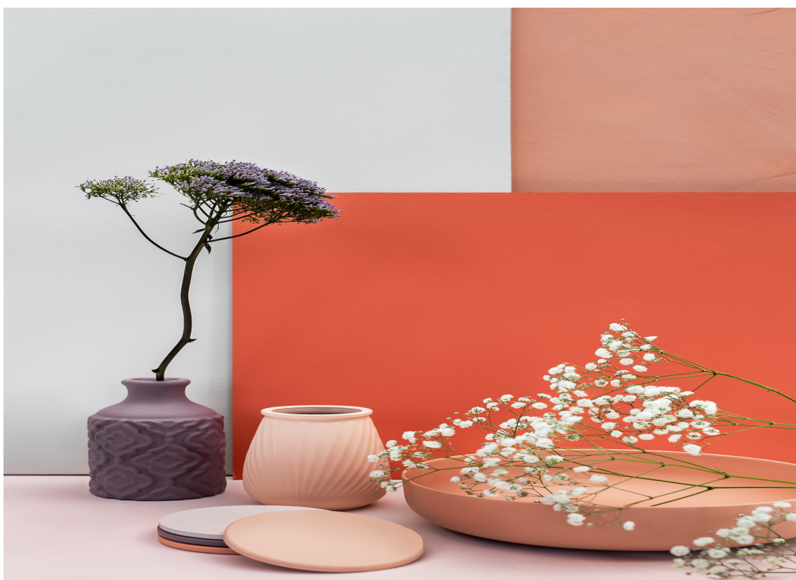
FAVORITT: I dette tema handler det om å finne farger og fargekombinasjoner som skaper glede. Da er det en god start å begynne med favorittfargene. Her fargene Coral, Licetto og Iris fra Pure & Original.