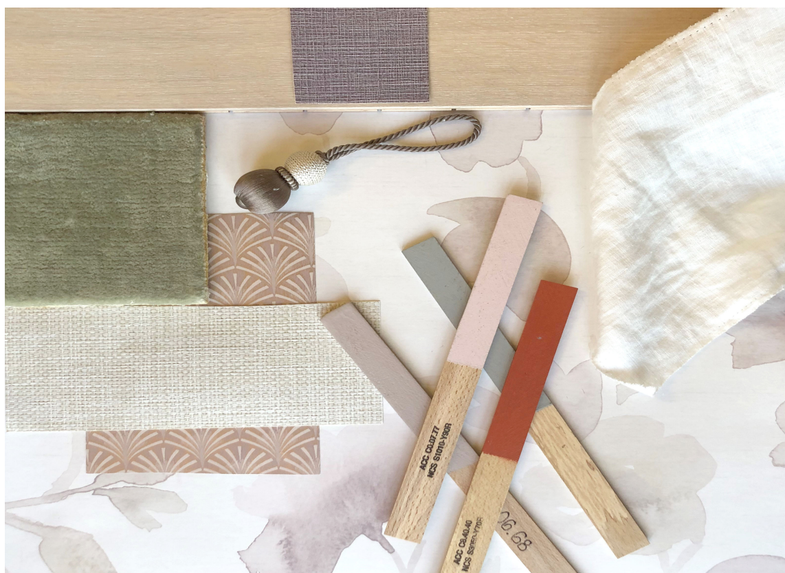
MATERIALER: Inspirert av moodboardet laget vi denne materialcollagen. I et lyst og rolig tema passer det fint med lette tekstiler, mye tepper og lyst treverk. Og en liten fargeklatt, for at det ikke skal bli kjedelig.