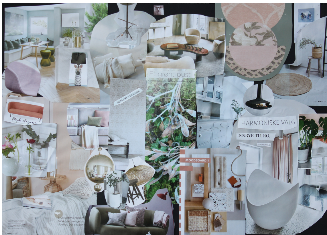
LYST OG ROLIG: Dette moodboardet viser Trendforums bilde av det «lyst og rolig interiøret anno 2020»: Mer farge, større mangfold i materialer og et varmere uttrykk med innbydende tyngde.