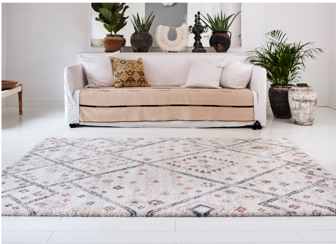
LUNT MED TEPPE: Det sandfargede teppet i sofaen, gulvteppet med lubben luv og rolig mønster, samt grønne planter gir den hvite stuen en hyggelig og innbydende atmosfære.