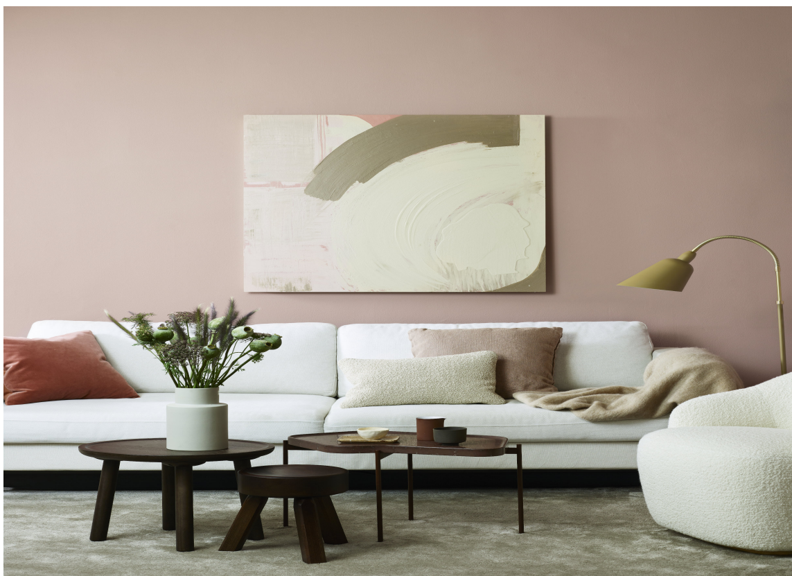
MYKERE: Flere nyanser av rosa kombinert med beige og hvit, runde former, tepper og myke tekstiler –det blir lyst, mykt og rolig. De mørke bordene er en fin kontrast og du unngår at det blir for søtt og feminint. Veggene er malt med Soft Pink fra Beckers