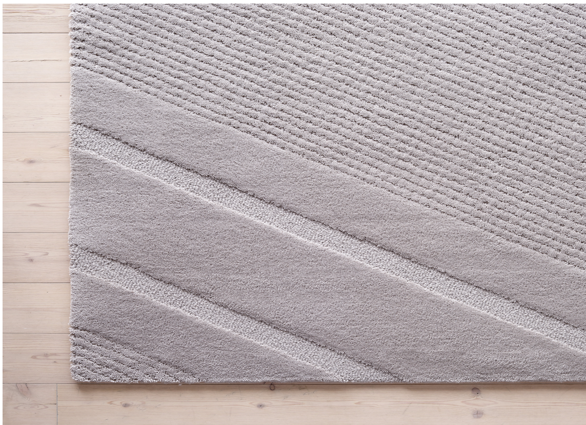
SKISPOR: Mønsteret i snøen som dannes da preppemaskinen lager skispor kan du nu ta inn i stuevarmen.