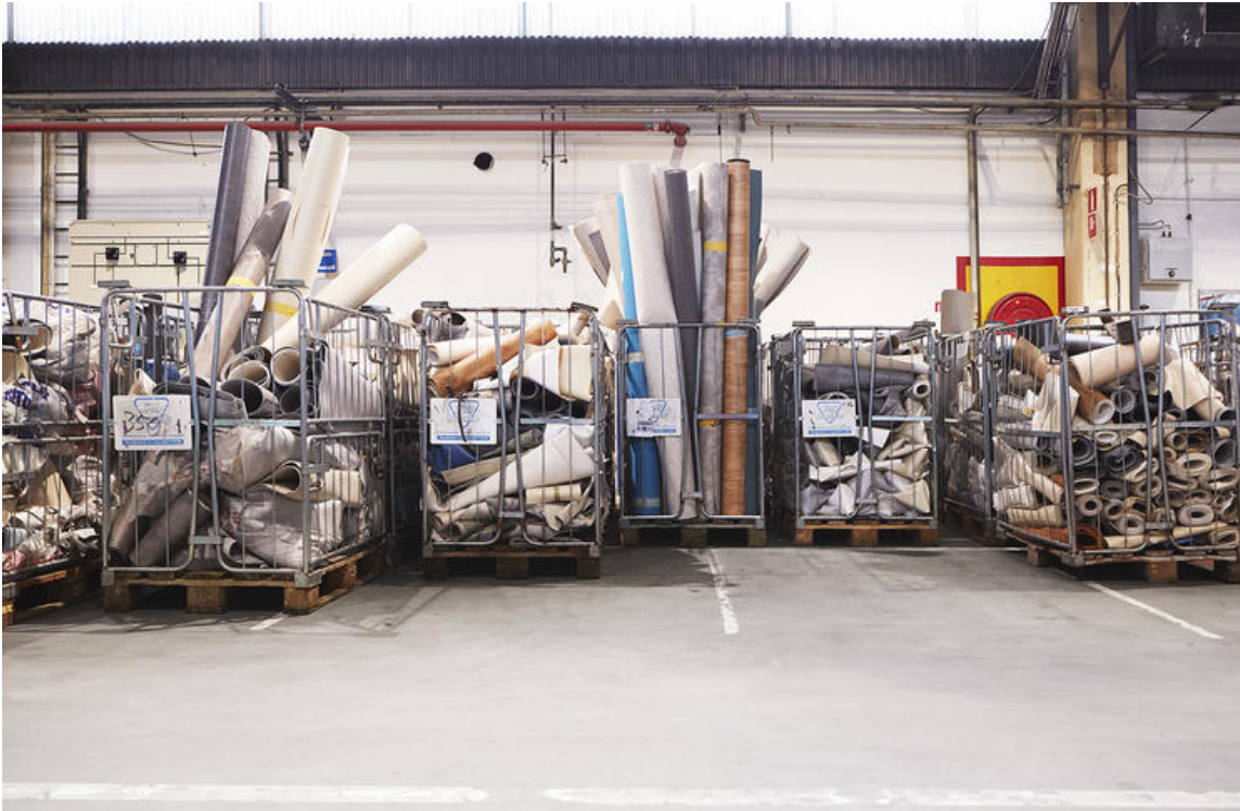
RESTART: Tarkett tar tilbake kapp og rester etter gulvinstallasjon av vinyl og designgulv, og sender det til gjenvinning.