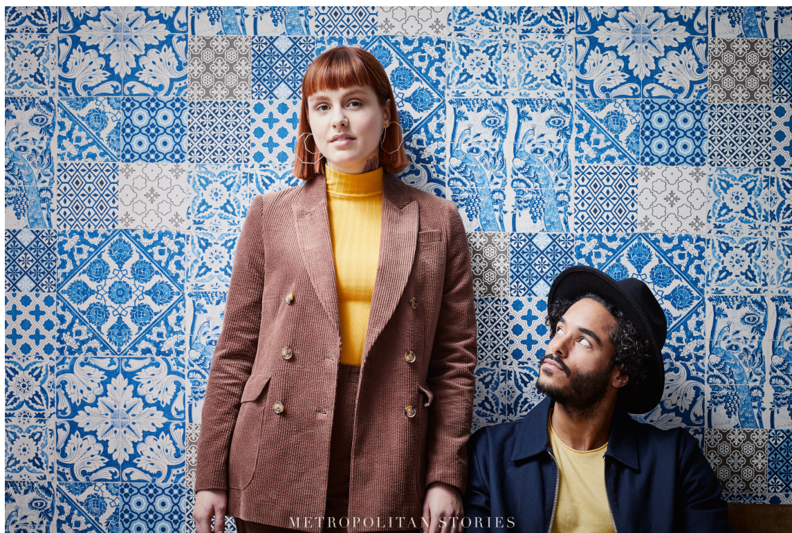
BLÅ VEGG: Blått er en farge vi kan stole på. Her representert av et tapet fra kolleksjonen Metropolitan Stories, fra Storeys.