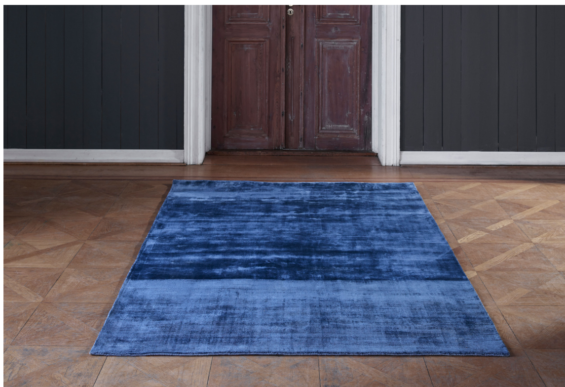
GÅ TRYGT: Den koboltblå fargen tilbyr stabilitet, fasthet og forbindelse, og er samtidig en god fargeklatt i dette teppe fra InHouse.