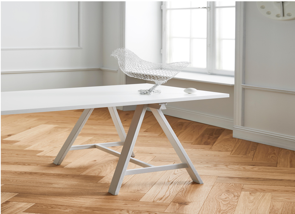
TIDLØST: Segno Eik er naturlig og tidløst, og treets naturlige utseende kommer godt frem. Den mykt børstede overflaten og de skrå kantene skaper et uttrykksfullt og vakkert gulv.