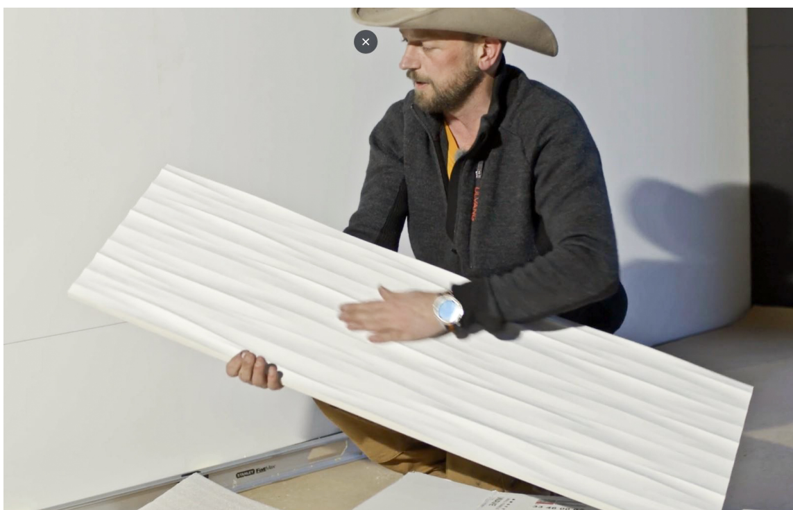
LEVENDE: For å få det mer organisk og en struktur på veggene, valgte Eventyrlig Oppussing-teamet å montere Wall Panels fra Deco Systems. Med bølgestrukturen på platene tas havet med inn i spisestua.