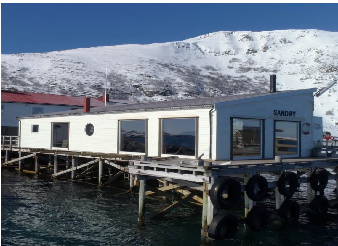
KAIHUSET: Det gamle kaihuset er omgjort fra et nedlagt fiskemottak. Det ligger idyllisk til i havgapet.