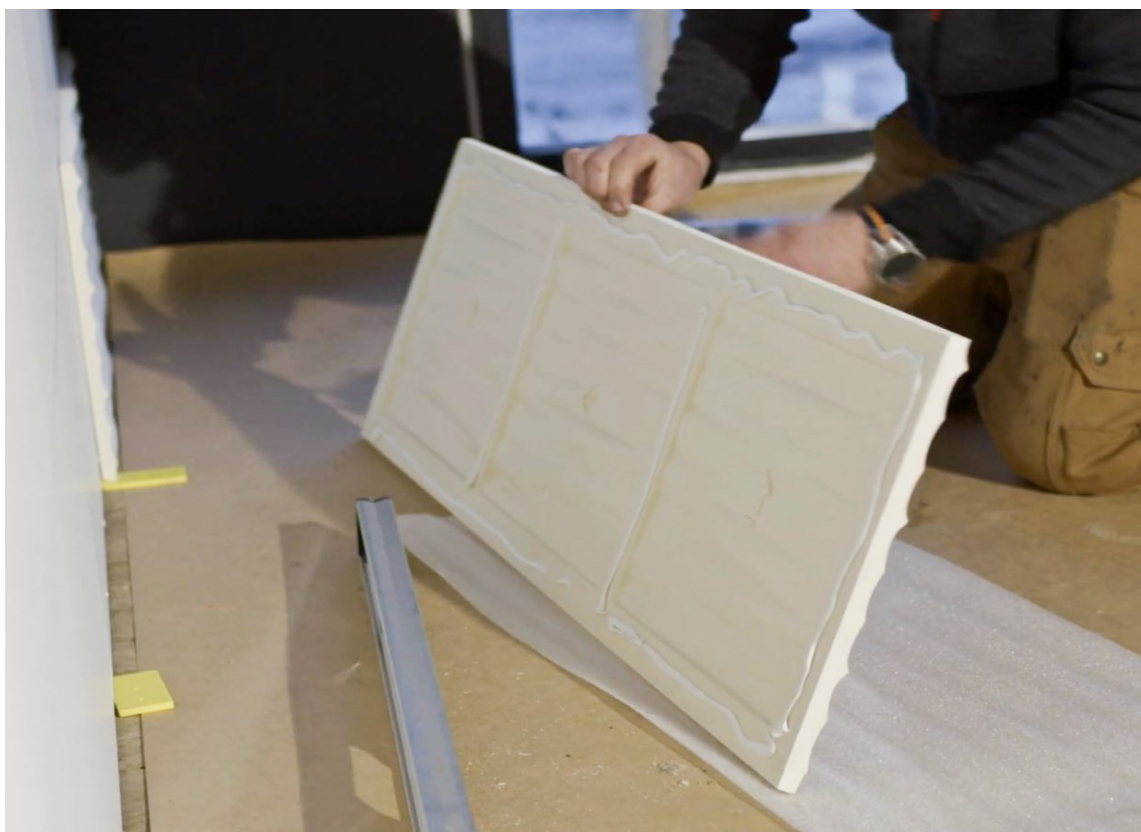
ENKELT: Wall Panels er enkle å montere rett på veggen, og leveres klare for overmaling.

Arstyl dekorplater er laget av Polyuretan, er meget lette i vekt og enkle å beskjære til ønsket størrelse og form.