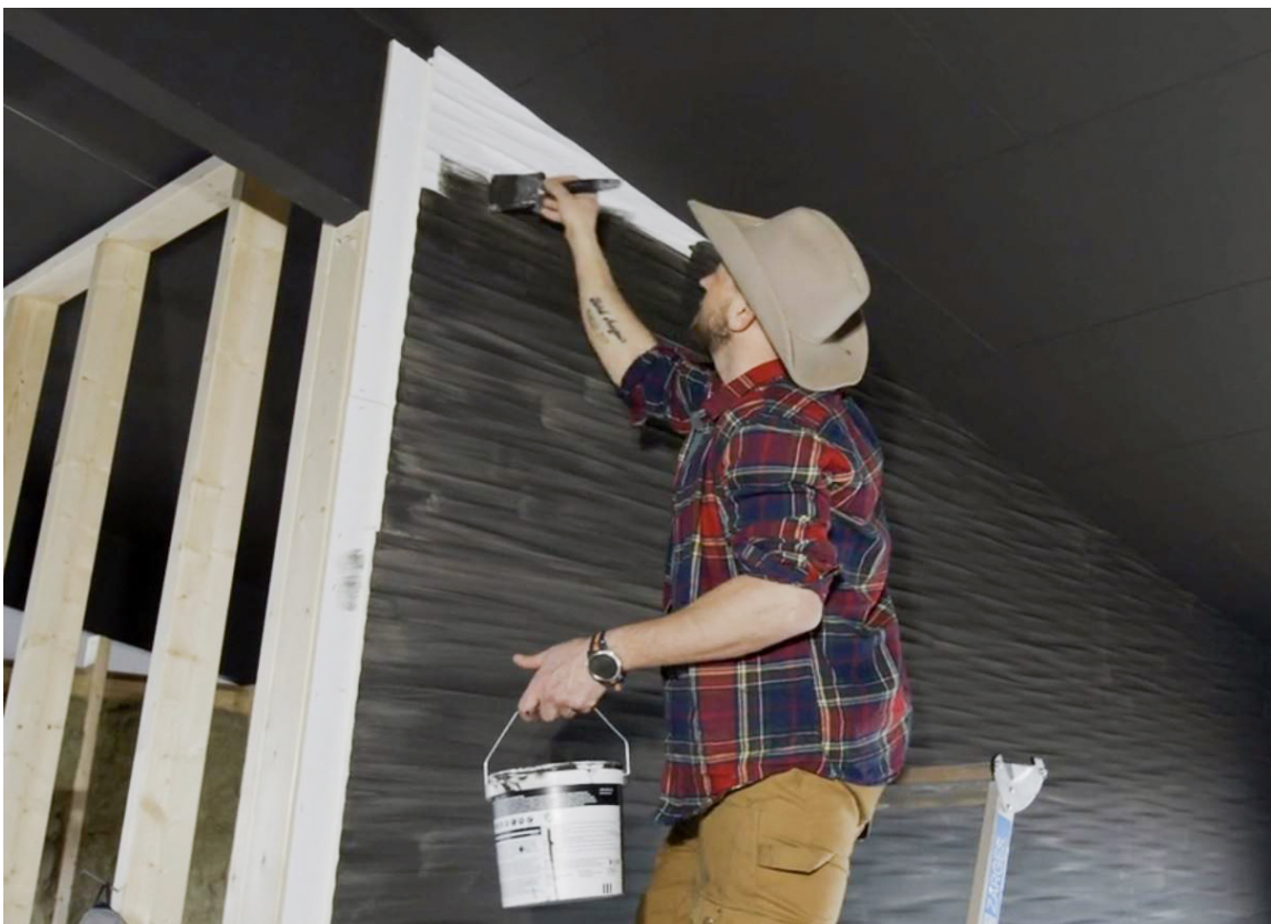
SORT: Etter montering blir platene malt mørke som natten. Da kommer mønstereffekten fram på alvor.