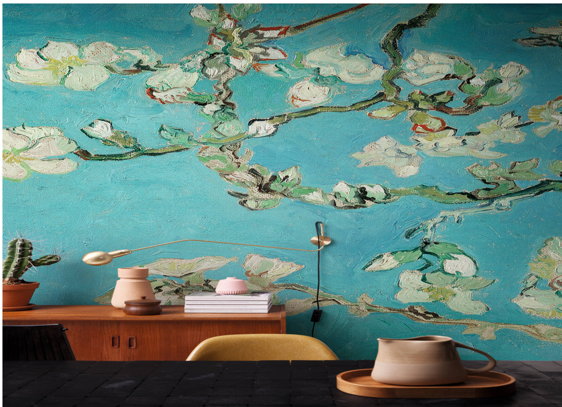
PANEL: Det blomstrende mandeltreet er overført både til tapet på rull og digitalt veggilde. Penselstrøkene er så levende at du må bort å kjenne om malingen er tørr.

Hvis stuen ikke er stedet, så vil disse tapetene også være flotte i rom vi oppholder oss mindre i, for eksempel i en gang eller på et toalett.