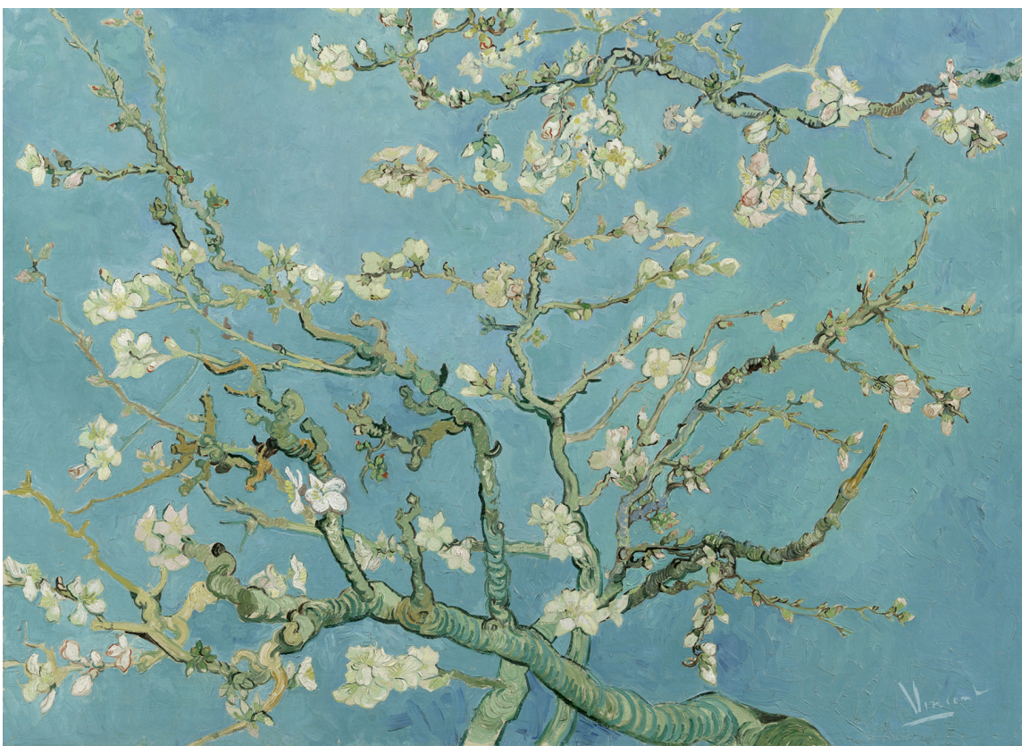
MANDELTRE: Van Goghs fasinasjon for japansk postkort-kunst gjenspeiler seg i mange av hans bilder. Slik som motivet av blomstrende mandeltre.