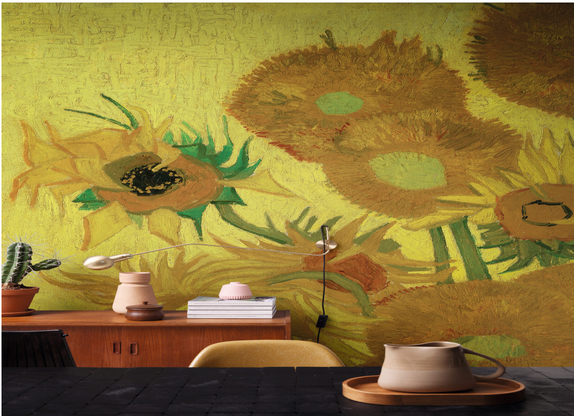
SOLSIKKER: Nå kan du få Van Goghs kjente solsikker direkte på veggen hjemme.