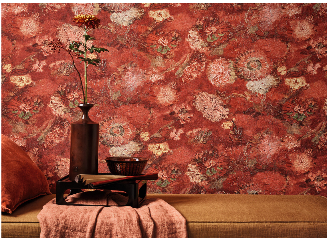
BLÅTT LANDSKAP: Van Gogh malte «Landscape with houses» i Auvres-sur-Oise i mai 1890 vel en måned før han døde. Her er det gjenskapt som hollandske flismønster og tar landlig sommerstemning inn i kjøkkenet.