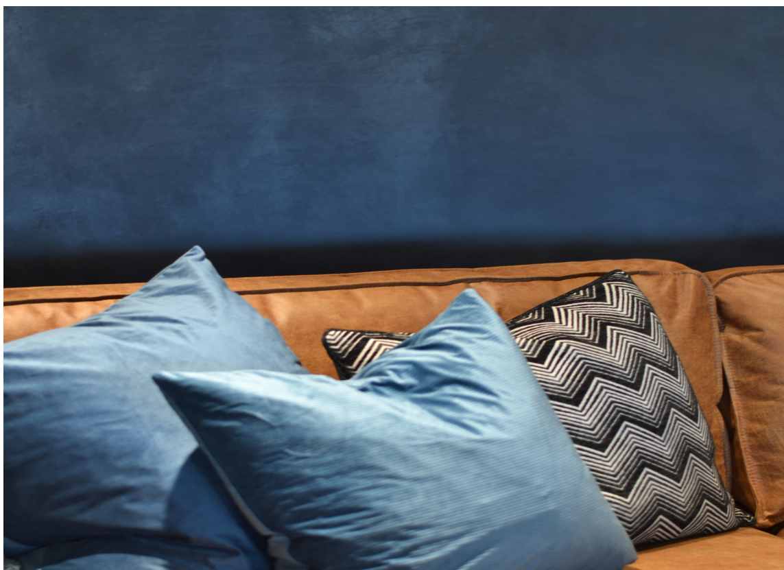
MØRKE FARGER: Spillet i overflaten kommer bedre fram jo mørkere fargen er.