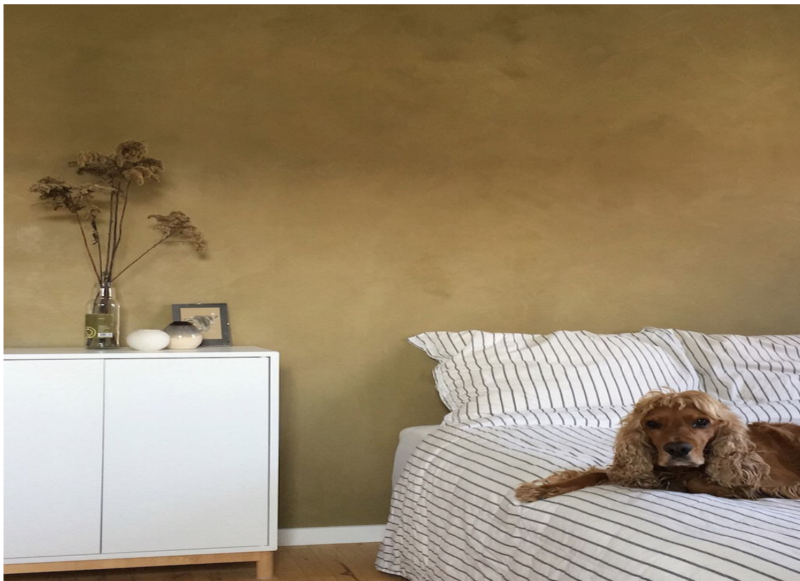
GULT: Den unike sparkelen gir et livlig spill til veggen, som du ikke oppnår med vanlig maling. Her er det brukt fargen Moss.

– KC14 Classic er en finkornet sparkel som gir en mykere struktur og finish. KC14 Raw er en grovere sparkel, som gir en mer strukturert, rustikk overflate. Fellesnevneren for dem begge er at resultatet blir vegger med en levende effekt, som ikke kan oppnås med vanlig maling, sier Dahl.