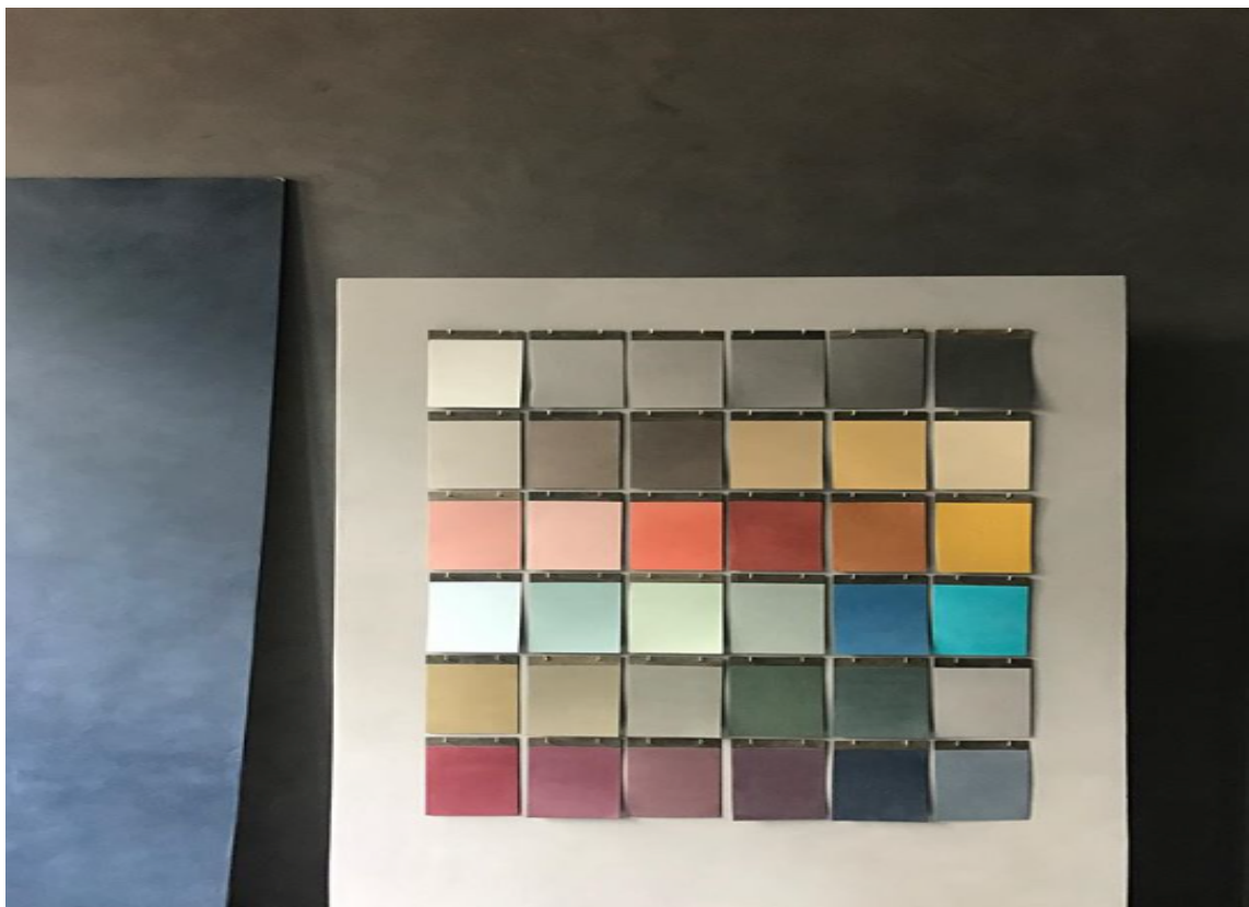
TRENDFARGER: Fargepaletten spenner fra de lyse, mer nøytrale nyansene, til de dype, mørke nyansene. Paletten er utviklet i samarbeid med trendforskere og designeksperter.