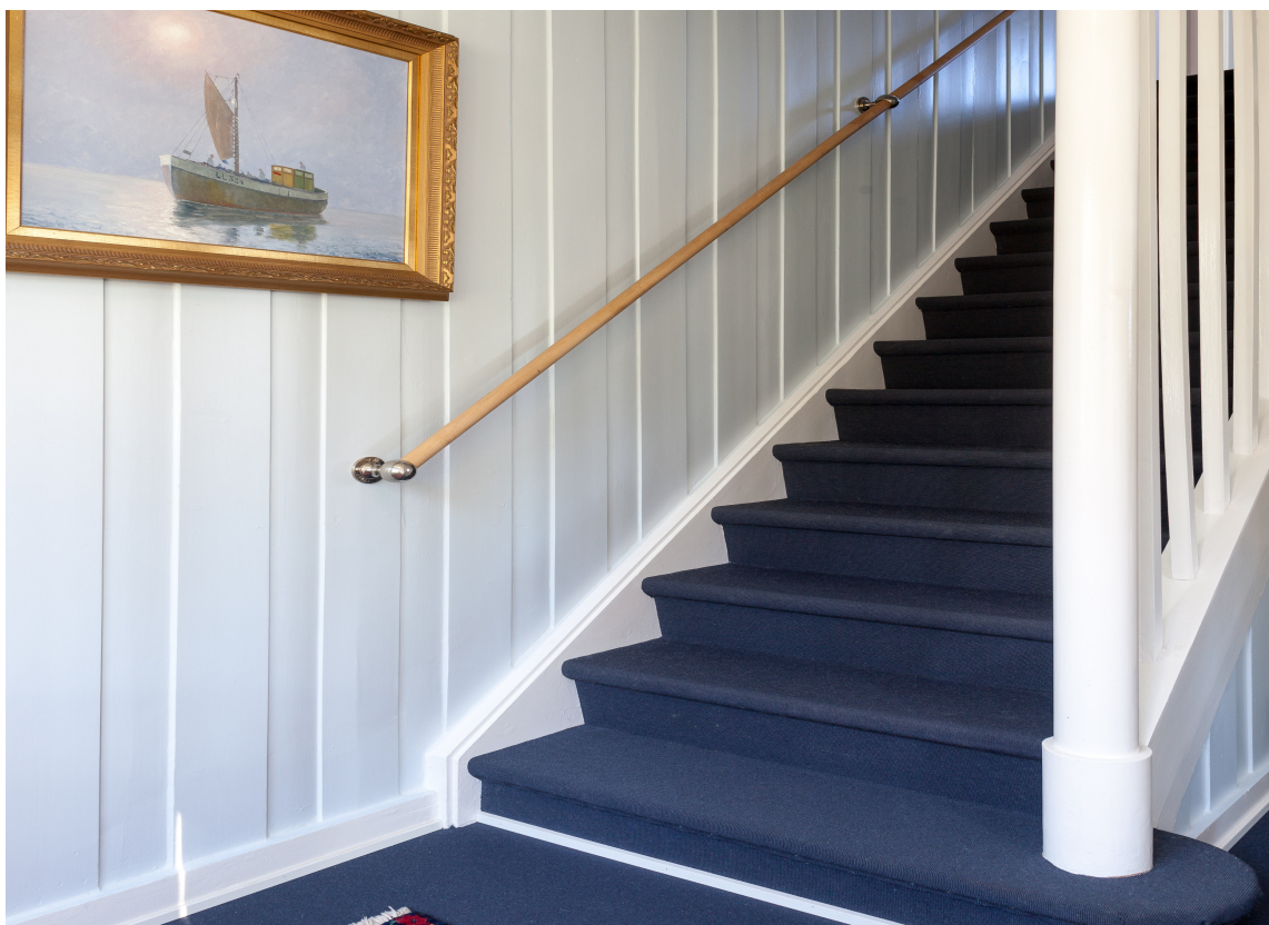
TEPPER: Det blå teppet fortsetter inn i gangen og opp trappen. Her er det lagt både på trinn og opptrinn. I tillegg til å se fint ut, demper teppet lyd og gjør trappen mer sklisikker. Teppet er fra Danfloor, Eco Weave farge 3920082.