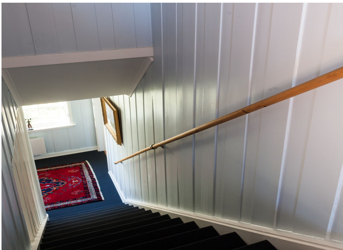
FAVORITT: Veggene i gangen er malt med en annen av hans favoritter, en dus blågrå. Isblå, kaller han den, og får et ekstra løft av det blå teppet. Farge: Shiny Le Havre fra Nordsjö.