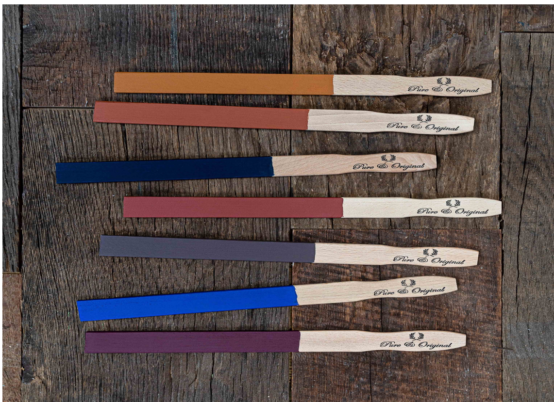
HØST OG VINTER: Den nye kolleksjonen er inspirert av fargene vi omgir oss med både inne og ute om høsten og vinteren.