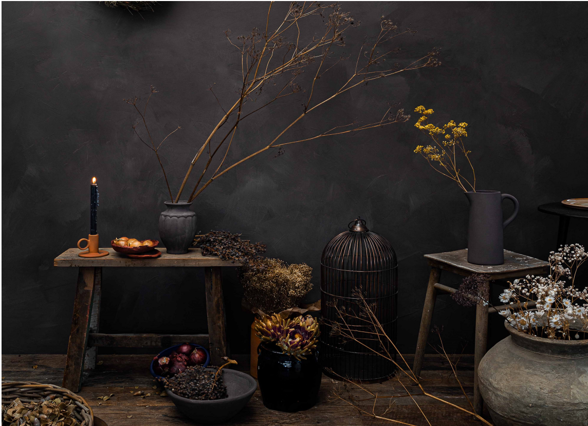
MØRKE TIDER: Bohemian Vintage er en mørk grå, som i kombinasjon med oransje, gult og brente rødtone, gir en intens dybde til rommet.