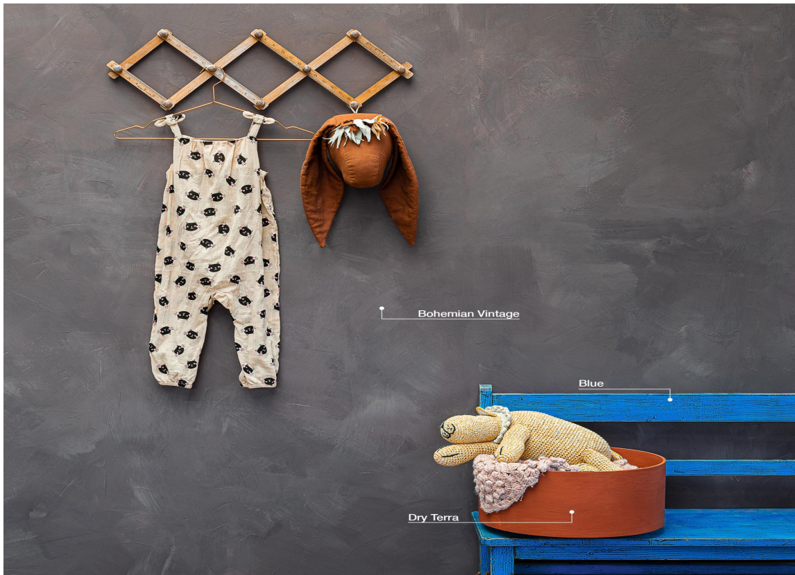
MALINGTYPE: De nye fargene fås i alle Pure & Original sine ulike malingtyper, fra kalkmaling til gulvmaling og matt veggmaling.