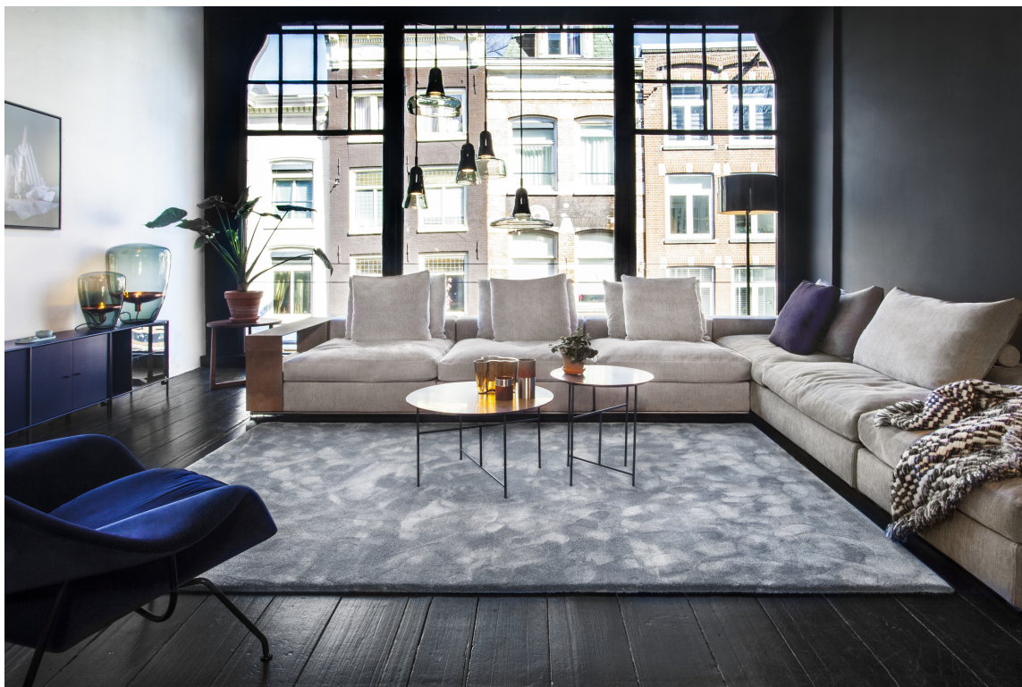
MYKT: Den blå stuen får en myk og hyggelig atmosfære når sofagruppen rammes inn av et tykt teppe. Teppet er fra Intag/Van Besouw.