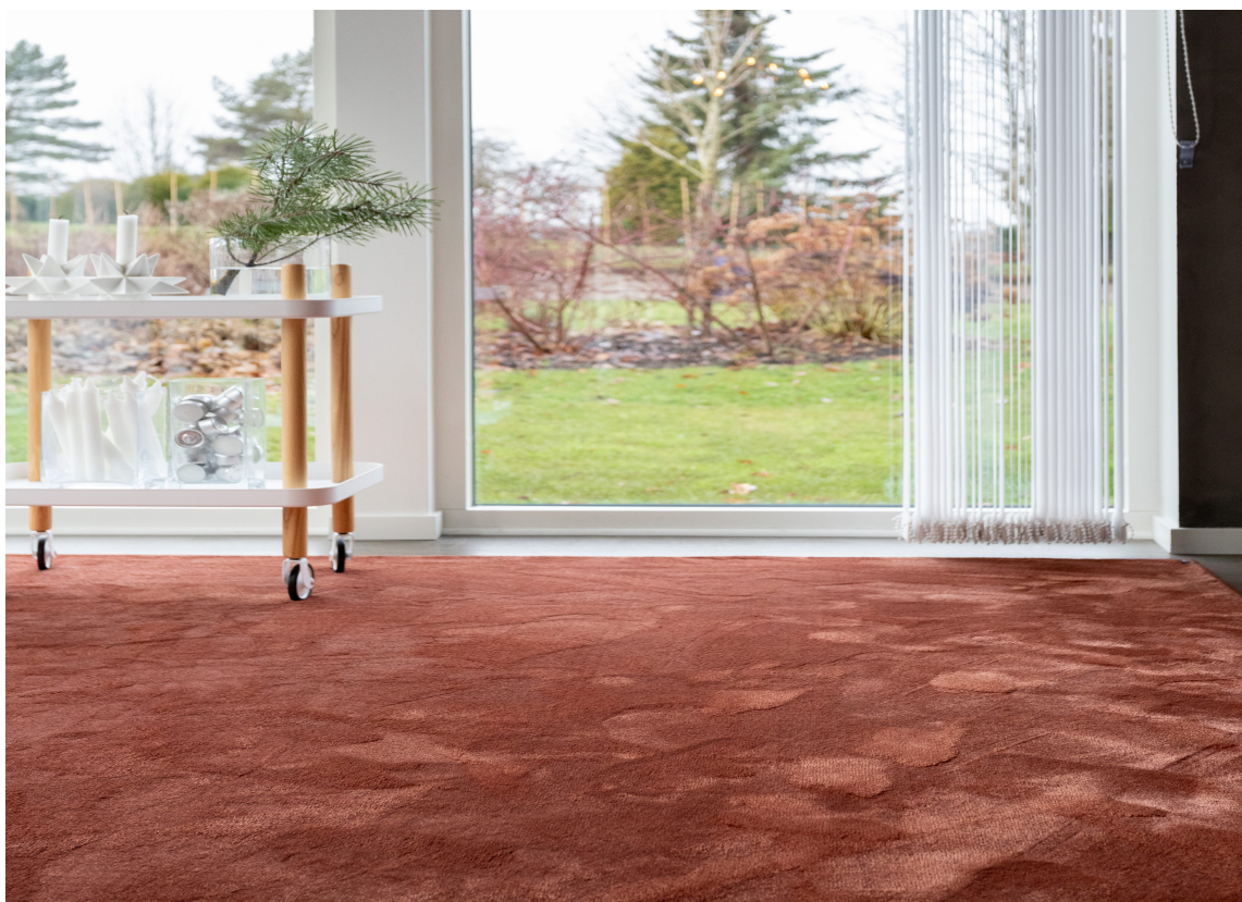
GRACE: Et velurteppe med flott spill i herlig høstfarger varmer både for øyne og føtter. Teppet leveres på mål av Golvabias forhandlere.