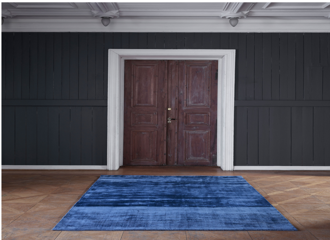
ENERGI: Et teppe i frisk nyanse av veggfargen luner for føtter og kvikker opp interiøret som en liten vitaminpille. Teppet Nuuk fra InHouse.