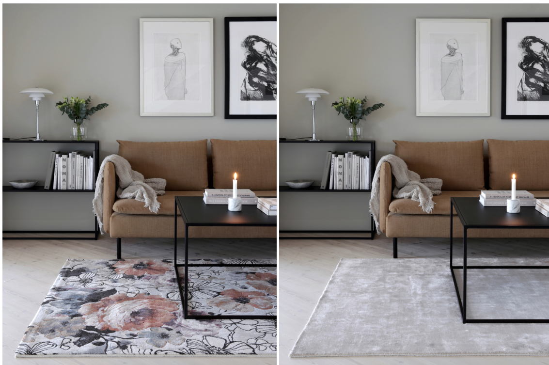
MULIGHETER: Mønster eller ensfarget gir to helt forskjellige uttrykk. Er du usikker så spør i butikken om du kan få låne dem med hjem og teste.