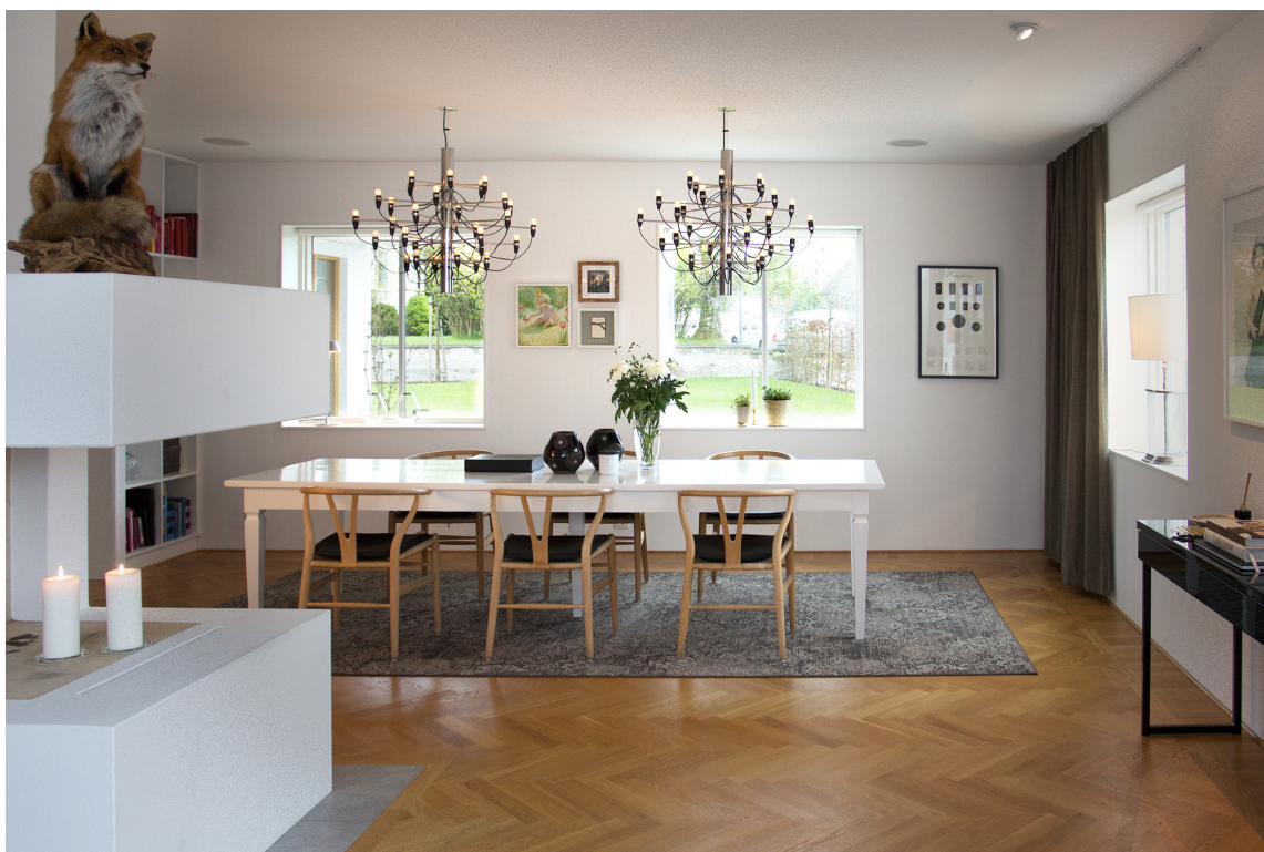
LUNERE: Den lyse og luftige sommerstuen får et lunere preg med teppe under spisebordet. Teppet Grand Bazar fra Golvabia leveres i ønsket størrelse.