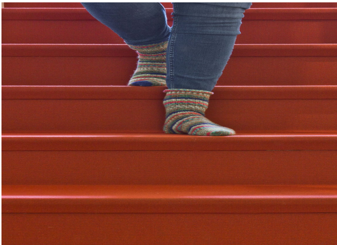
TRYGT TEPPE: Et hellimt teppe med lav og tett luv er blant det sikreste du kan ha i trappa.