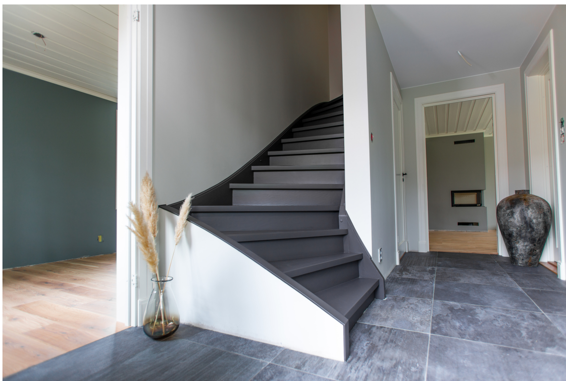
NYMALT: Start på toppen og mal deg nedover. Denne trappen er malt i to strøk med TreStjerner Gulvmaling Matt i fargen 992 Lava.