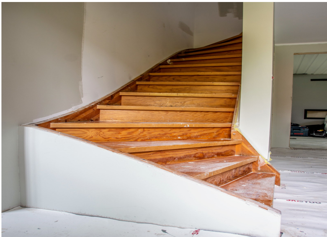
TRAPPEMALING: En slitt trapp i furu eller eik kan få nytt liv med maling. Vask godt, mattslip og påfør grunning, før trappen males med to strøk gulvmaling.