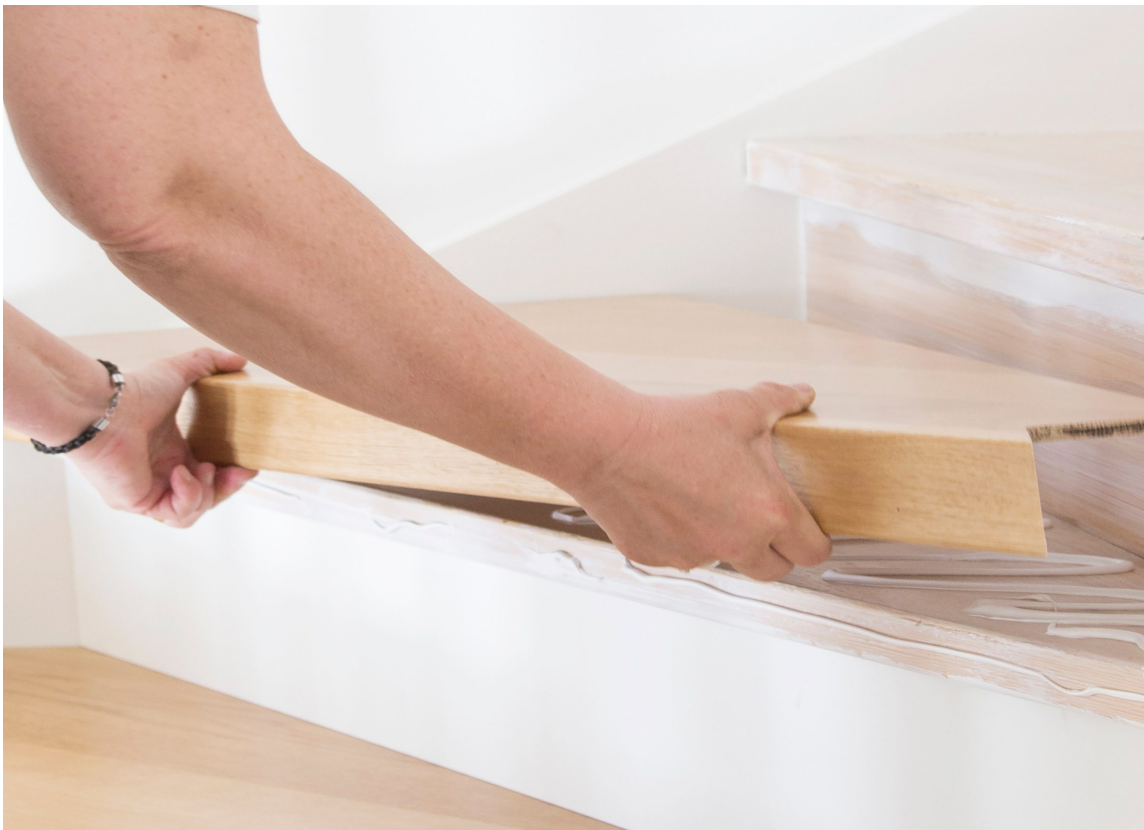
NYE TRINN: Ved å montere ferdig fornyelsestrinn, som kommer i ulike farger og overflatebehandlinger, får du raskt ny trapp.