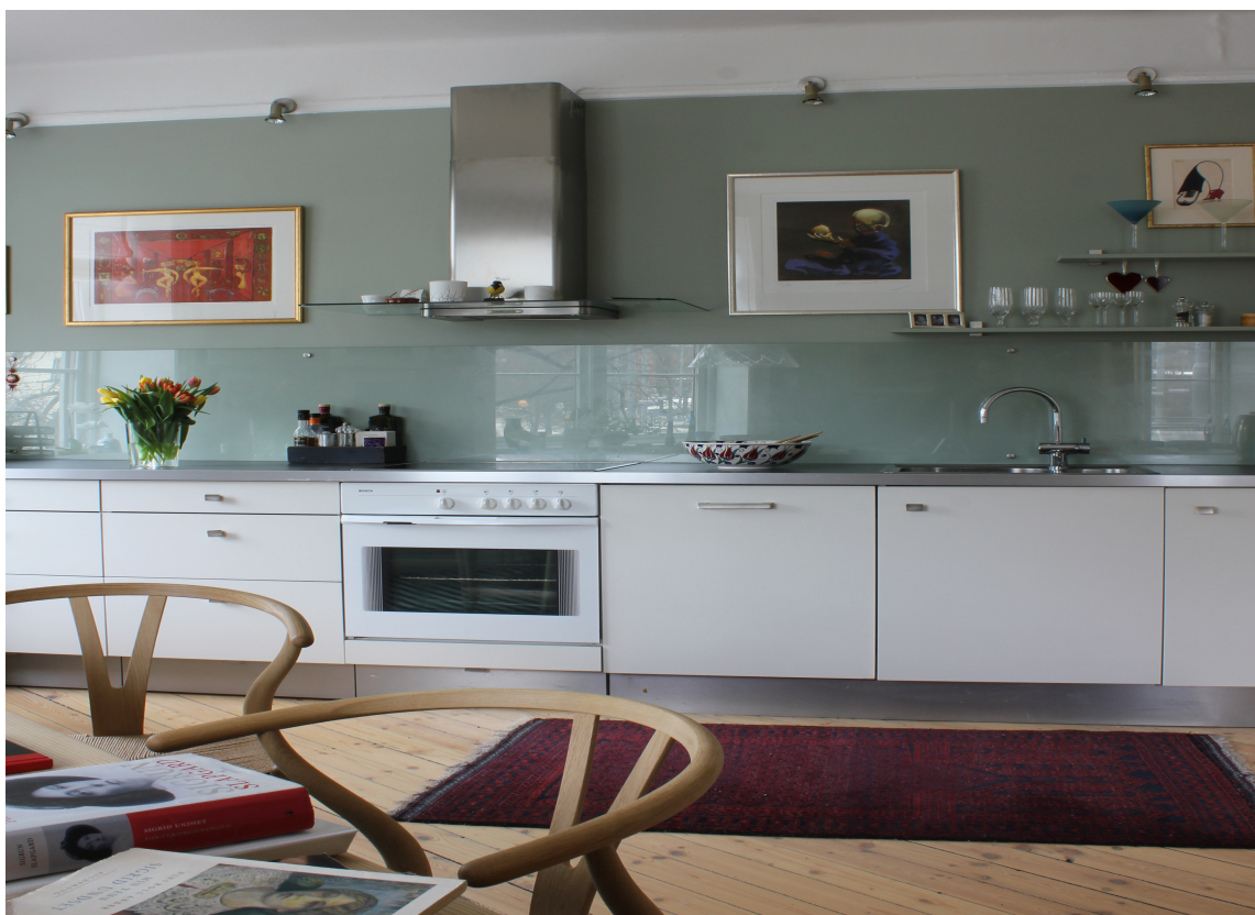
FAVORITT: Hun landet på favorittfargen, og har ikke angret en dag. For mørk denne? Ikke i det hele tatt!