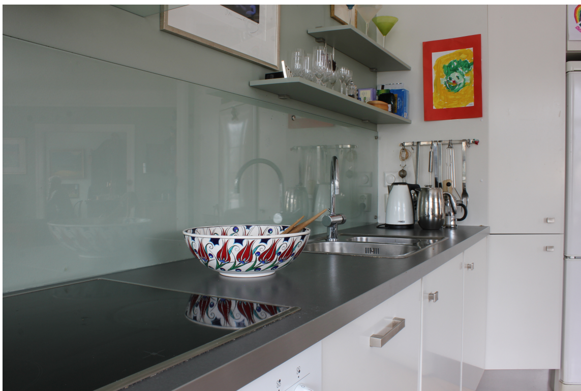
GLASSPLATE: Veggene er malt helt ned til kjøkkenbenken. Den malte veggene skjermes mot sprut fra kokesone og vask med en glassplate som er montert over benken.