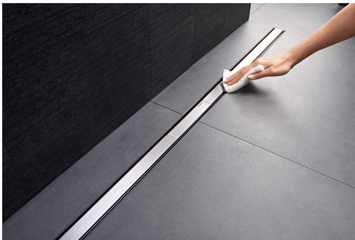
DESIGNSLUK: Det nye sluket ligger som en smal rist langs veggen. Lekker å se på og enkel å holde ren. Dette er Clean Line 60 fra Geberit.

Også planlegging og montering av rett sluk til ditt bad bør gjøres sammen med rørlegger.