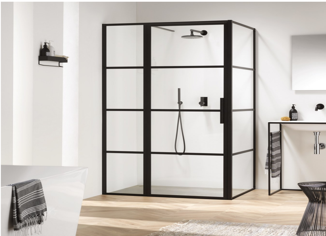
BAD 2020: Med sorte detaljer, malte vegger og gulv med fliser lagt i fiskebeinsmønster viser vi at vi er på vei mot 2020. Dusjveggene Soho er fra Coram/Rørkjøp.