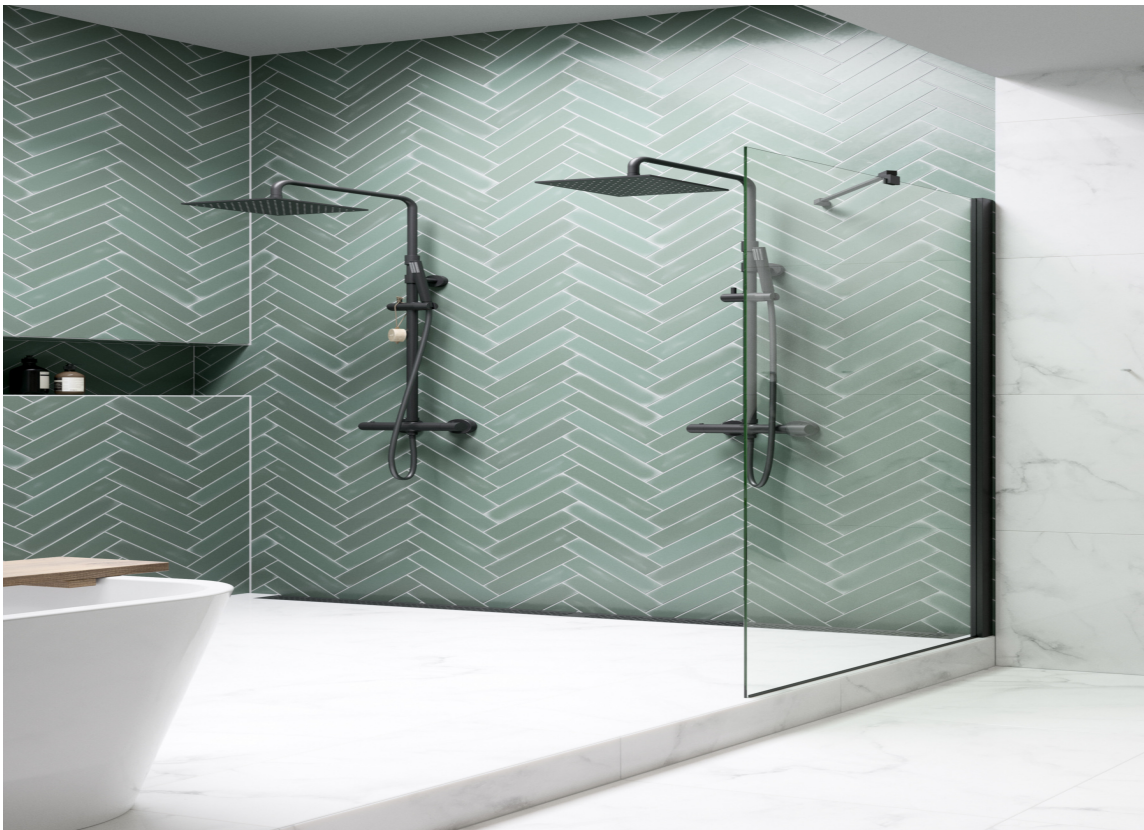
SORT: Sort armatur er ikke forbeholdt det maskuline badet. Nå passer det inn også på et mer femint bad. Armatur fra Vikingbad/Rørkjøp.