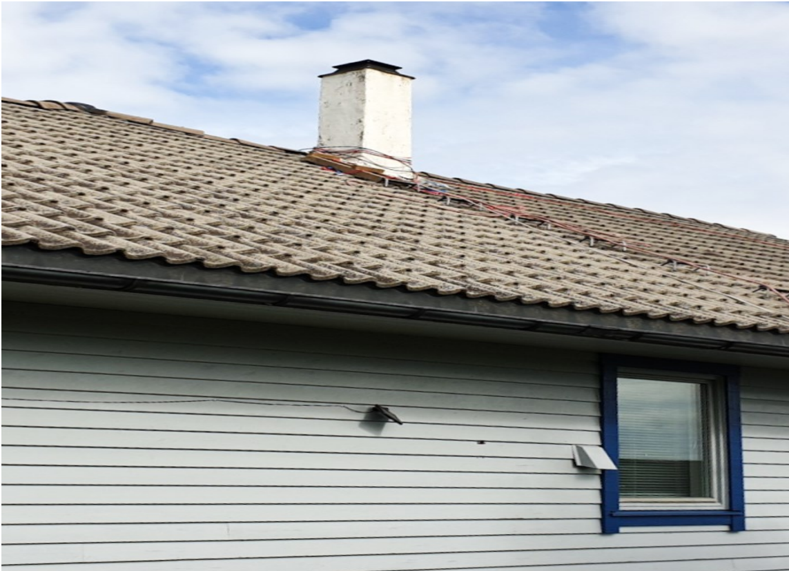
FØR: Taket var slitt og sterkt preget av Vestlandets vær og vind. Det trengte så en oppgradering.