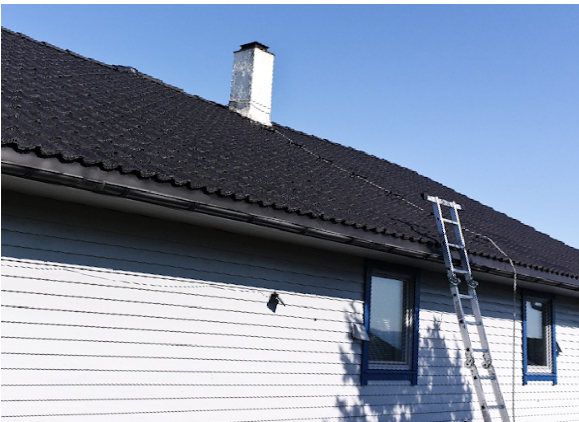
ETTER: Huset ser helt annerledes ut med nymalt tak – nå kan Roy vise det stolt fram i nabolaget.