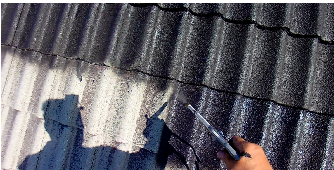
ENKELT: Roy gjorde hele jobben selv, og skryter av den enkle prosessen. Det letteste er å påføre malingen med en høytrykksprøyte.