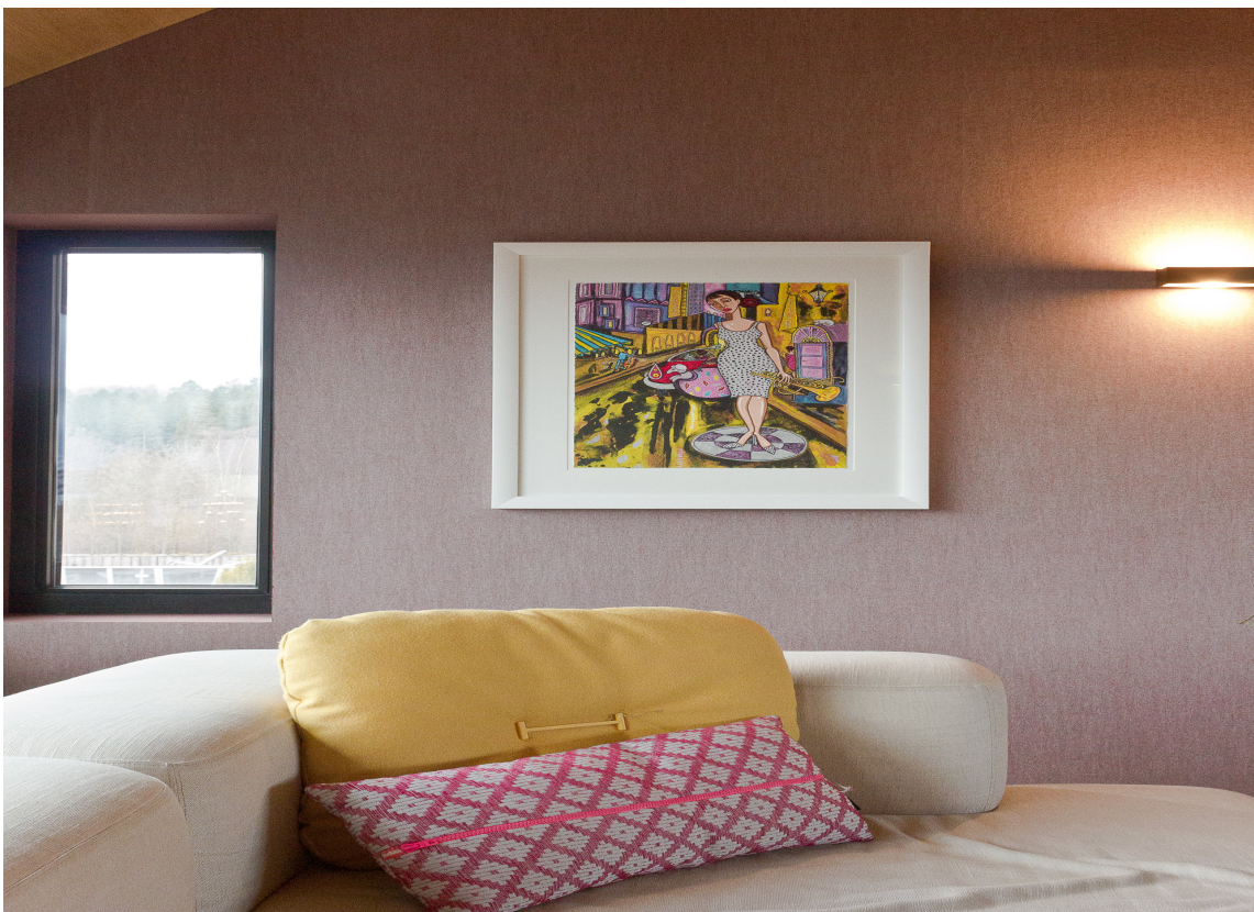
ALLROM: I en liten stue i soveromsetasjen fungerer som oppholdsrom.

I andre etasje er det tre soverom, allrom, bad med badstue og walk-in-closet til hovedsoverommet. Tredje etasje rommer et atelier til mor og et gjesterom. Mellom disse rommene er en gang der den ene vegg benyttes til oppbevaring og det langs den andre vegg er spesialbygd et langt arbeidsbord med plass til flere på rekke og rad. Arbeidsplassen benyttes både til hjemmekontor for de voksne, og til lekser og spill for barna.