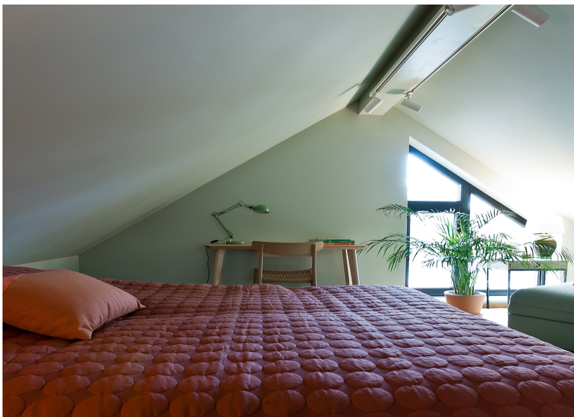
GJESTEROM: I loftsetasjen er det innredet et gjesterom med både lenestol som kan slås ut til ekstraseng.