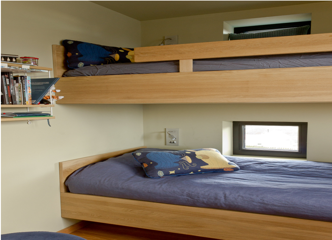
PLASSBYGD: Barnas soverom har køyeseng som er spesialbygd i eik.