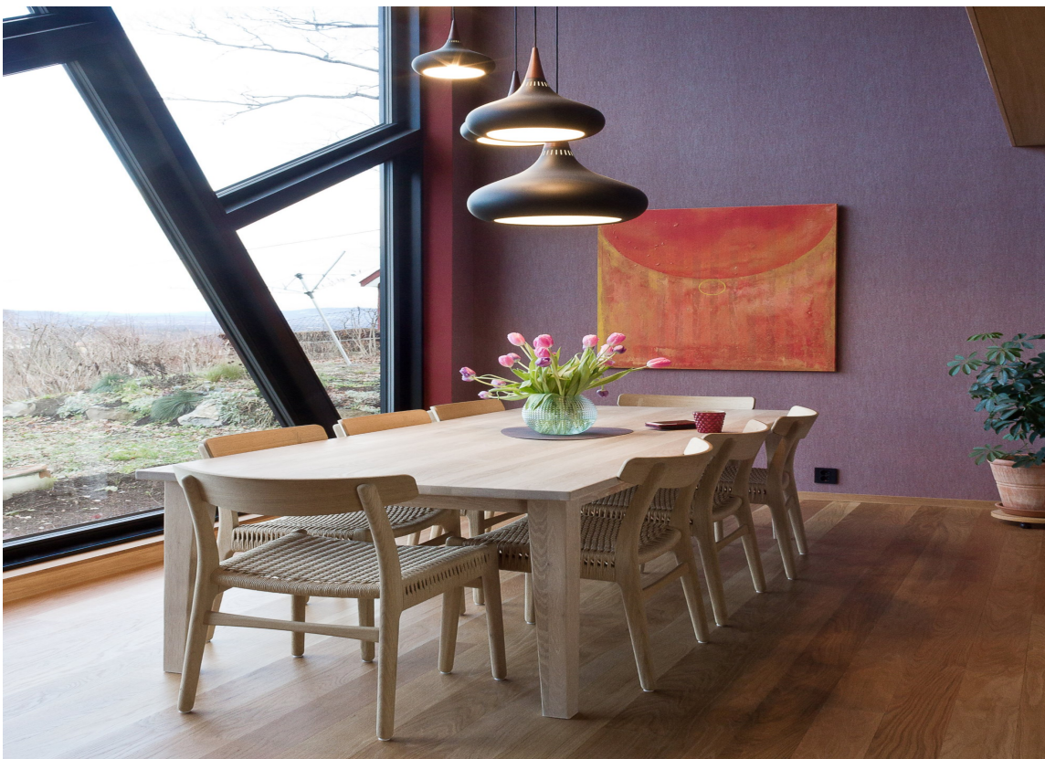
HJERTEROM: Spisebordet ved det åpne kjøkkenet er husets hjerte. Her har tobarnsfamilien god plass til alle aktiviteter som foregår rundt middagsbordet.