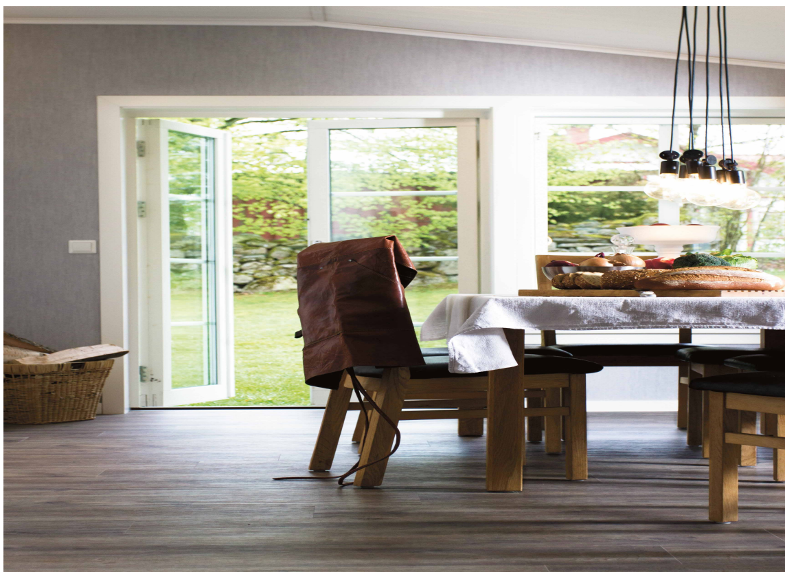
GRUNNSTEIN: Gulvet er selve grunnsteinen i hjemmet.