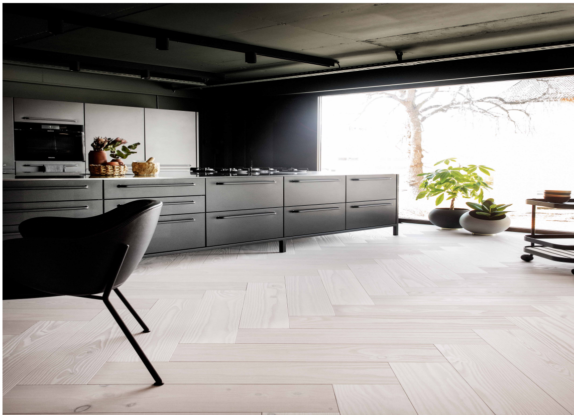
KUNST: Et flott gulv er som et kunstverk. Velg gulvet først og med hjertet.

– Se på gulvet som det viktigste møbelet i rommet. Alt annet kommer etter. Legg heller pengene i et flott gulv enn i en dyr sofa. Den dyre sofaen vil aldri se fin ut på et simpelt gulv. Det handler også om mer enn bare estetikk. Et gulv skal kjønes godt. Mitt råd er derfor å velge kvalitet med en gang. Du vil bli fornøyd om du investerer i kvalitet og velger gulv med hjertet, avslutter han.