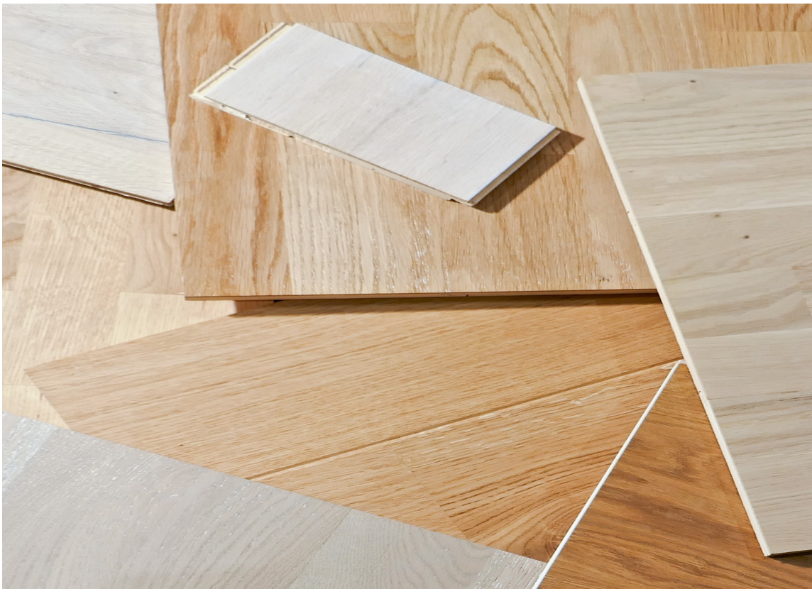
IKKE NØYTRALT: Husk at ingen gulv er nøytrale, selv ikke tregulv, som vi ofte tenker er tidløse, nøytrale og går til alt.