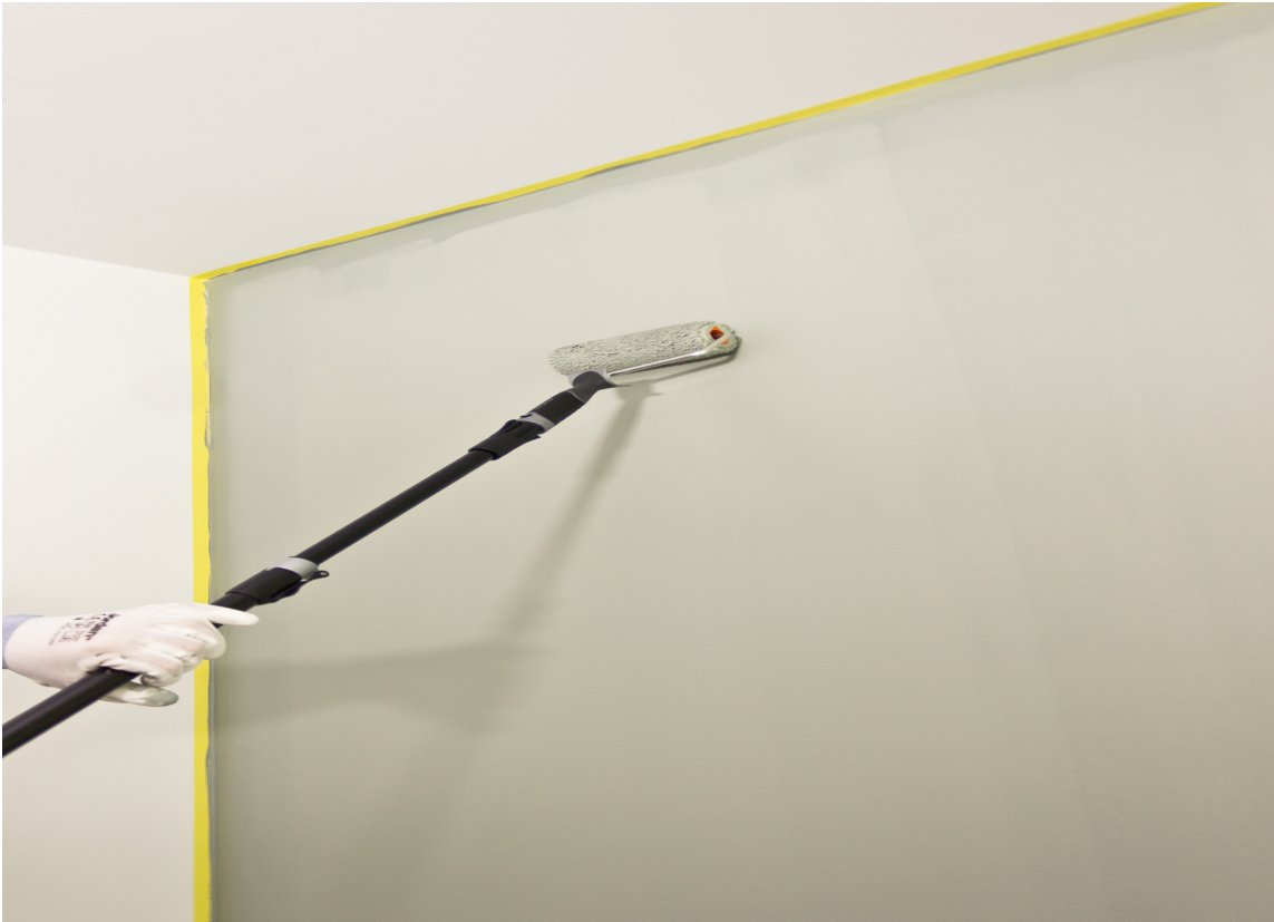
ORIENTERT: Ved å orientere strukturen i én og samme retning, får du et jevnt og fint resultat.