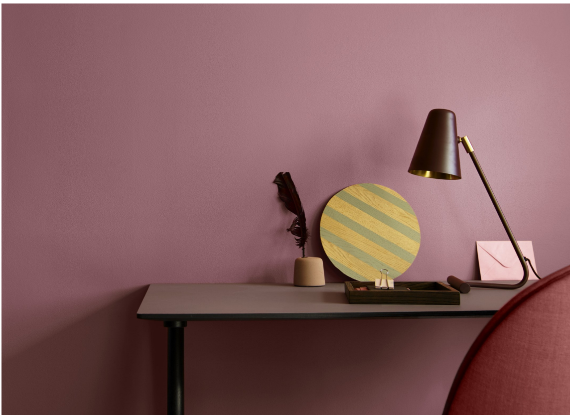
JEVNT OG MATT: Særlig når du maler med matt maling og mørkere farger, er det lurt å orientere strukturen.