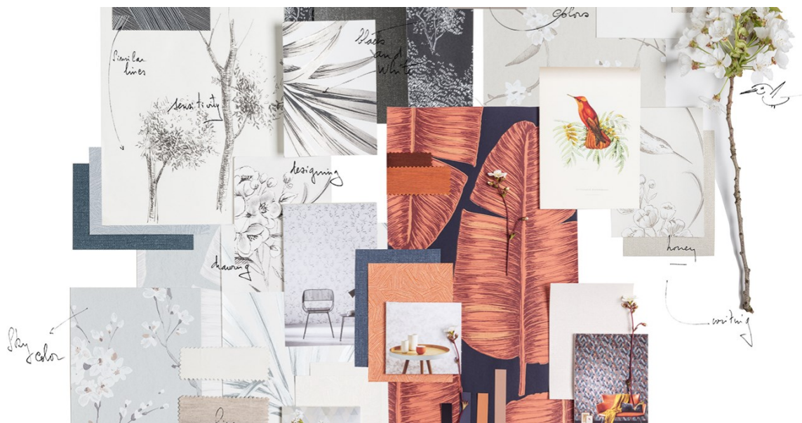
TAPET: Med tapet kan du spille på mønster, farger og tekstur og skape stemningen du ønsker. I en tapetbok kan du finne alt du trenger til et helt hus. Prøvene her er fra kolleksjonen Kwai fra Borge.

For å illustrere poenget tar hun fram tre ulike tapet.