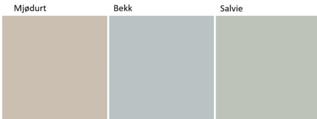
FLERFARGET: Dersom du ønsker forskjellige veggfarger i stue, kjøkken og soverom, så har du en trio her som klinger fint sammen.

LES OGSÅ: Tre gode farger for deg som liker lyse vegger