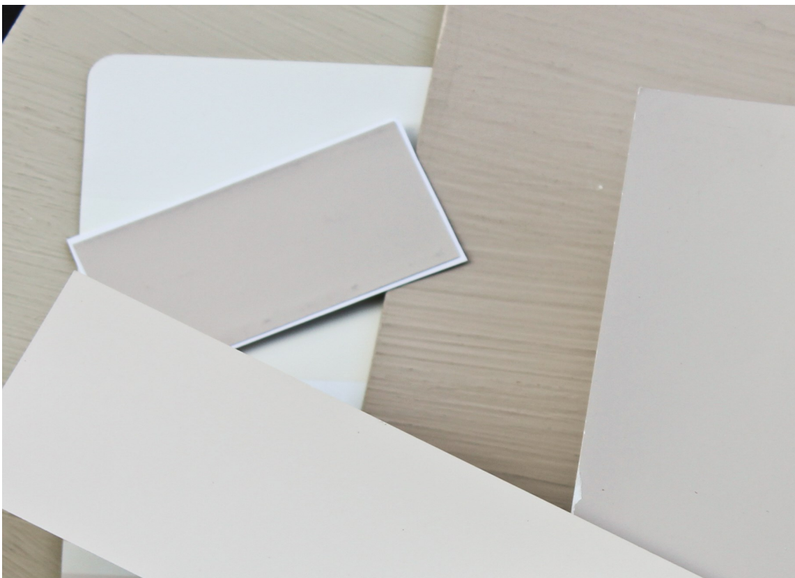
VARME VEGGER: Lyse, lune farger med en varm undertone er populære veggfarger. En av favorittene er Mjødurt.