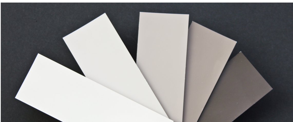
TON I TON: Mjødurt kan kombineres med lysere og mørkere nyanser på veggene i tilstøtende rom.