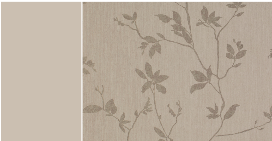
ROLIG: Tapetet Aristo er rolig selv om det er mønstret, og passer fint til alle fire veggene i rommet. Tapet fra Storeys.