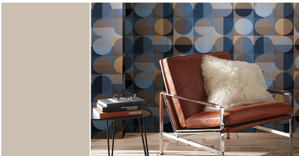
RETRO: Tapetet Allegro vil kle godt en mørkere ton-i-ton nyanse av Mjødurt til vindu og dør. Tapet er fra Borge.