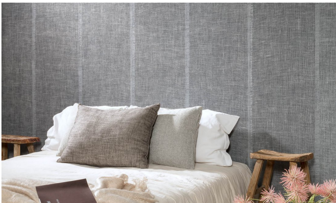
TEKSTUR: Tekstiler og vegger med tapet myker opp og gjør rommet innbydende. Tapet og tekstiler fra Arte/Green Apple.