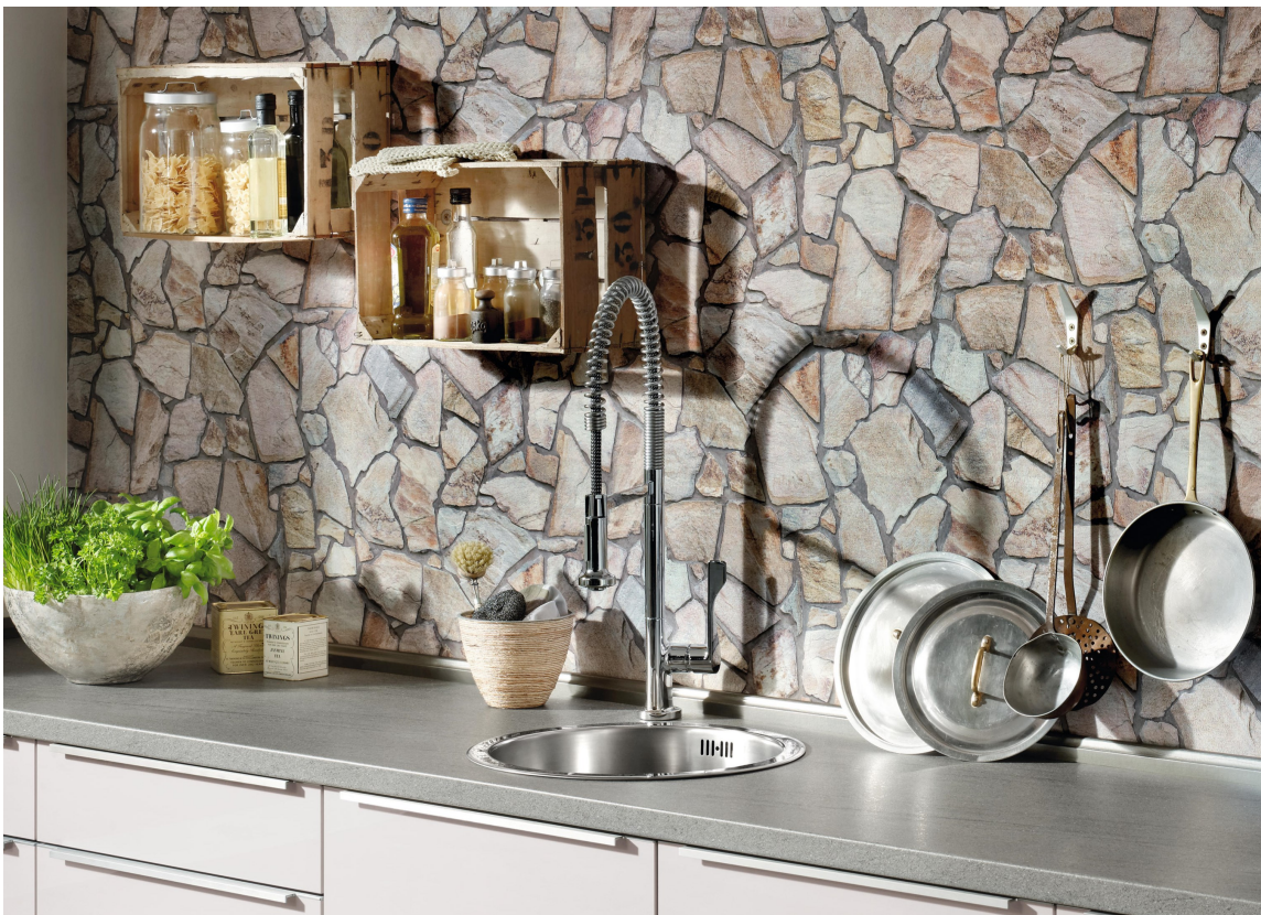
STILFØRENDE: Tapet er et supert material for å skape og forsterke atmosfære og stil. Dette tapetet fra kolleksjonen Wood'n Stone fra Storeys, tar fint opp fargene og trekker oss mot det maskuline.