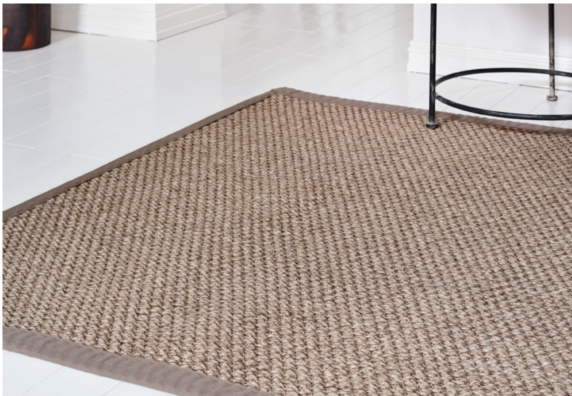
TEPPE: Akustikken er plagsom i mange moderne hus og leiligheter. Det harde lydbildet dempes effektivt med tepper på gulvet. Til denne paletten passer det fint med naturmaterialer som ull og sisal. Teppet er fra InHouse.