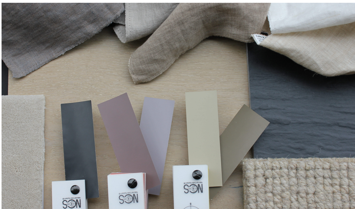
MATERIALMIKS: Sjekk hvordan farger og materialer klinger sammen før du tar den endelige avgjørelsen. Det er på dette stadiet du gjør justeringene.