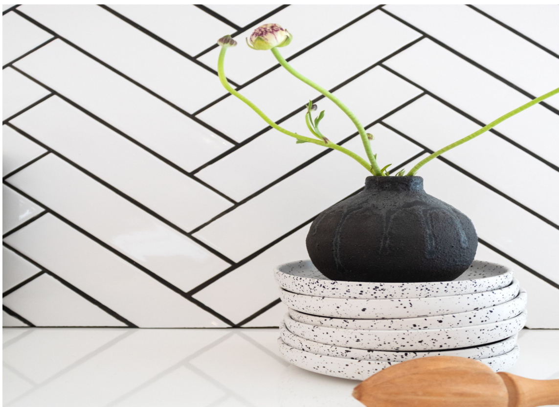
MODERNE: Fremhev form og mønsterlegging med markerte fuger.