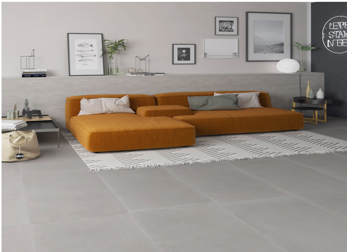
INDUSTRISTIL: Gi stuen et industrielt preg med betonglignende fliser.

Vegger og gulv som ser ut som om de var av støpt betong fås også med keramisk flis. Kanskje har de til og med med «merker» etter forskalingen i overflaten. Eller hvorfor ikke et diskret, utvasket, mønster på toppen? Moderne produksjonsteknologi har åpnet en verden av muligheter til å tolke grafiske mønstre og teknikker fra tekstil- og tapetsektoren til fliser. Betongfliser kommer i mange størrelser, og med både varme og kalde gråfarger.