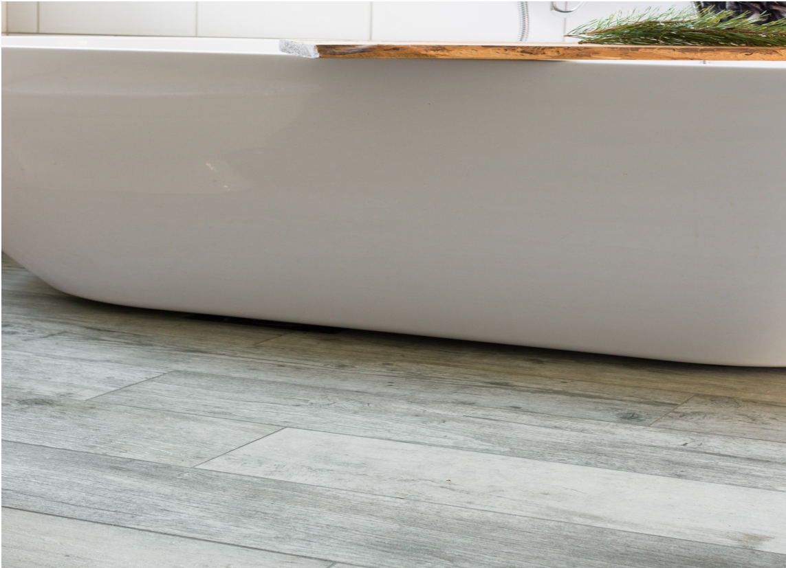
FUKTBESTANDIG: Med keramiske fliser kan du få et problemfritt «tregulv» også på badet.