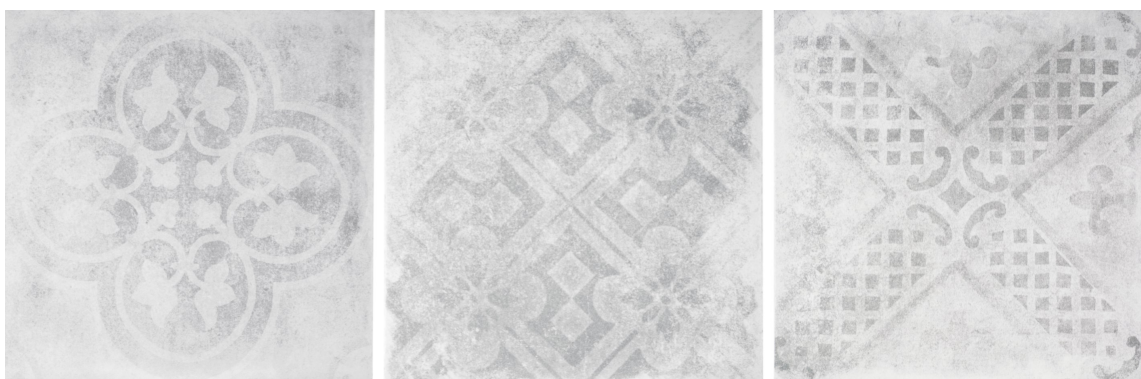
BETONG: Fliser med betonglook kommer enten som ensfargede eller mønstrete.