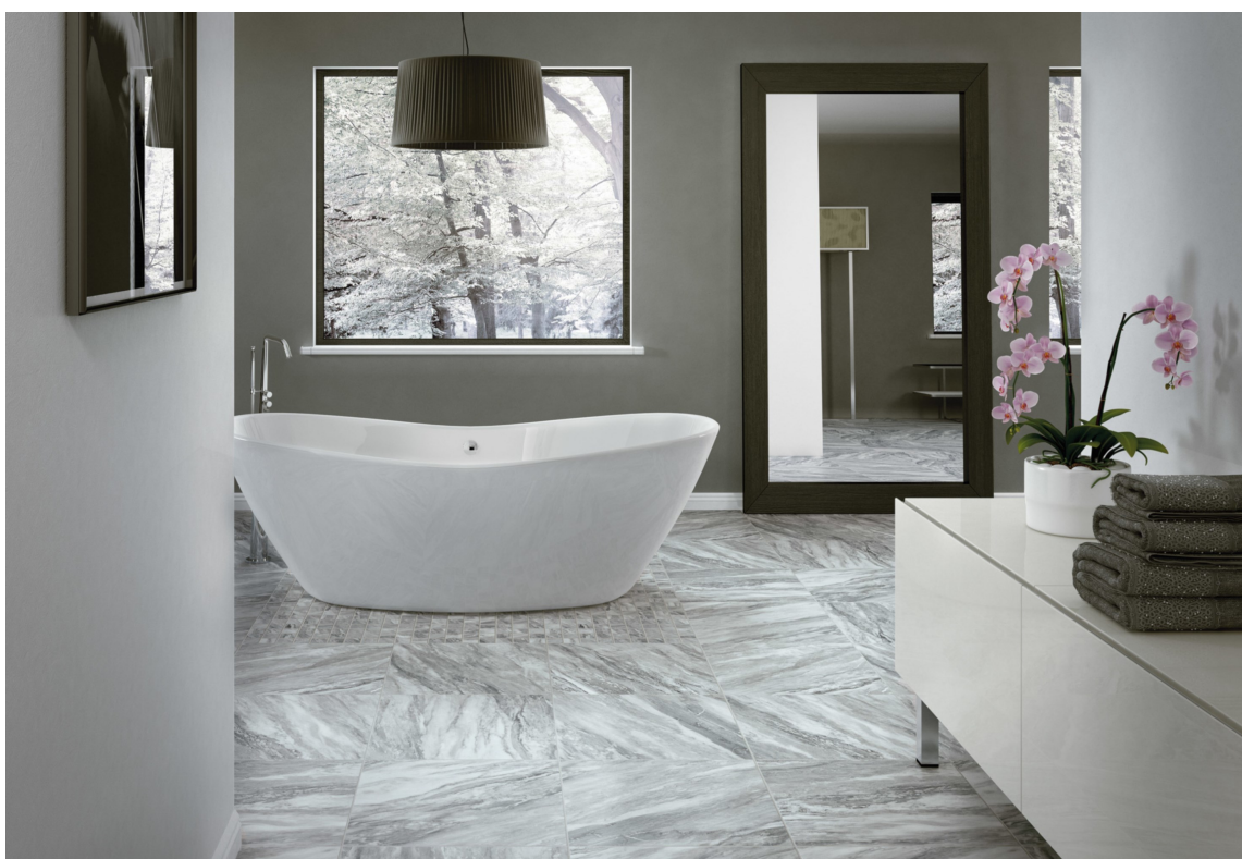
MARMOR: Marmor er et tildøst materiale som oser av eksklusivitet. Med keramiske marmorfliser får du et lettstelt gulv.