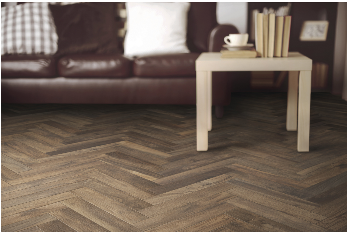
PARKETT: Treimitasjoner i keramisk flis kan se så ekte ut at du nesten må kjenne på det for å innse at det ikke er et tregulv, men noe annet og mer slitesterkt.