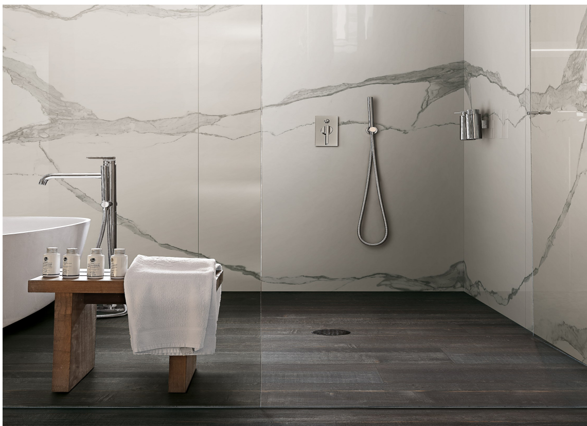
LUKSUS: Fliser med marmorlook ser meget eksklusivt ut. Spesielt vis de er i stort format. Disse er 1,2 meter x 2,4 meter store.