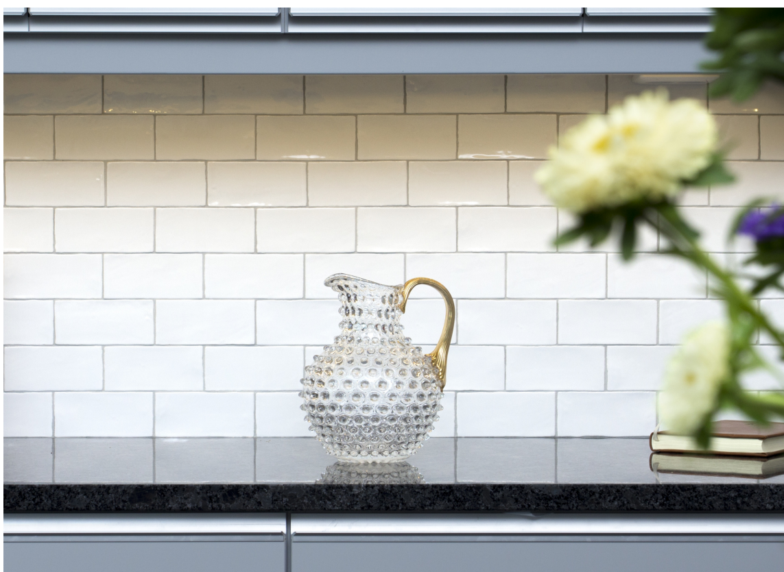
KLASSISK: Til det landlige kjøkkenet passer klassiske fliser perfekt. Dette er en trend som ikke går av moten.