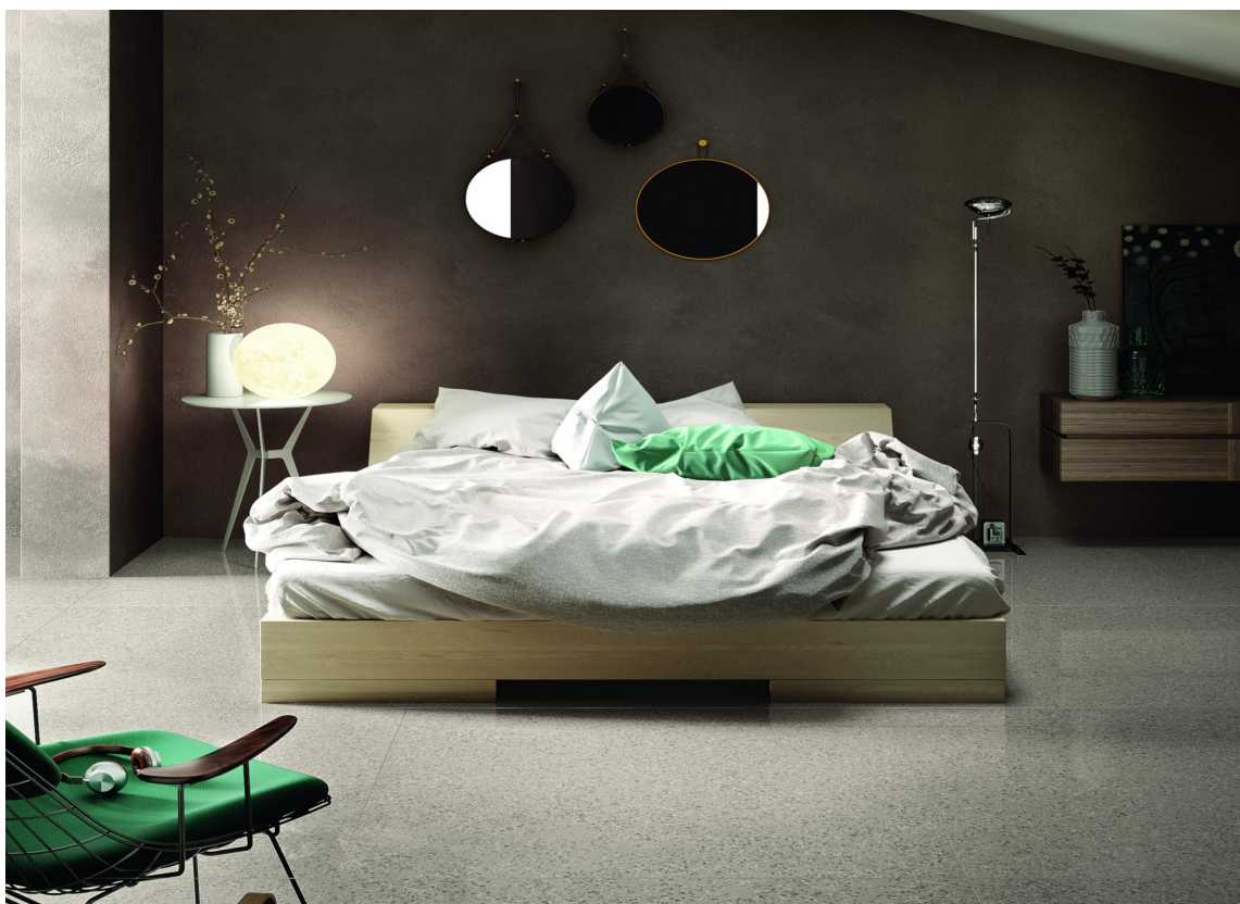
TÅLER ALT: Terrazzofliser tåler det meste og gir en trendy look hjemme.