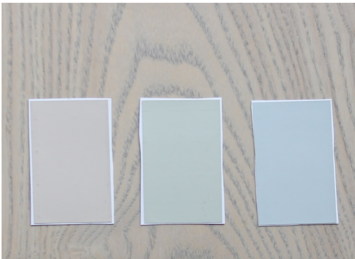
GULV: Husk å sammenlign veggfargene med gulvet. Selv et lyst tregulv har mye farge som påvirker de lyse fargene på veggen.