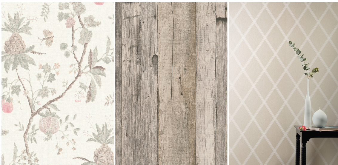
TAPET: Basisfargene er like, men med ulike mønster skapes forskjellig stil og stemning. Tapetet til venstre er Hidden Garden fra Storeys, midten er også fra Storeys og til høyre er Colourful Living fra Borge.