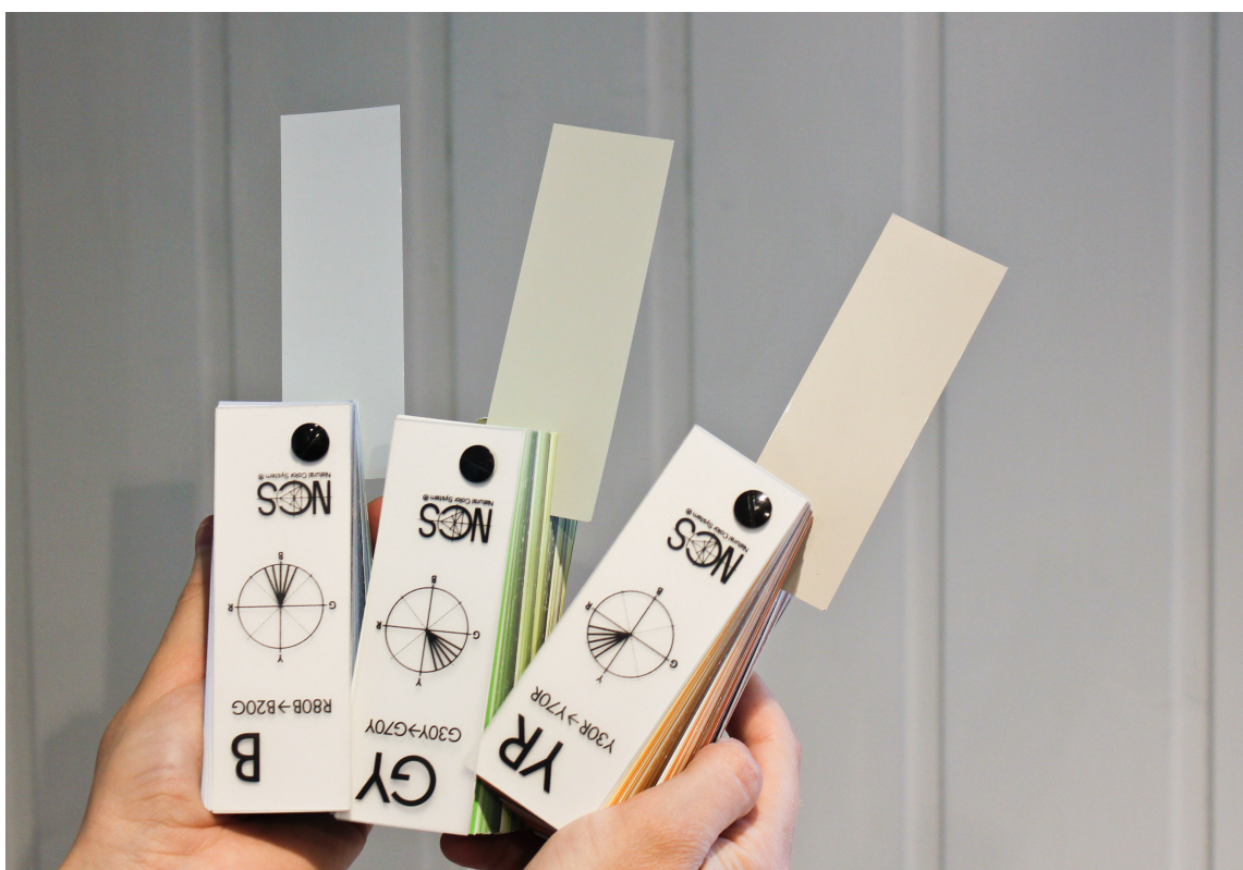
ROM ETTER ROM: Hvis du ønsker lyse vegger og vil ha ulik veggfarge i hvert rom, har du en sikker palett her. Fargene er Bekk, Salvie og Mjørdurt.