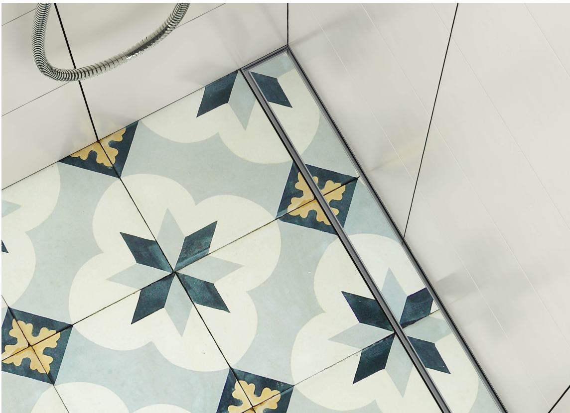
USYNLIG: Det finnes utallige designmuligheter med designsluk. Du kan blant annet få et sluk som ser nesten usynlig ut, som dette fra Purus/Rørkjøp, som heter Purus Line Tile Insert Marrakech.