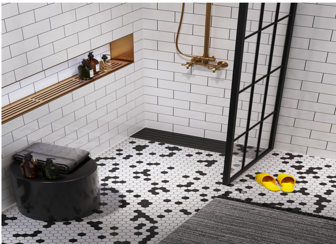
URBANT: – Den urbane kolleksjonen fra Vieser gir deg muligheten til å bygge badet rundt sluket, sier Ekornåsvåg hos Ecodrain. Her ser du Vieser Line Black fra Ecodrain/Rørkjøp.