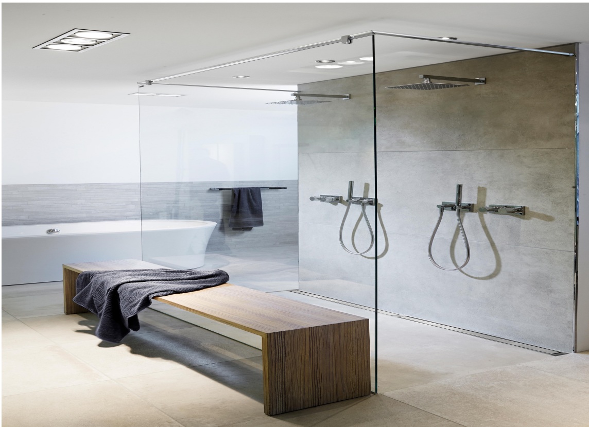
STORE FLISER: Det er trendy med store fliser på badet, og det er enklere å få til i dusjsonen med et designsluk som ligger inntil vegg. Her er HighLine Panel linjeavløp fra Unidrain/Rørkjøp brukt i dobbeldusj.