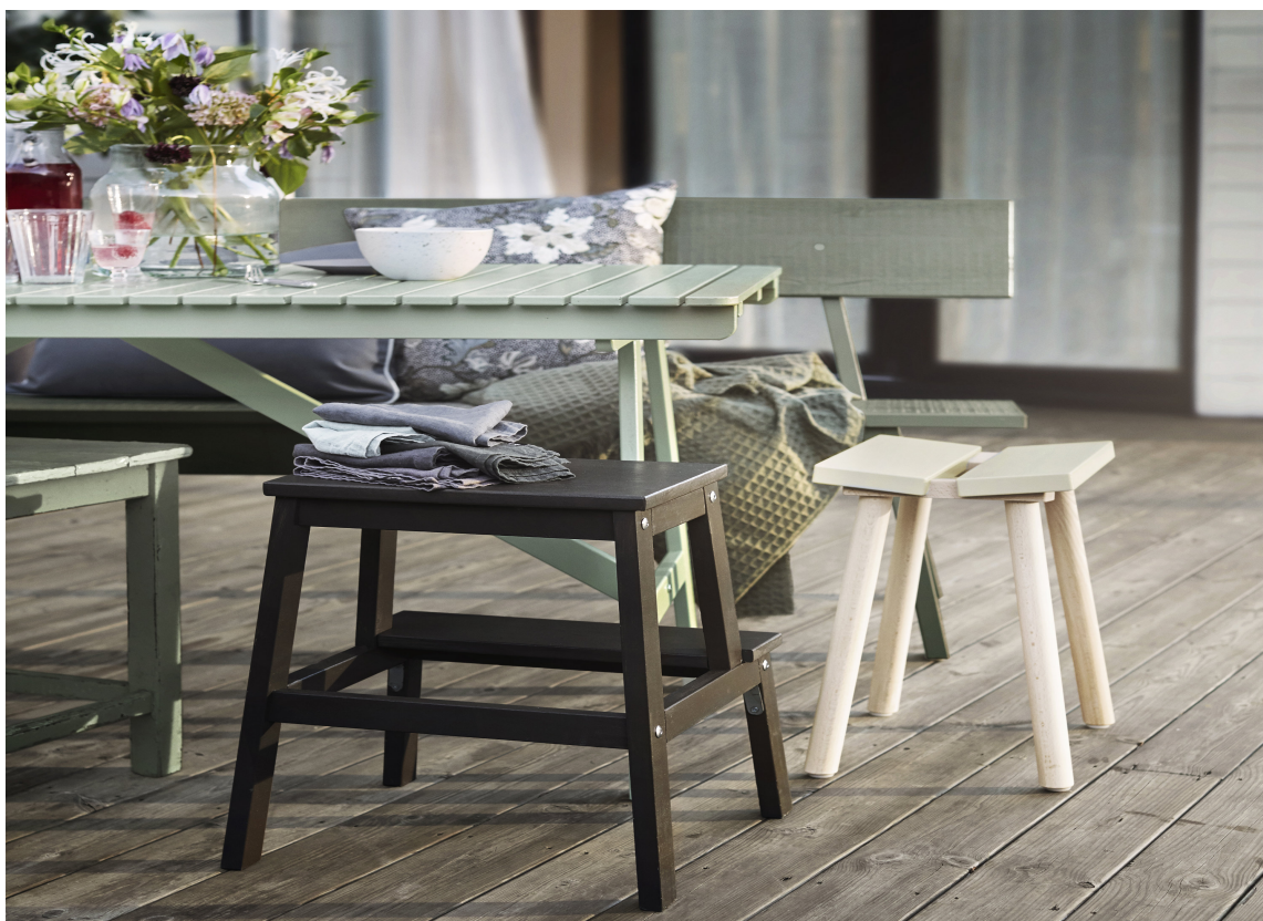
NATURLIG: Olje gir en fin overflate som legger vekt på treets naturlige aldring og karakter.