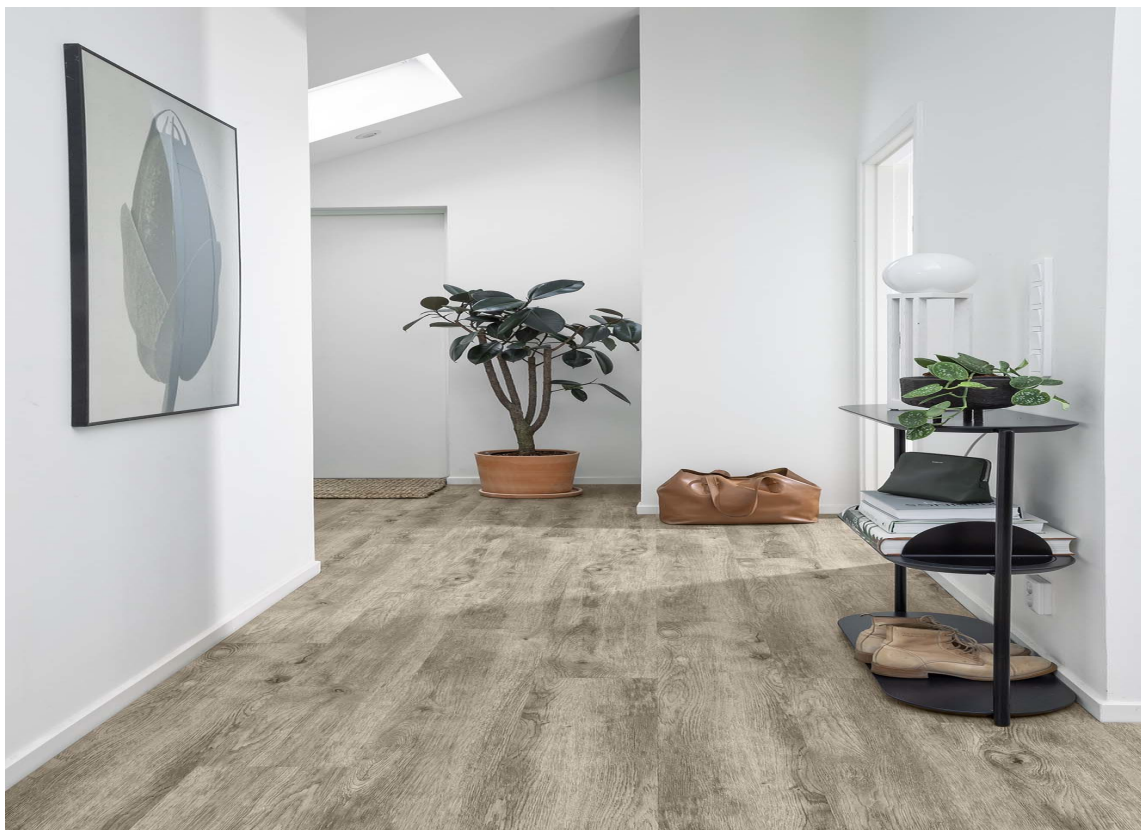
ROBUSTE ROM: Med klikkvinyll i entreen er du sikret et gulv som tåler alt fra fukt og smuss, til et aktivt familieliv. Her er det lagt Starfloor Click Ultimate fra Tarkett.