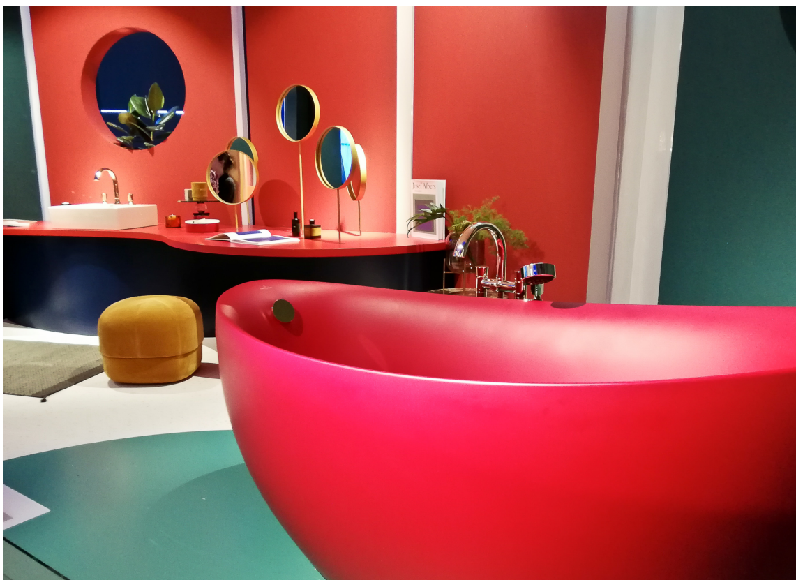
RETROFARGER: Rause farger og runde former preger badene. I avdelingen «The Bathroom Experience» tøyde Villeroy & Boch strikken med spreke utstillinger i flotte, retroinspirerte farger.