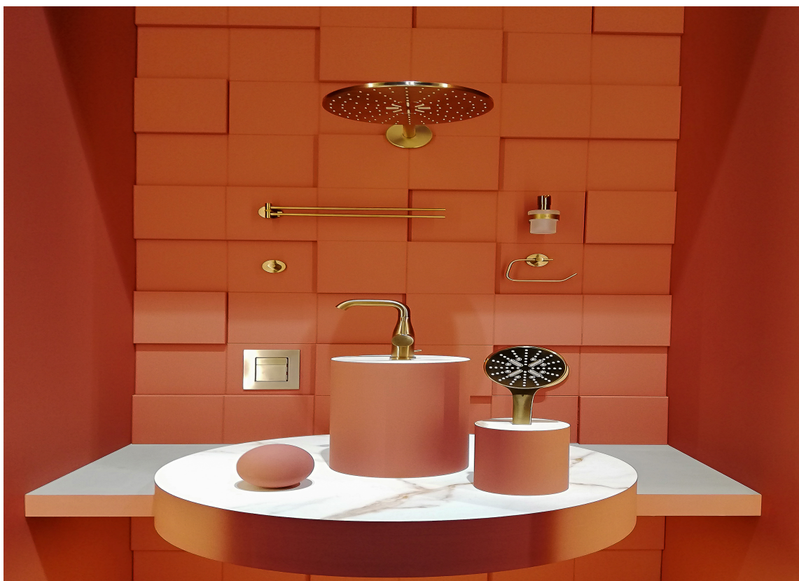
FARGERIKT: Hvitt er ikke lenger det mest trendy. Nå har fargene også kommet til badet. Her produkter fra Grohe, som føres av Rørkjøp.