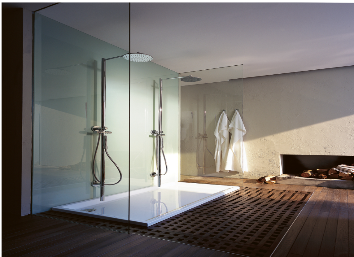
TO OG TO: I denne dobbeldusjen fra Hansgrohe kan dere dusje sammen to og to. Den føres av Rørkjøp.

– ISH viser oss at fargene kommer tilbake til baderommet. Etter en lang hvit periode, med et større innslag av sort, inntar nå fargene badet. Det er alt fra duse pastellfarger og matte overflater, til sterkere farger som minner om 70-tallet, forteller hun.