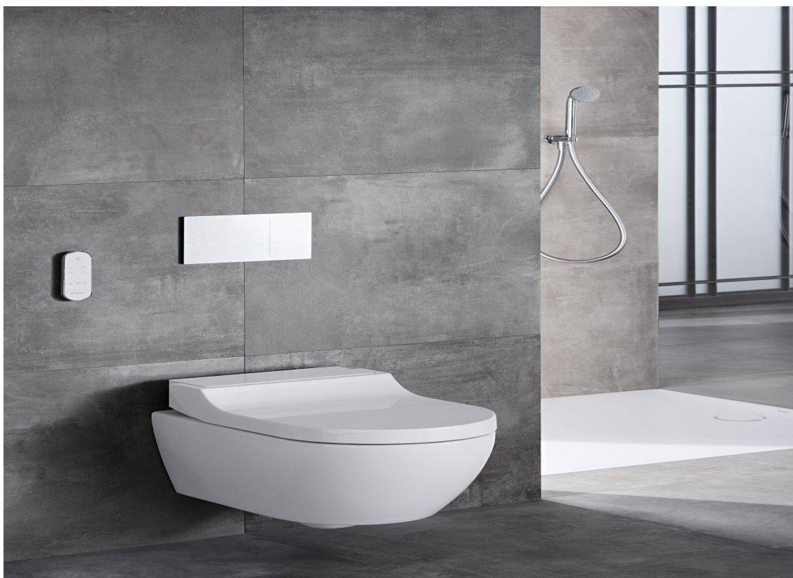
VELVÆREDO: Toppen av hygiene og velvære er en varsom rengjøring med temperert vann og mild fönvind etter toalettbesøket.