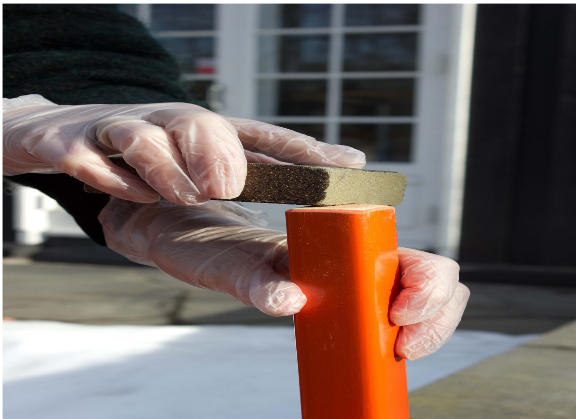
SLIP: Gjør bena klare for olje ved å slipe bort grus og skitt.