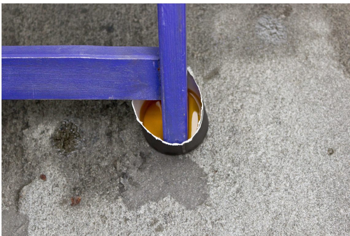
BOLLE: Det skal ikke mer til enn å sette alle stolbena i en liten bolle med olje og la den trekke inn.