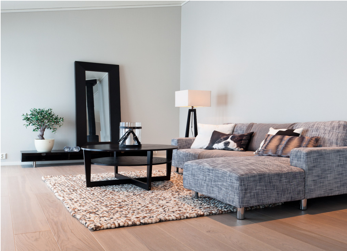
NØYTRALT: Synes du det blir nakent og upersonlig med fargeløse vegger, så sett farge på den.