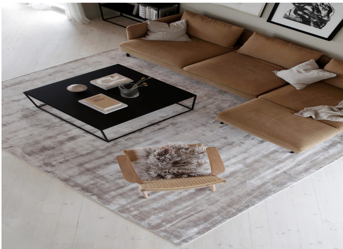
HEL HELHET: Ett stort teppe under alle møblene gir en spesiell helhet i rommet.