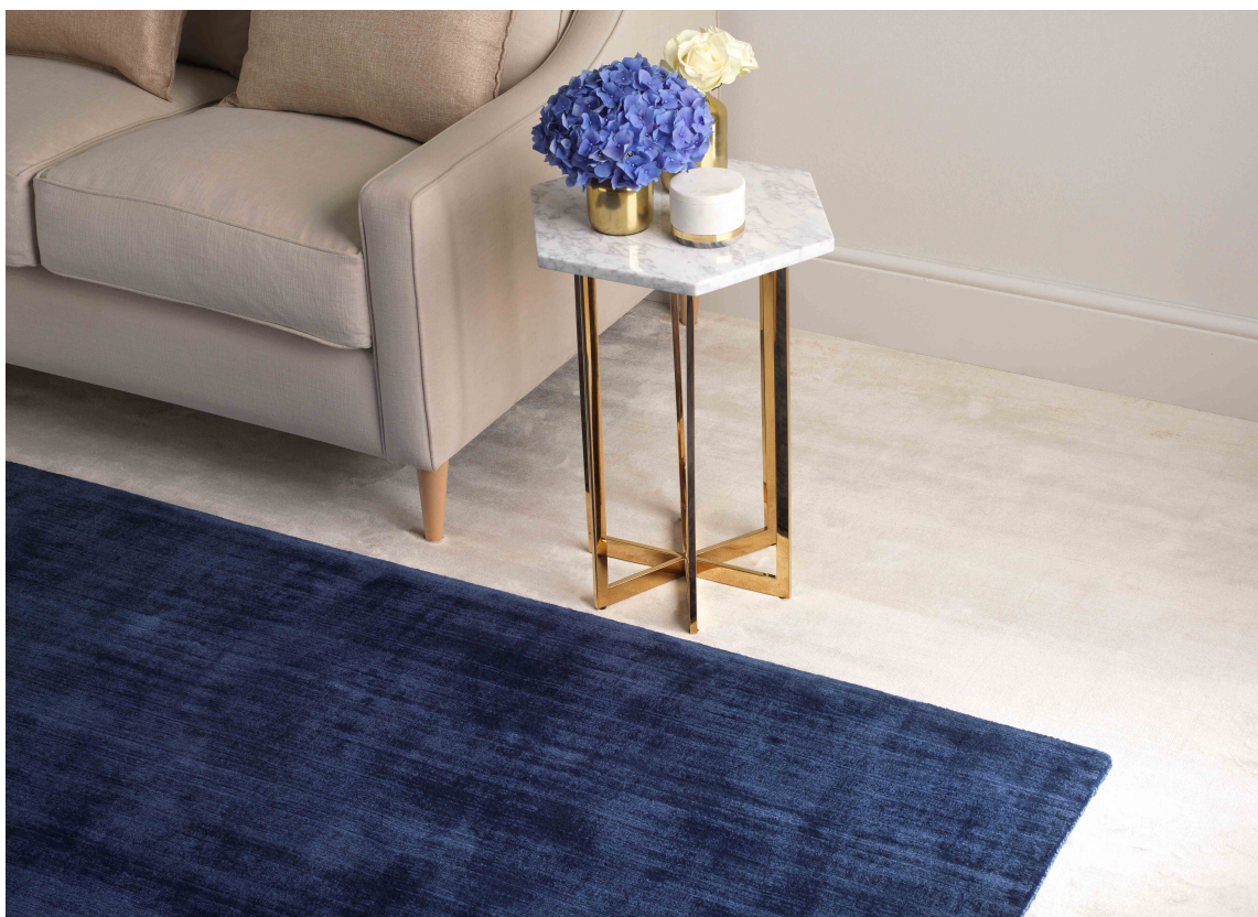
TEPPE: Et av de viktigste tipsene for å forbedre lydbildet i et rom, er å bruke tepper på gulvet. Her ligger teppet Satara Navy Rug oppå Simla Eggshell, begge fra Intag.