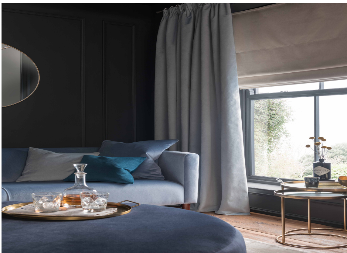
GARDINER: Heldigvis bruker flere og flere gardiner nå. De er gode støydemperer. Tekstiler er Renzo fra Borge.