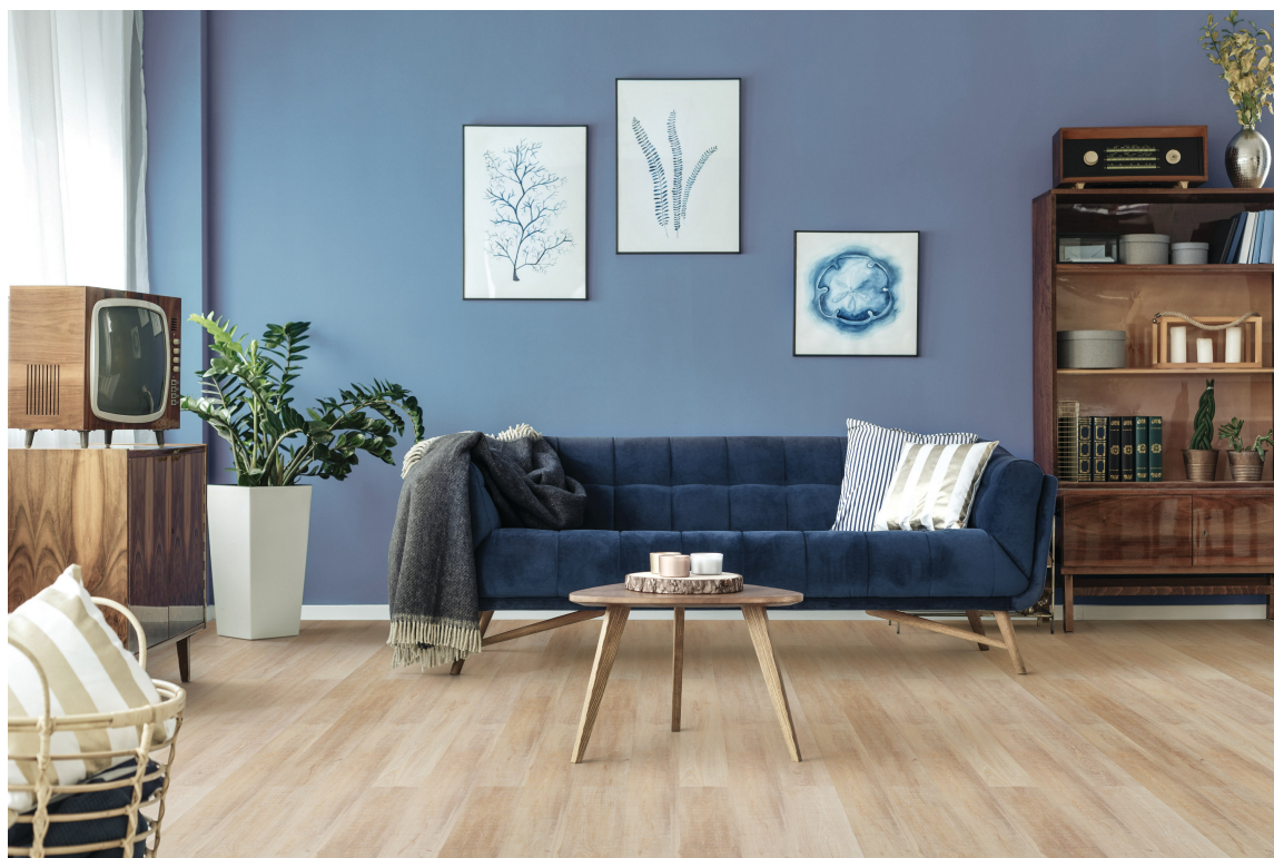
GODE GULV: Korkgulv er blant gulvene som har best lydegenskaper. Her er Hydrocork Sawn Bisque Oak fra Wicanders, som føres av Farveringen i Norge.