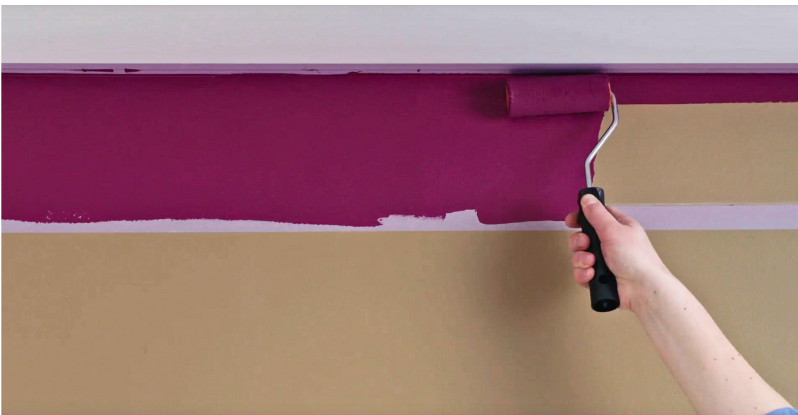
MAL: Mal innenfor det markerte området med fargen du ønsker.