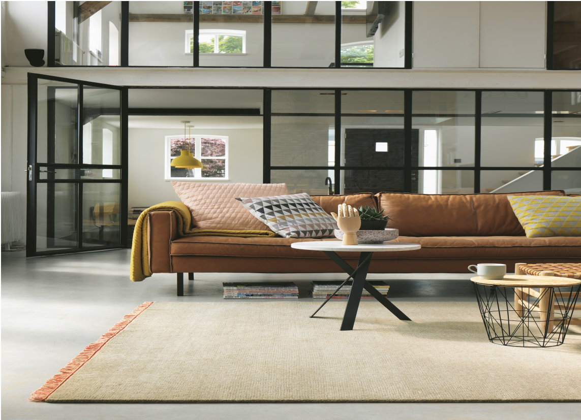
RETT STED: Det gjelder å finne rett teppe til rett sted. Ullteppet Nima er fra Brink&Campman og føres i Norge av Tapethuset.