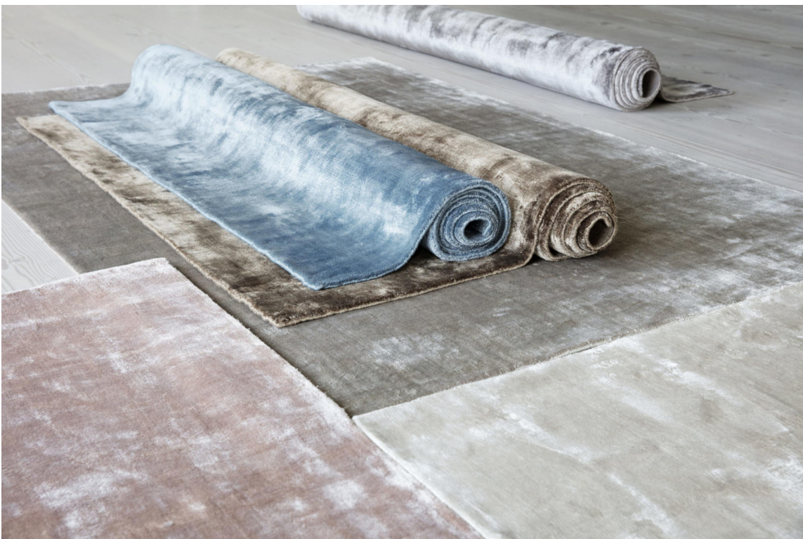
POP: Viskosetepper er populære av en grunn. De er myke, deilige og ser eksklusive ut. Men bruk de riktig plass. Disse teppene er Buga Rugs fra InHouse Group.