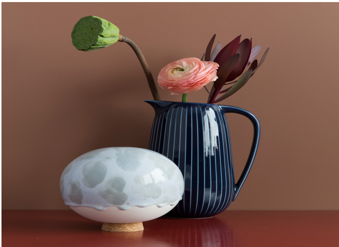
MALING: Butinox satser på flere rødtoner i sitt siste fargekart, gjerne kombinert med blått som kontrast. Veggen er malt med Butinox Stue&Sov Matt, farge 5926 Frappe. Bordet malt med Quick Bengalakk farge 5933 Årgang.