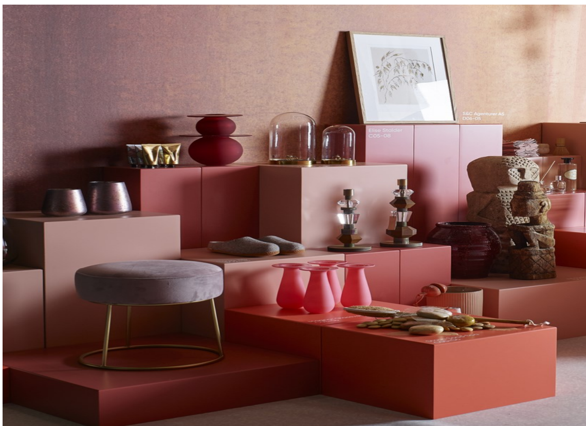
LIVING: I inspirasjonsutstillingen er det mer fokus på rødt, og nyansene varierer fra lys støvet rosa, til dyp burgunder over til oransje.