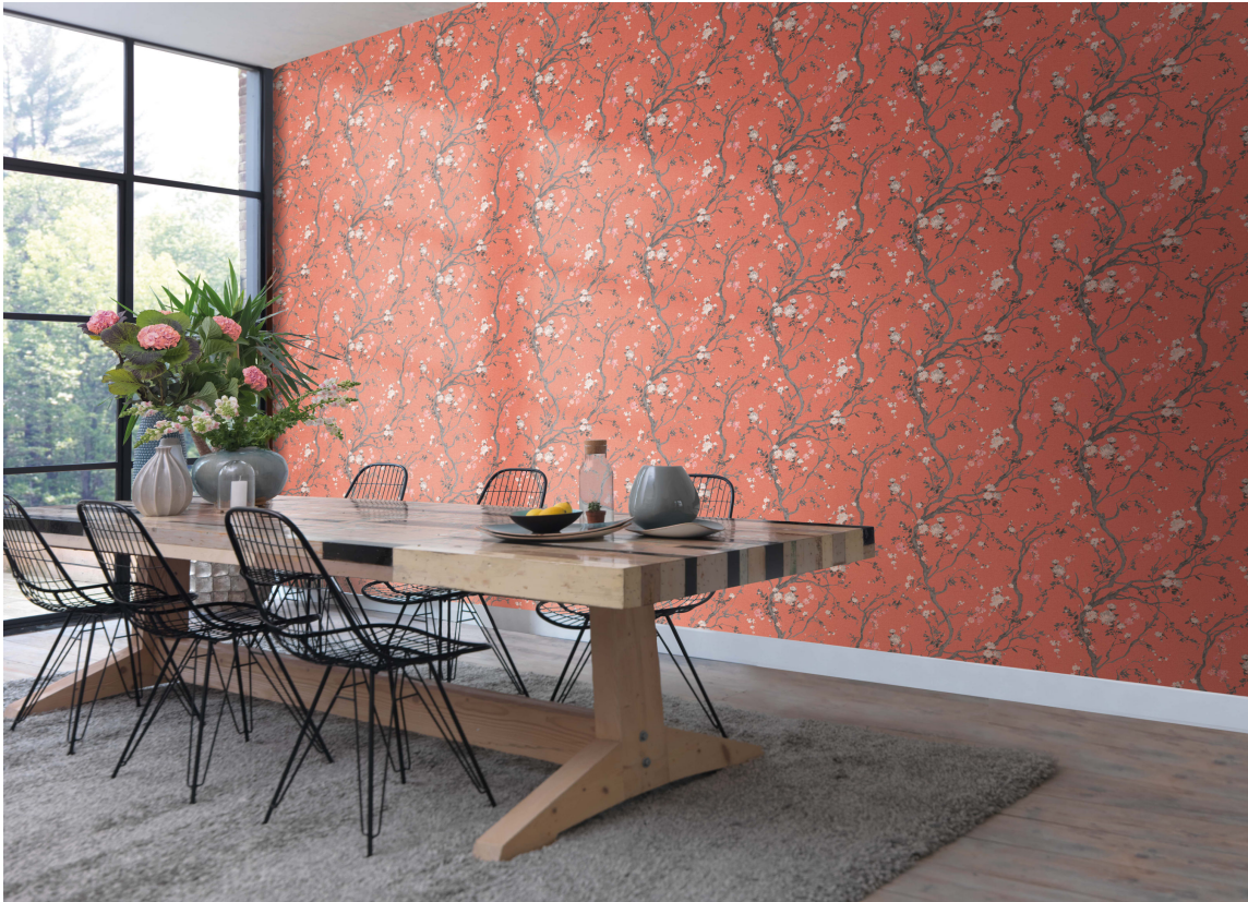
DAWN er et nytt tapetet fra Borge. Selv i gråvær kan en kjenne varme fra soloppgangen med en slik ramme rundt frokosten.