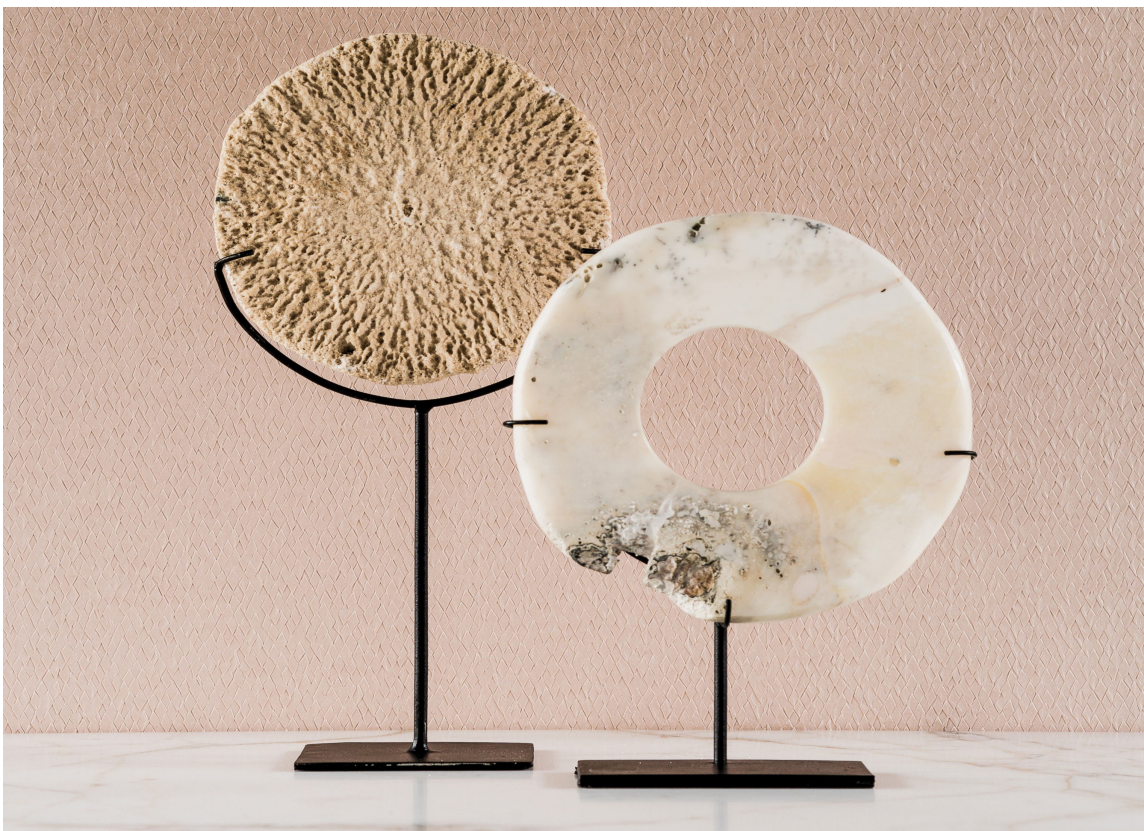
TAKTILT: Rosa en viktig og tidsriktig farge som finnes med i de fleste trendpalettene. Tapetet Nuanses fra Soreys har en overflate som ser flettet ut. Helt i tråd med tidens taktile trend.