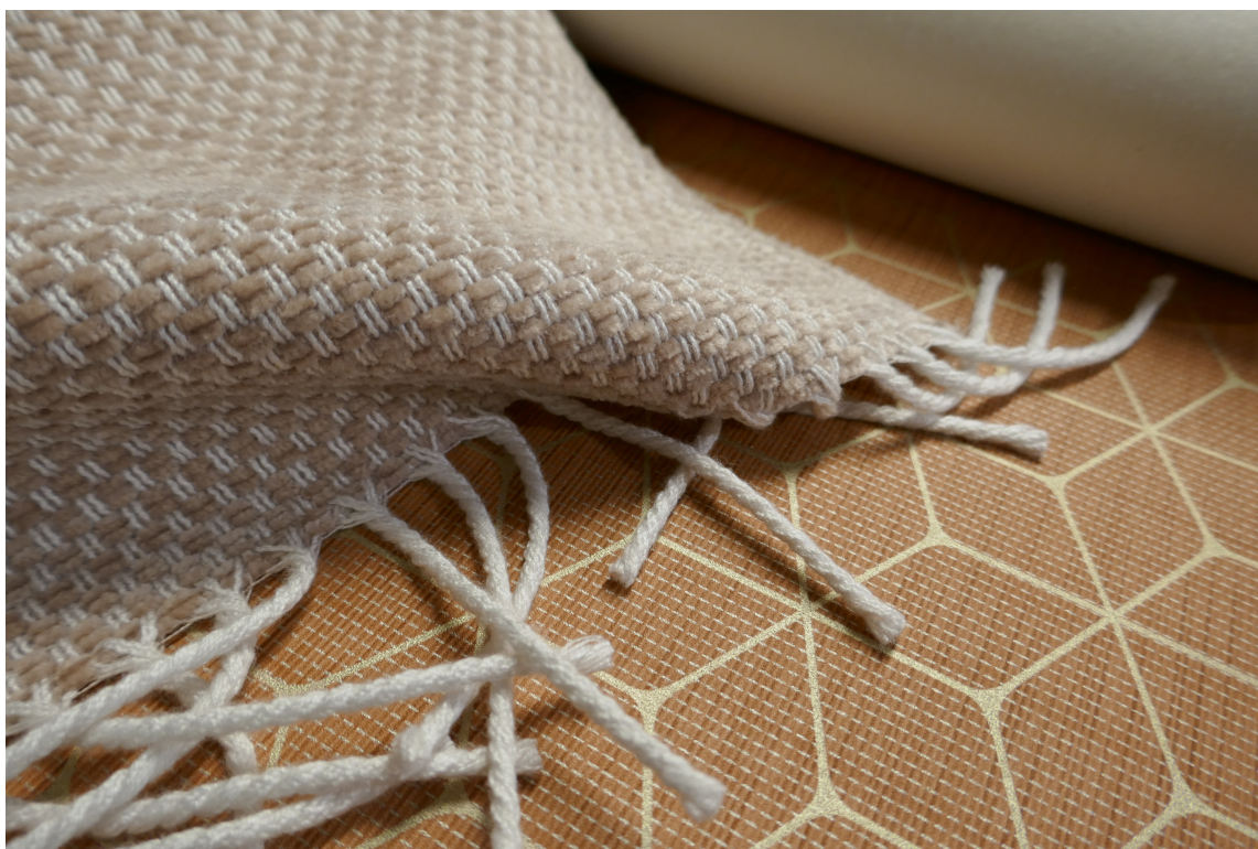
UTENDØRS: Også utendørs ruster vi oss med rosa; pleddet fra italienske Maria Flora er laget for utebruk og motstandig mot fukt. Tapetet er fra Textured Walls fra Harlequin, begge føres av Tapethuset.