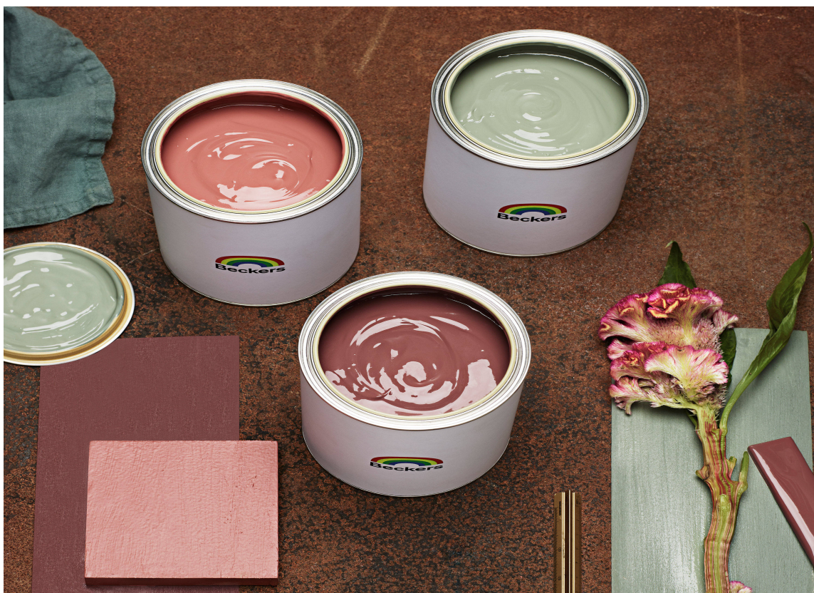
KONTRASTER: Kombinasjonsmulighetene er mange, og hver og en av oss kan finne vår egen favoritt. Beckers kombinerer rødt med grønt. Fargene her er Impulsiv, Passion og Salvia.