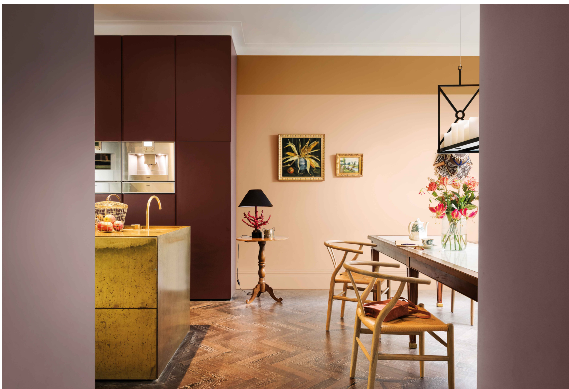
VARMT: Tendensene er at vi kombinerer flere og varmere farger, og tenker kombinasjoner. Farger fra Nordsjø sin palett fra CF18.