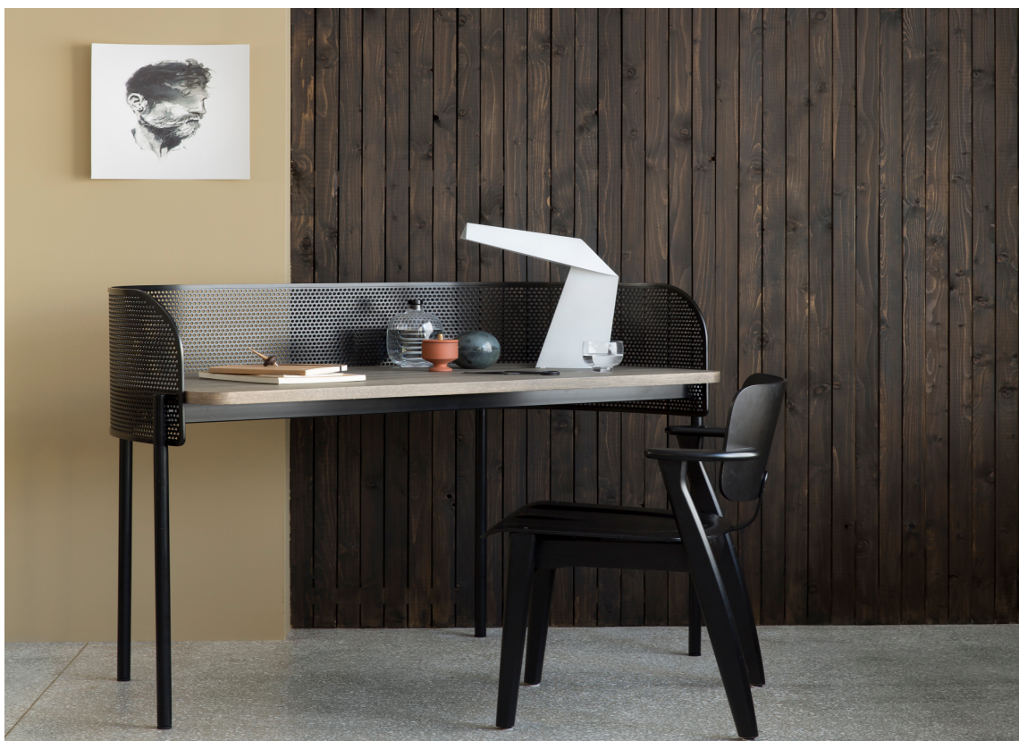
FURU: Tre og synlig tremønster hører til i 2019-interiør. Furupanel er tilbake, men i nye moderne farger og formater. Furupanelet på bildet er beiset med et fyldig strøk Tyrilin interiørbeis.