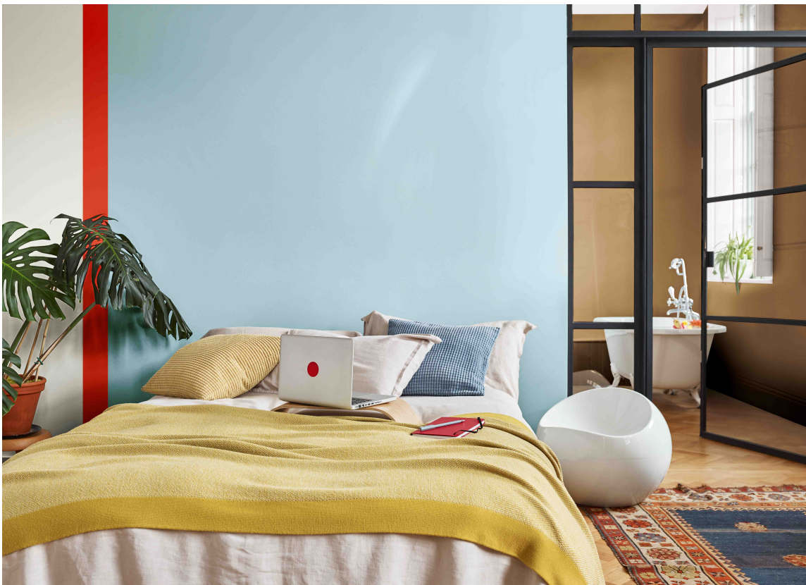
VARIASJON: Palettene blir mer variert og personlige. Vi vil eksperimentere mer med kontraster. Farger fra Nordsjö sin palett "A Space to Act" i CF19.