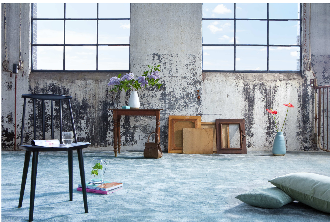
TEPPETREND: Tepper luner og demper akustikk. Vi elsker heldekkende tepper på soverommet, og store salongtepper i stuen. Teppet er fra Intag, Van Besouw.