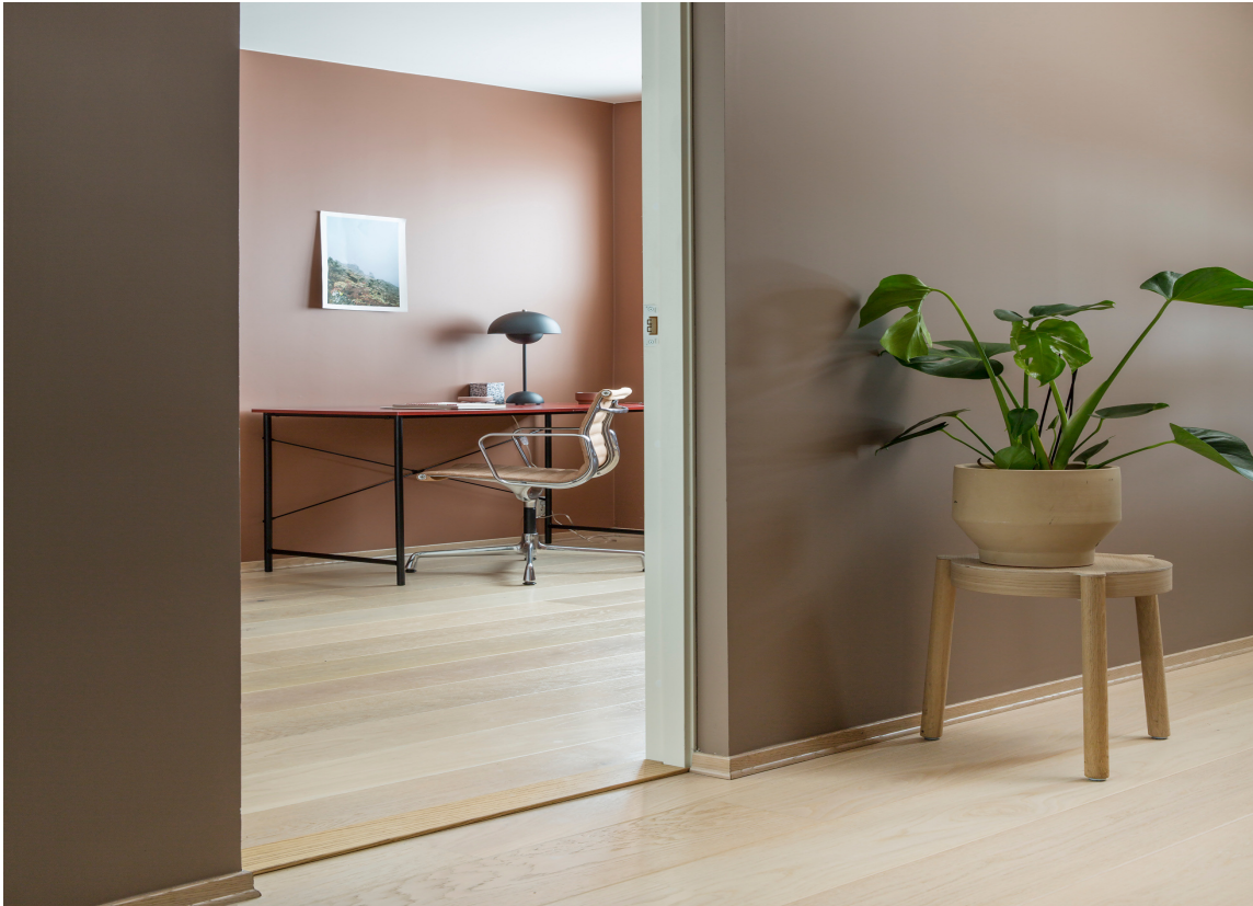
HELHET: Det nye normale er hvert rom sin farge. Nå syns vi samme farge i alle rom blir kjedelig. Veggene er malt med Butinox Stue Sov & Matt. Farger vegg gang 5927 Cortado, kontor 5926 Frappe.