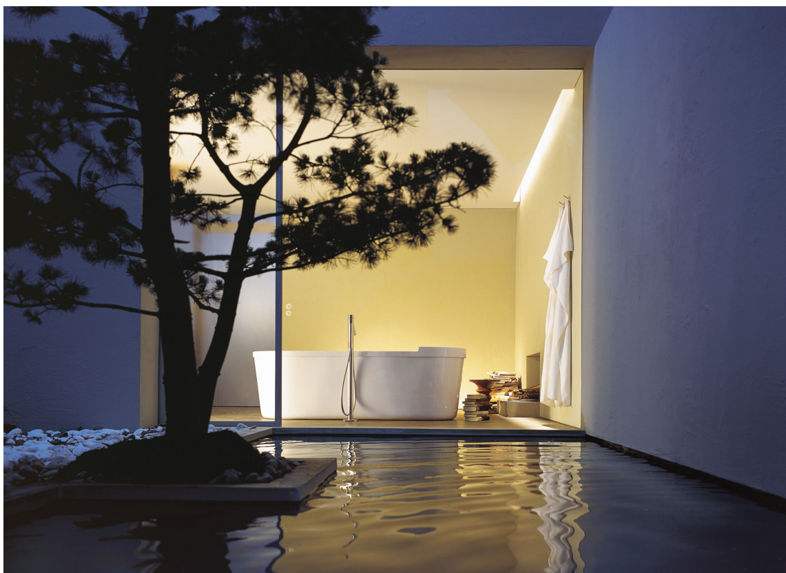
VELVÆRE: Badet skal være en oase av velvære. Badekar fra Axor/Rørkjøp.