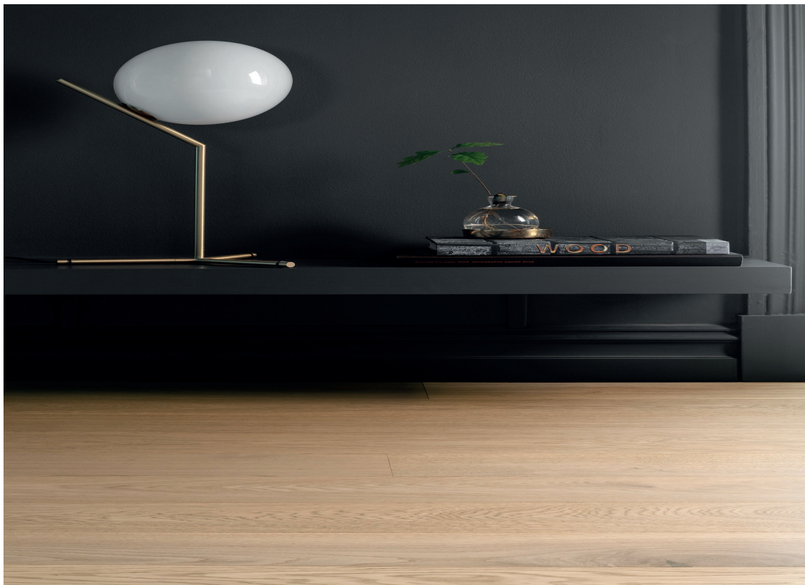
GYLNE GULV: Tregulv eller gulv med trelook er det vi nordmenn liker aller best – også i 2019. Smaken har dreid, og gulv med varmere lød danker ut de kjølige grå- og hvitbeisede. Tarkett Shade Oak Soft Beige Plank.

– De fleste av oss vil fortsatt velge lyse gulv, men de er varmere i løden. Det er vekk med det kalde hvite og grå. Varme bruntoner er også på vei inn igjen. Og som tidligere sagt, vi blir friere til å velge gulv som passer rommet, avslutter Owren.