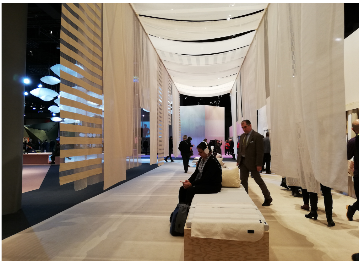
UFORSTYRRET: Tekstilbransjens svar på det moderne menneskets behov for ro og stillhet er lette, transparente tekstiler i ulike vevteknikker og uten farger som påkaller oppmerksomhet.