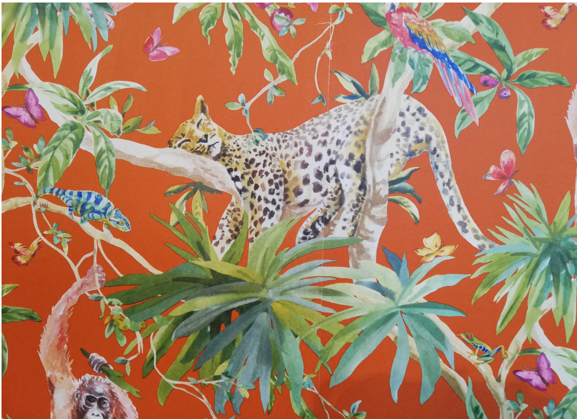
PRIKKETE DYR: Jungelmotivene er like aktuelle, og tas til nye høyder med skumle, prikkete dyr som lurer i buskene.