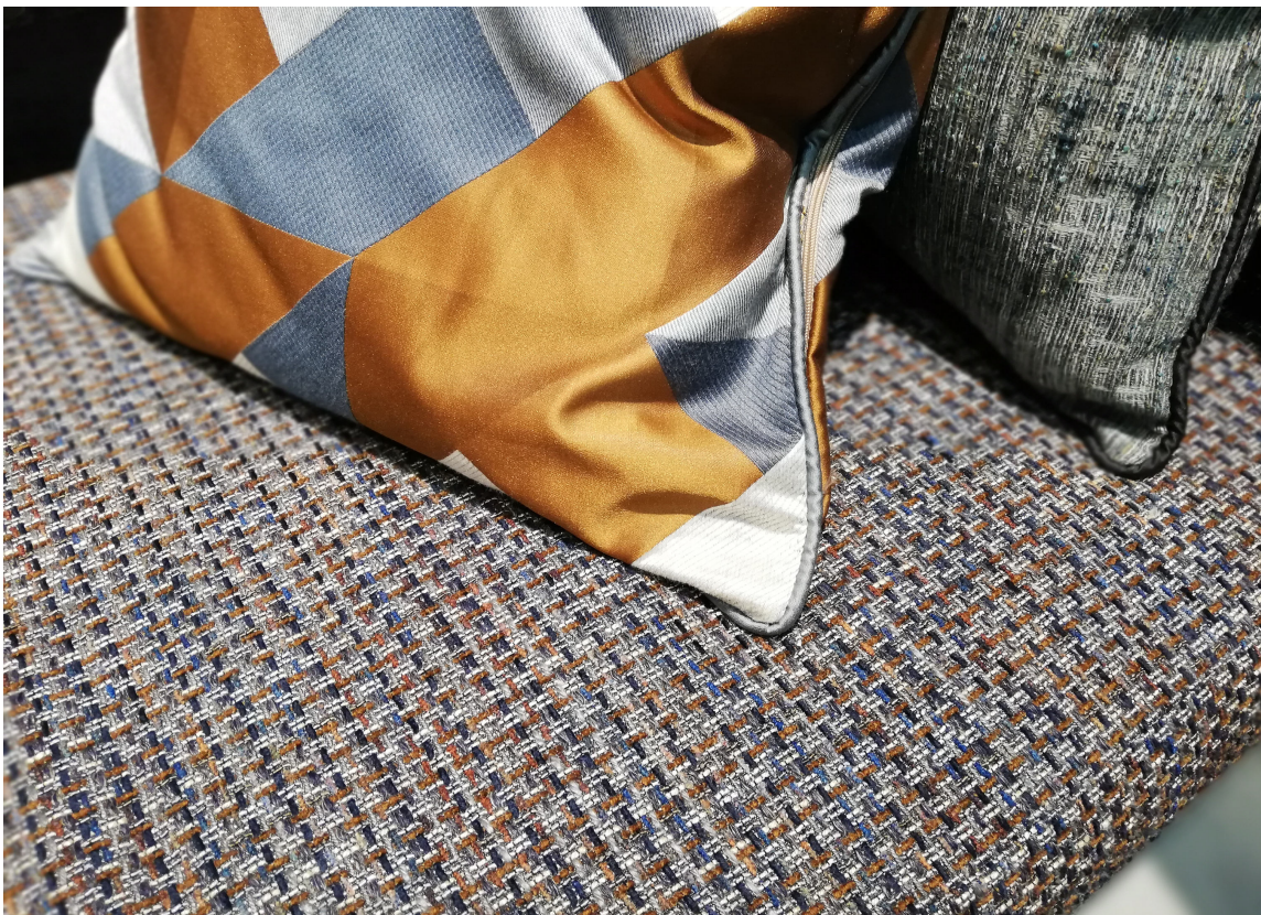
VEVING: Ordene som beskriver ulike strukturer og vevteknikker kom ofte til kort, men se opp for de sofistikerte nyansene. De ligger både i farger og tekstur.