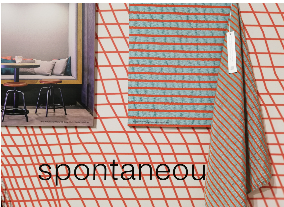
PÅ EKTE: Et bilde kan ikke erstatte et fysisk møte; det er først når vi ser materialet vi får et riktig inntrykk.