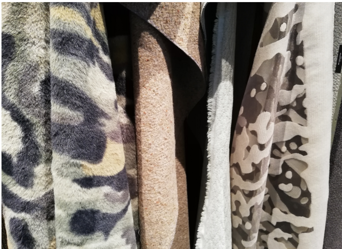
KAMUFLASJE: De som spår om trender snakker mye om det urbane menneskets behov for natur. Men alle har ikke marka rett utenfor døra, da er tekstiler med kamuflasjemønster et alternativ.