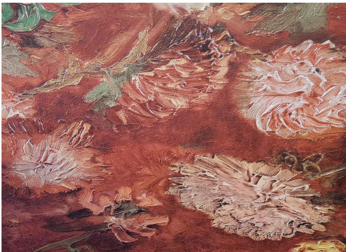
VAN GOGH: Hos BN Walls ble vi tiltrukket av farger og tekstur. Veggene så håndmalt ut, lag på lag med fete penselstrøk. Det var tapet med farger og motiv hentet fra Van Goghs kunst. Kolleksjon utviklet i samarbeid med Van Gogh Museum i Amsterdam.