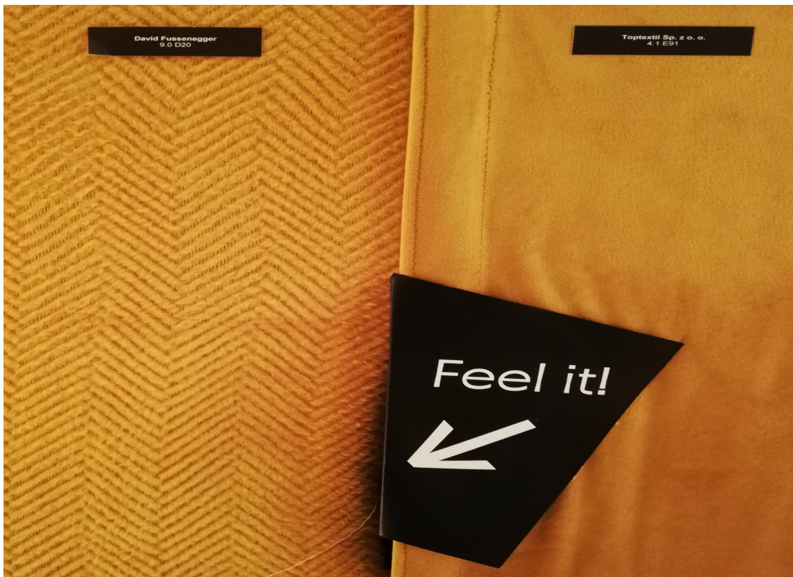
FØLE: I trendutstillingen ble vi med store bokstaver ble vi oppfordret til å la fingrene stryke og ta på de ulike overflatene.