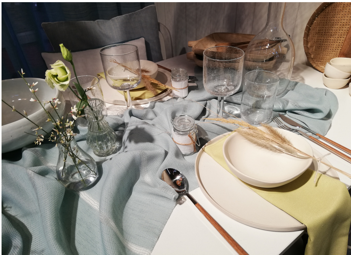
SOMMERLIG: Den skandinaviske stilen vinner stadig nye tilhengere. Et sommerbord var dekket med svale farger, lette, luftige tekstiler og naturmaterialer.