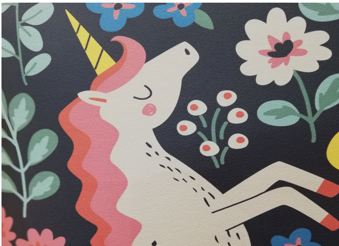
ENHJØRNING: Families minste er også en aktuell målgruppe. I dette segmentet var det mange nyheter, og den populære enhjørningen er klar for å bli veggpyrd.