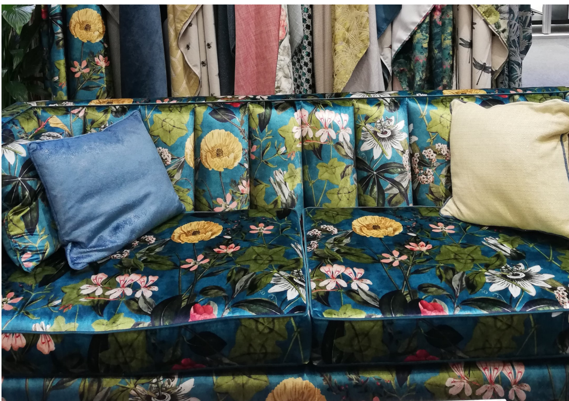
VELUR: Ensfarget velur, i syntetiske og naturfiber, har toppet tekstillistene i lengre tid. Nå presser mønstrene seg fram, det er vanskelig å motstå et sitt i denne sofaen.