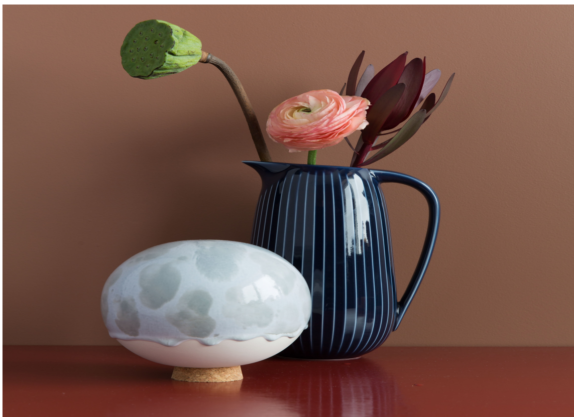
GLANSKONTRAST: Fargene på vegg og bord spiller fint på lag uten store kontraster. Glanskontrastene gir mer liv til interiøret. Vegg er malt i Butinox Interiør Stue & Sov Matt 5926 Frappe og bord i Quick Bengalack 5933 Årgang.