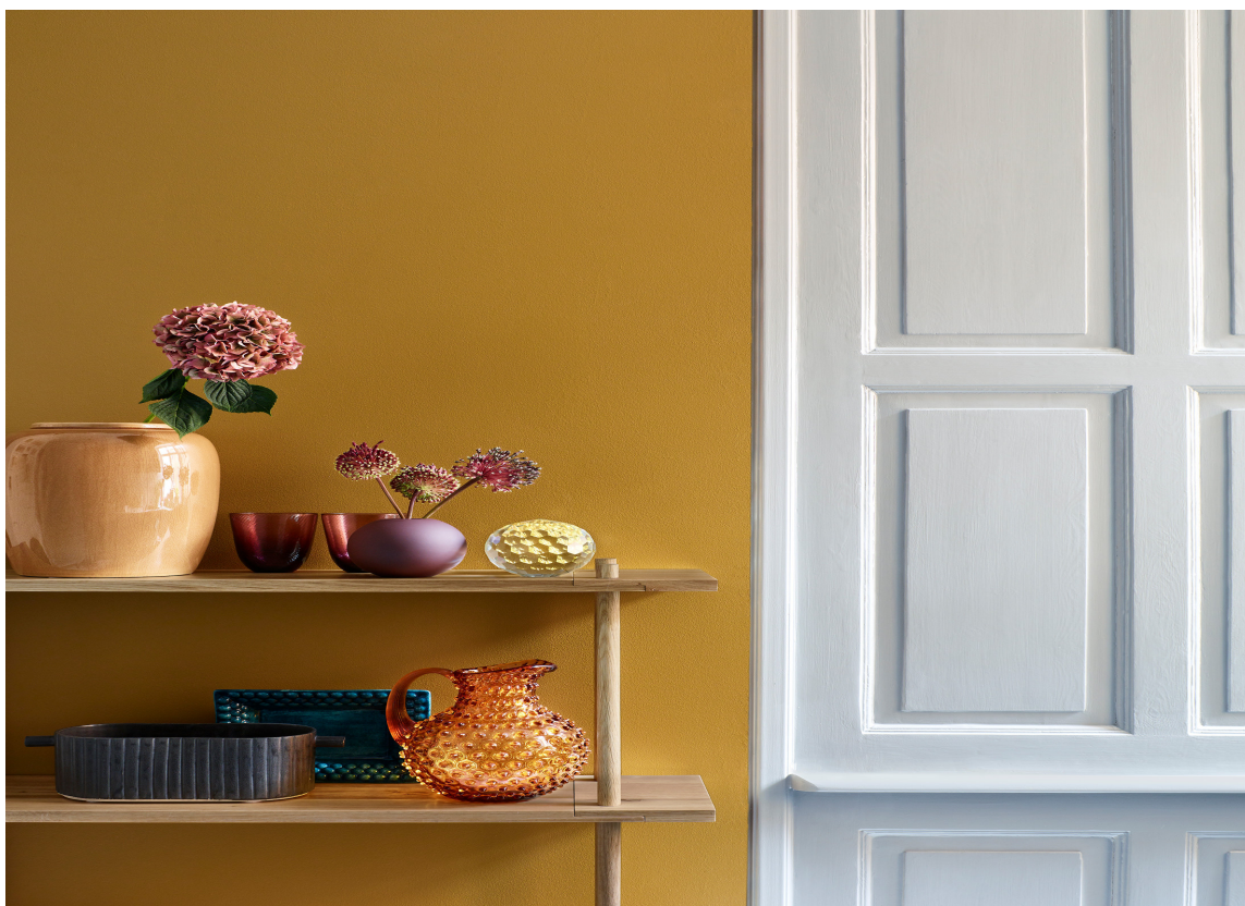
NØDVENDIG: Med den matte trenden som inntar norske hjem for øyeblikket, er det helt nødvendig å tilføre blanke kontraster, enten i form av maling eller gjenstander. Veggene her er malt med Beckers Mood Velvet Color i fargen Kummun 644.