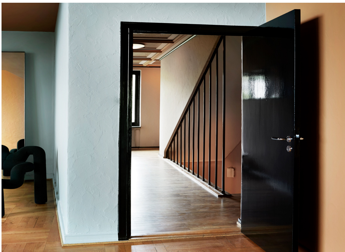
HØYGLANS: Matte vegger kombinert med høyglanset sort dør, gir en tøff og unik effekt. Veggene er i fargen "Polar Blue", høyre vegg i "Kenyan Copper". Alt Classico fra Pure & Original. Dør/vinduer malt med Traditional Paint i fargen "Black".