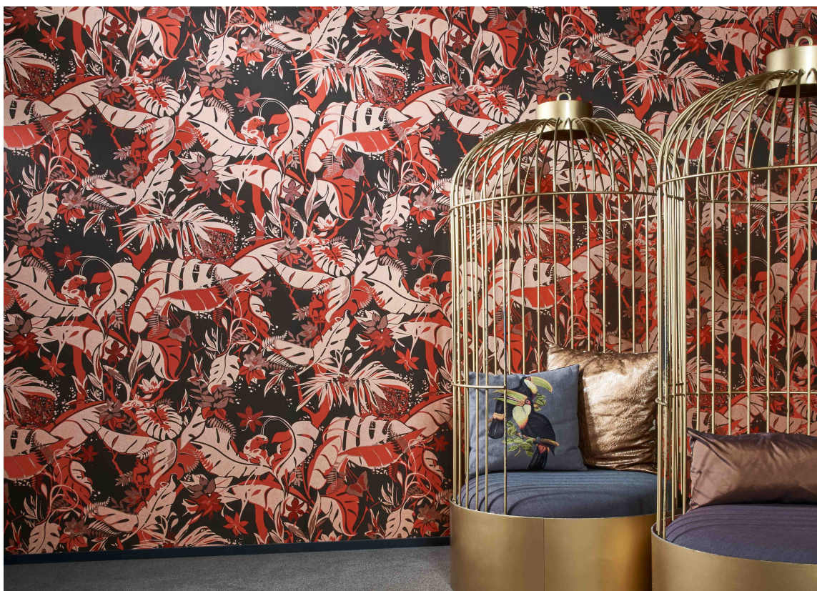
ELEGANT: Rødt og sort mønstret tapet, sammen med gulldetaljer, gir et elegant preg til interiøret. Tapetet fra Flavorpaper for Arte føres av Green Apple.