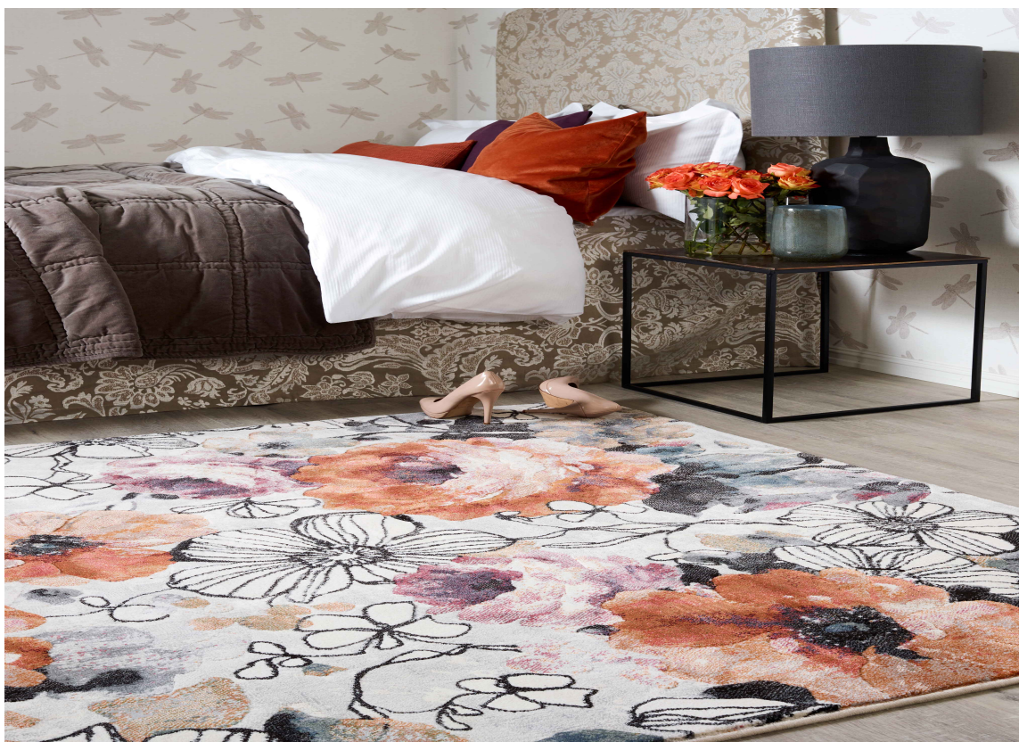
BLOMSTRETE TEPPER: Med teppe på soverommet er det en fryd å stå opp om morgenen. De brent-røde fargene på teppet og tekstilene tilfører varme til interiøret. Teppet er fra InHouse Group.