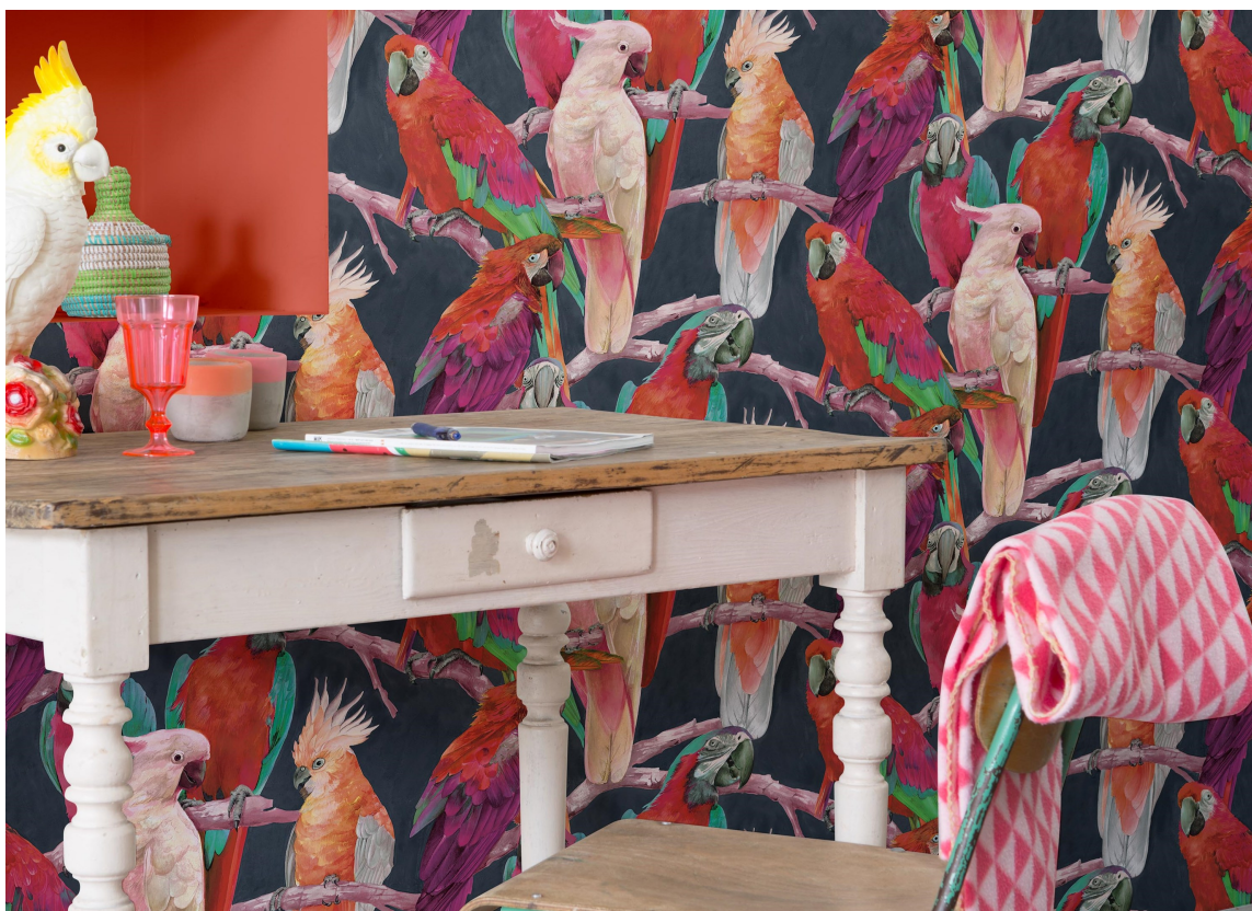
LEKENT: Lek deg med et sprekt, morsomt og fargerikt tapet fra Colourful Living fra Borge. Det blir garantert lagt merke til!