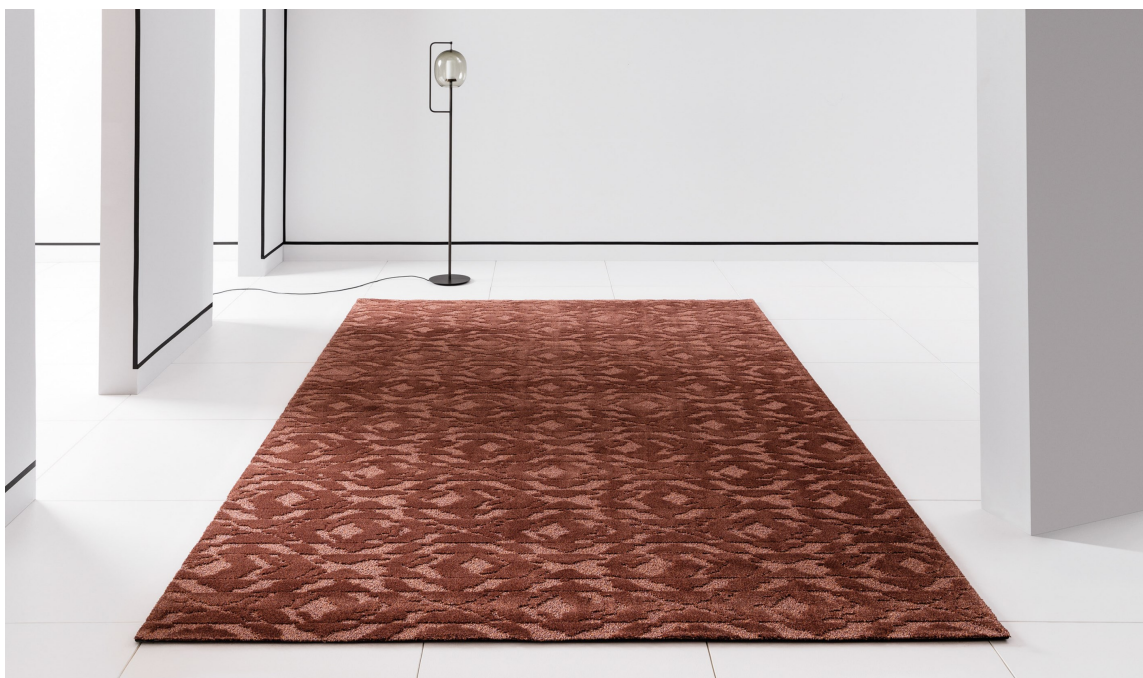
BRENT: Brente rødtone på tepper og tekstiler bidrar til et lunere, varmere og mer elegant interiør. Teppe fra Sahco/Intag.