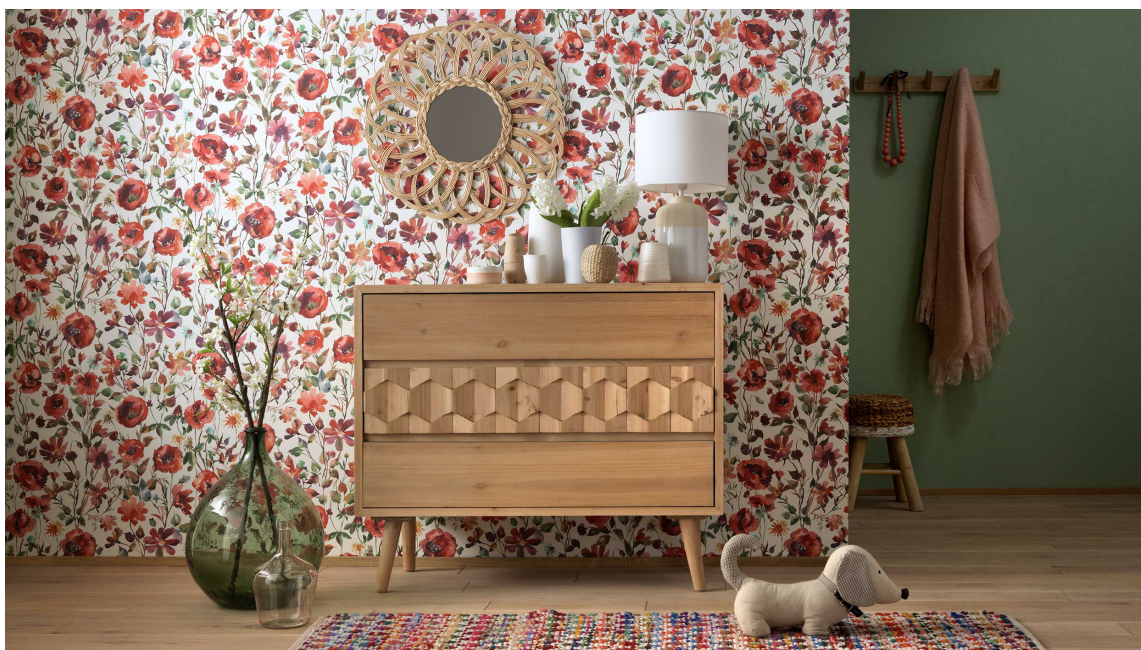
BLOMSTER: Blomstertrenden går aldri av moten. Rødblomstrete tapet, mot varme tredetaljer skaper et lunt og livlig interiør. Tapet fra kolleksjonen My Garden fra Fantasi Interiør.