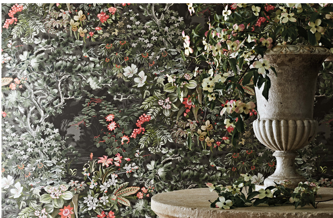
BOTANISK: Det er ikke mye som skal til. Tenk deg dette tapetet uten de røde detaljene. De tilfører den nødvendige kontrasten for at tapetet skal bli spennende, varmt og livlig. Tapet fra Cole & Son sin kolleksjon Botanical Botanica, som føres av Bo