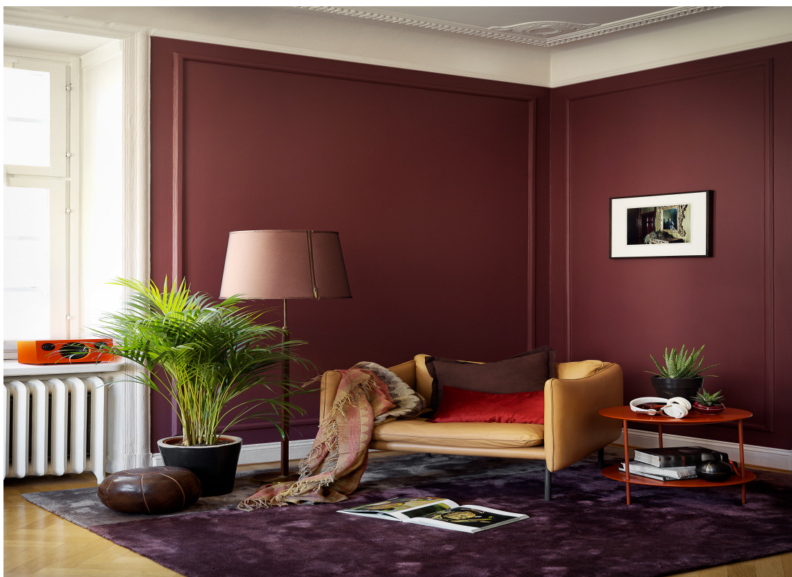
MØRKT: Dype, mørke rødfarger er takknemlige å jobbe med, og skaper et elegant, lusuriøst uttrykk. Veggen er malt i Mood Velvet Color fra Beckers, i fargen Impulsiv 864.