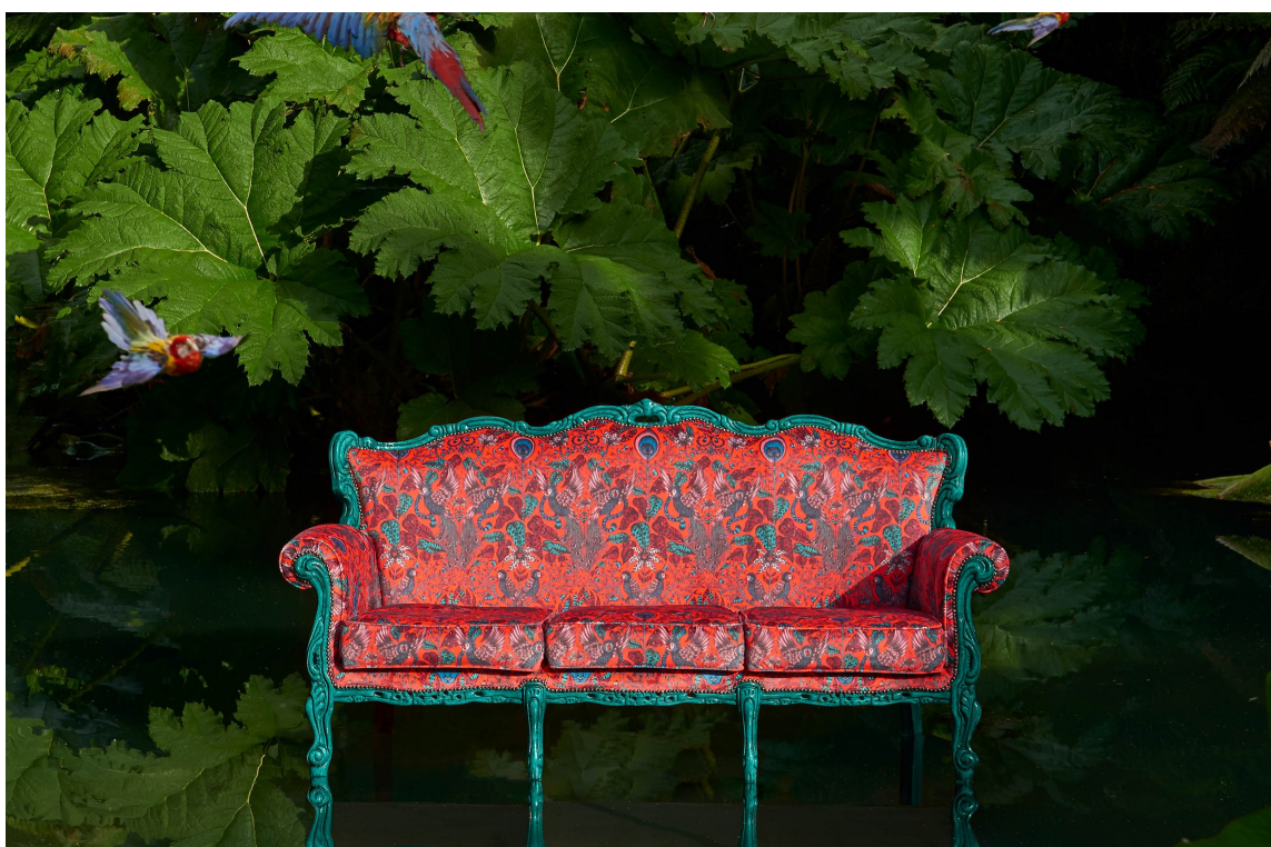
RØDT OG GRØNT: Rødt og grønt er komplementærfarger og et fargepar som ofte brukes for å skape spennende kontrast i interiøret. Tekstilene her er fra Animalia fra Borge.