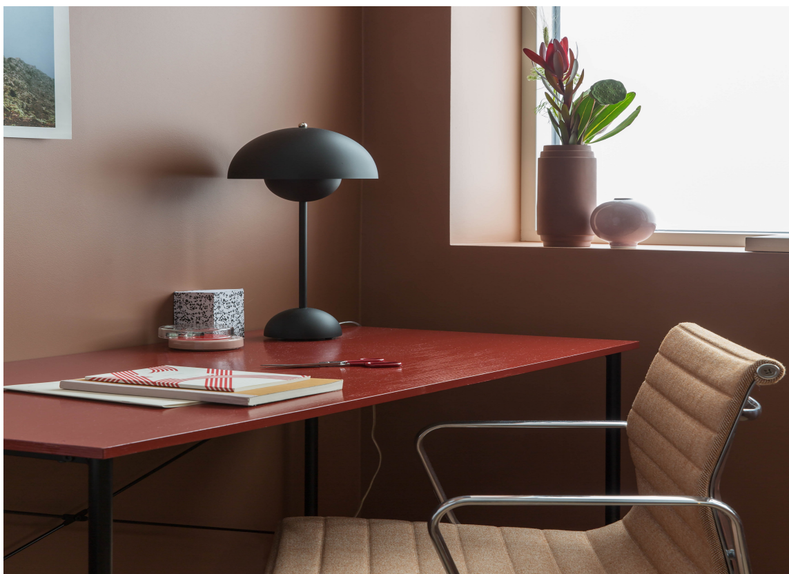
MATT: Med den matte fargen Frappe på veggene og det rødmalte bordet sprayet i fargen Årgang, kan arbeidslysten og energien bare komme! Farger fra Butinox og Quick Bengalack.