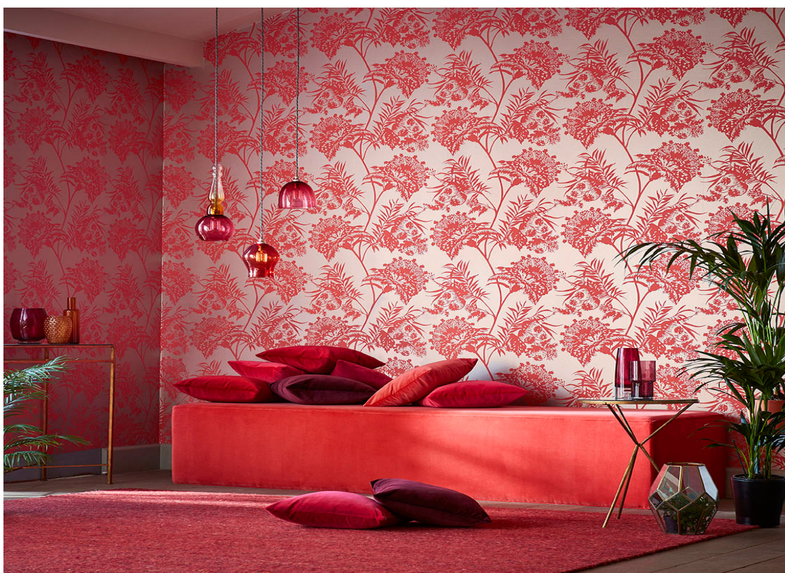
RØDT PÅ RØDT: Kanskje for mye for noen – akkurat passe for andre! Rødt har noe for enhver smak, enten du vil ta den helt ut eller bare friske opp med detaljer. Her er tapet og tekstiler fra Harlequin sin kolleksjon Zapara, som føres av Tapetuset.