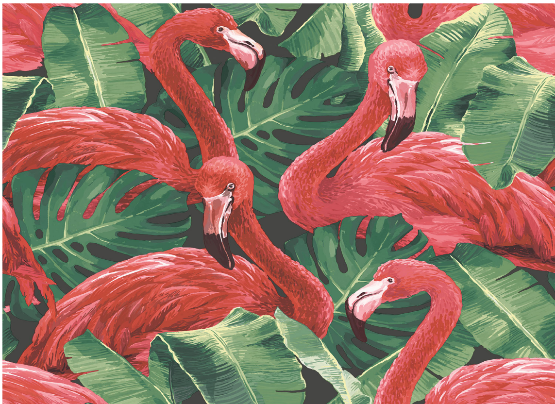
FLAMINGO: Med røde flamingoer mot grønne planter blir uttrykket livlig og eksotisk. Tapet Global Fusion fra Fantasi Interiør.

Rødt er en farge som gir energi. Og i friske, klare nyanser, gjerne i et morsomt mønster, kan du få et livlig og lekent interiør. Kombiner gjerne rødt med komplementærfargen grønn for spennende, men trygge kontraster. For noen kan det være for mye å tapetsere hele rommet med papegøyer eller flamingoer, men for andre kan det være akkurat riktig. Og for deg som er litt midt imellom, kan du gjerne prøve deg fram på gjestetoalettet eller i gangen – rom du ikke oppholder deg lenge i av gangen, og der du gjerne kan skeie litt ekstra ut.