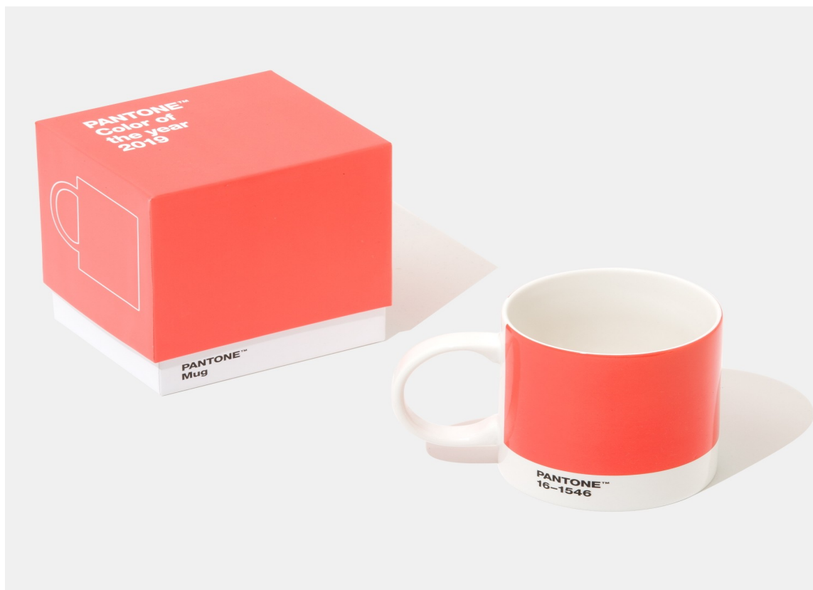
ÅRETS FARGE: Living Coral fra Pantone.