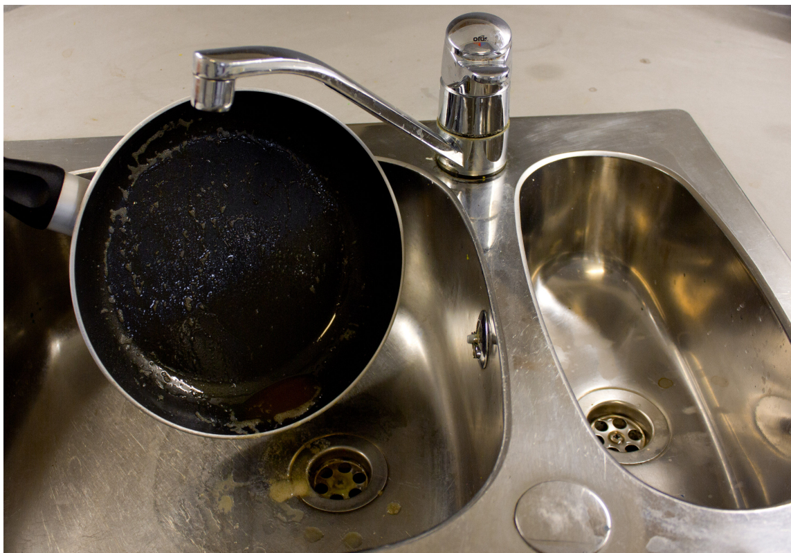
FETTKRISE: Ikke hell matfettet i vasken. Det har ingenting der å gjøre. Tørk av fett med tørkepapir og kast i matavfallet.