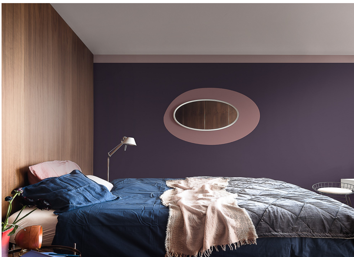
ROLIG: Det er ikke mye som skal til. Med en gang taket får litt farge, selv om lys, dempet farge, blir det et roligere uttrykk enn om det hadde vært helt hvitt. Her er det brukt farger fra CF18-paletten til Nordsjö, kombinert med årets farge 2018,