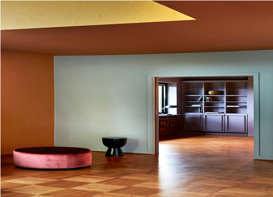
ENERGI: La taket være et skikkelig blikkfang og en energiboost på soverommet! Farger fra Pure & Original.