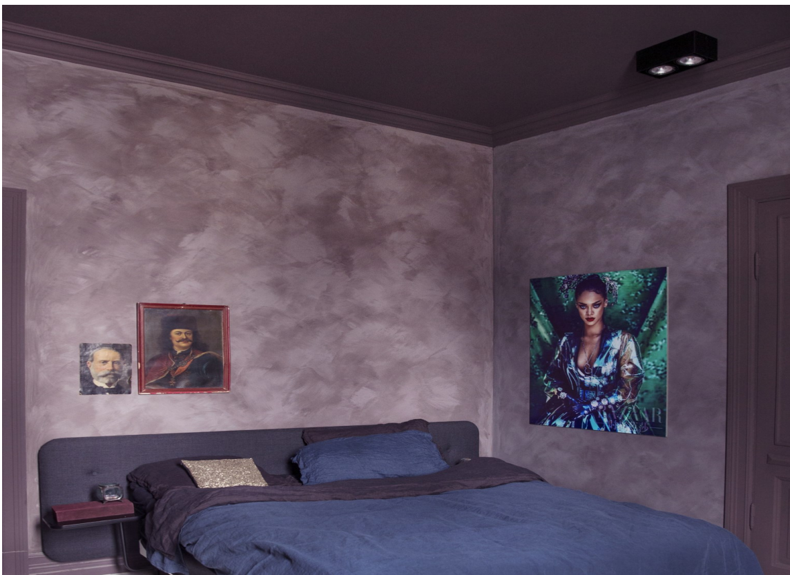
DRØM SØTT: Med denne herlige fargen i taket, kan du drømme søtt. Farger fra Pure & Original.