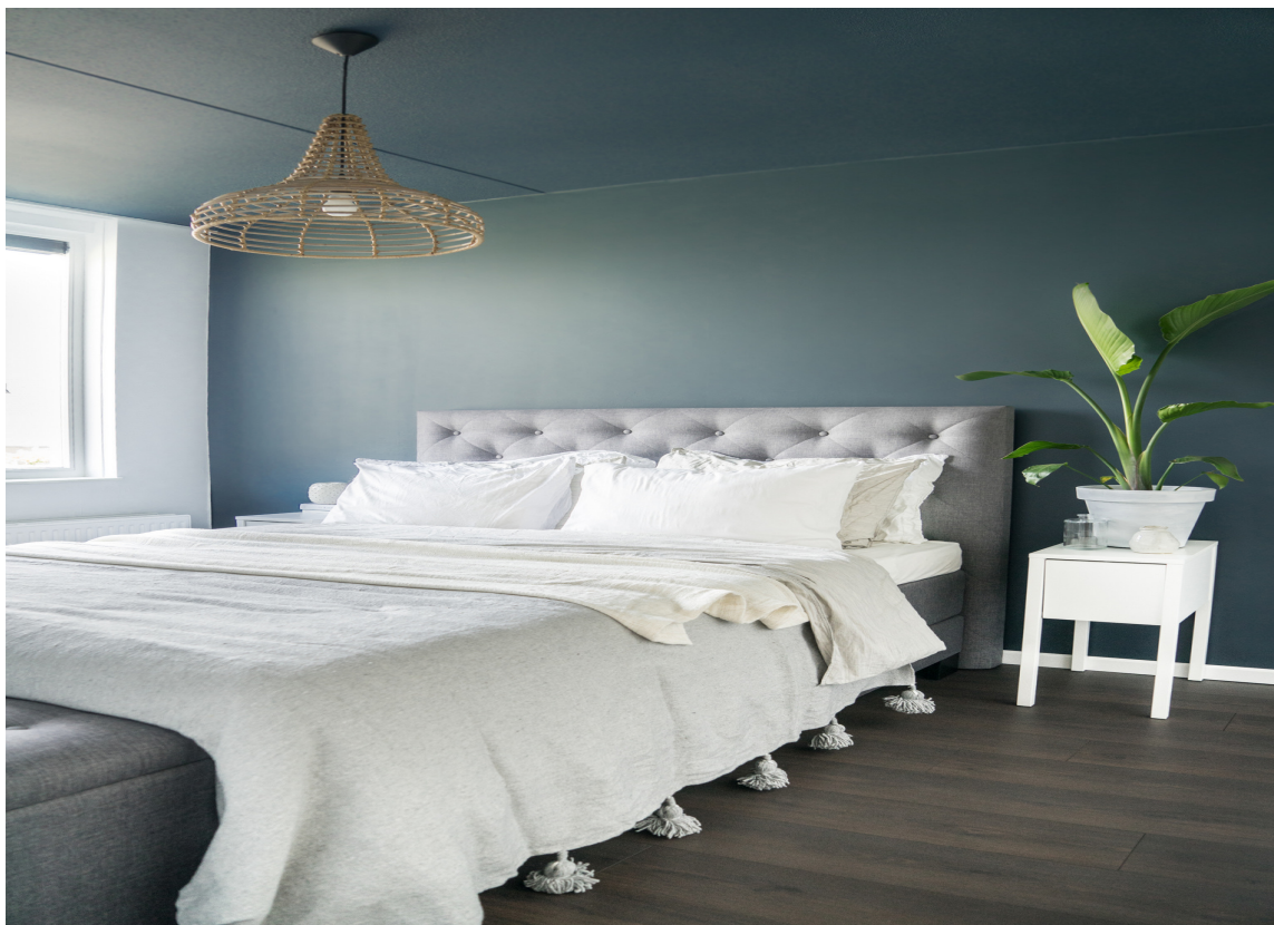
BLÅGRÅTT: Mange sover godt i dempede, blåfarger. Drar du fargen opp i taket også, får du en fin helhet og en fin farge å se på mens du drar deg en søndagsmorgen. Farger fra Pure & Original.