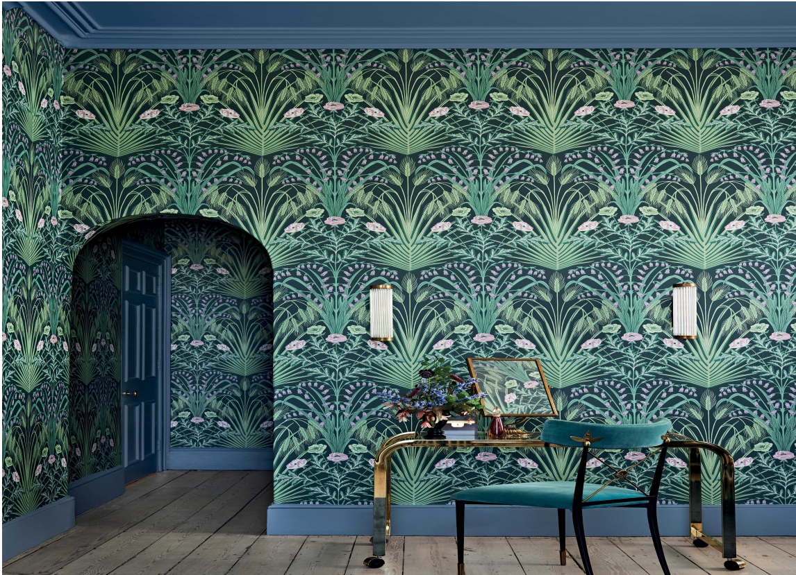
HELHET: Ved å la tak og lister være i en farge som passer med tapetet på veggen, skapes en fin helhet. Her er tapetet Bluebell fra Cole & Son sin kolleksjon Botanical Botanica, som føres av Borge.