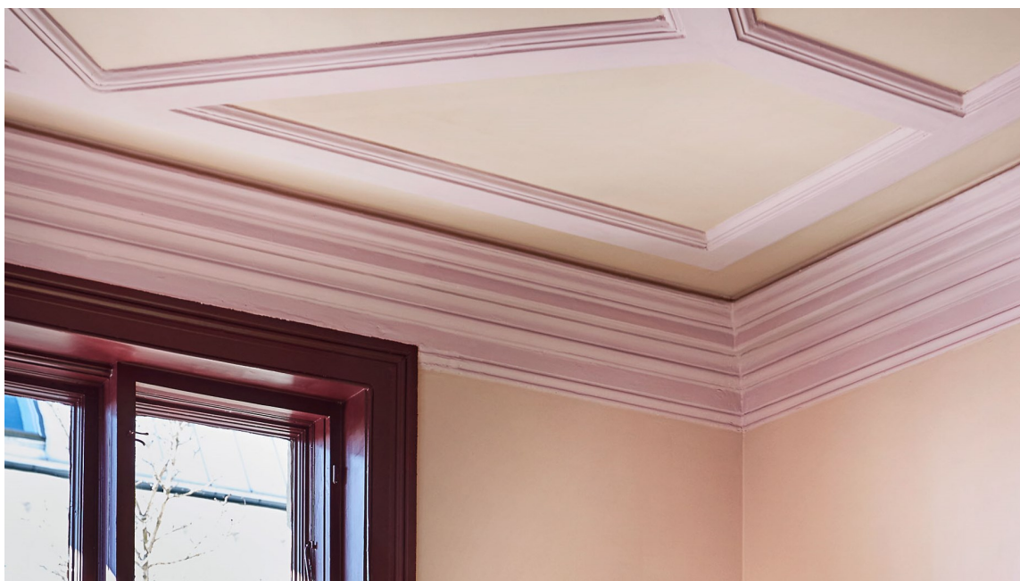
DETALJER: Ved å male taket i en farge, kan de arkitektoniske detaljene komme frem på en helt ny måte.