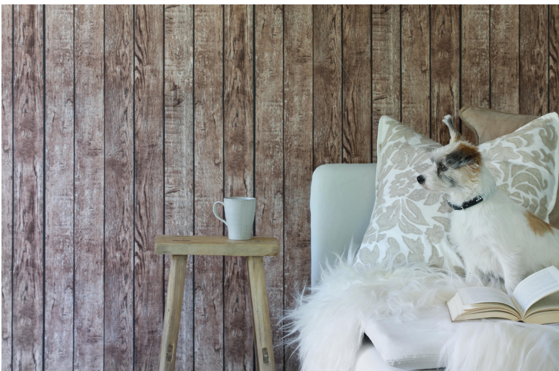
TRENDY: Mange ønsker seg trelook hjemme. De ferdigtapetserte veggplatene Walls4You Wooden Stripe er en enkel måte å få looken.