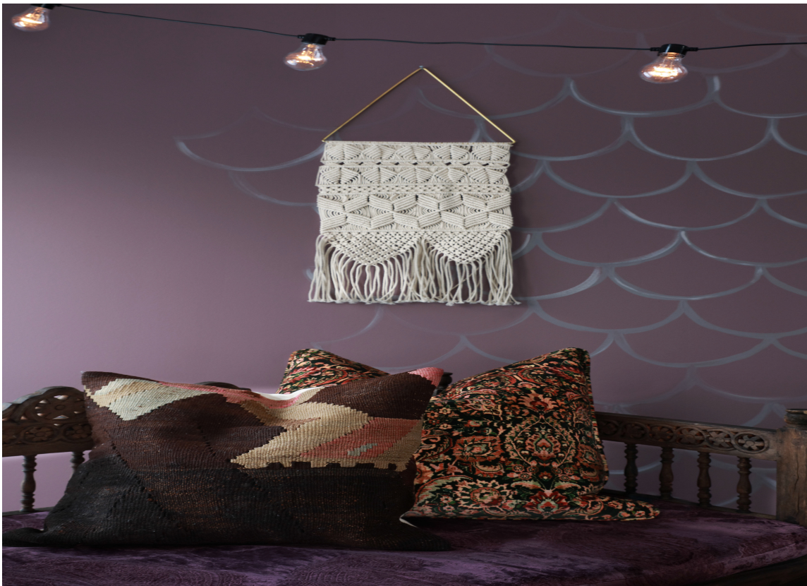
VELG SELV: Med Walls2Paint kan du velge maling eller tapet selv.