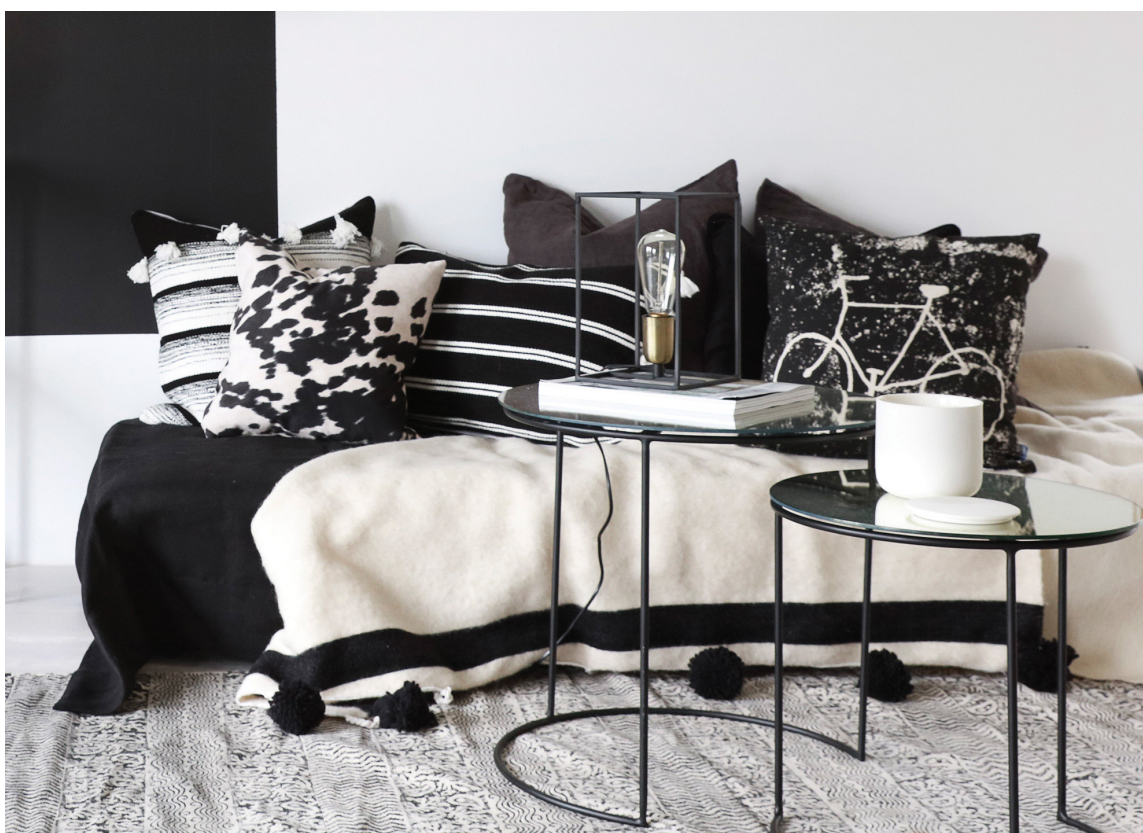
SLETT: Veggplater er en rask vei til slett vegg.