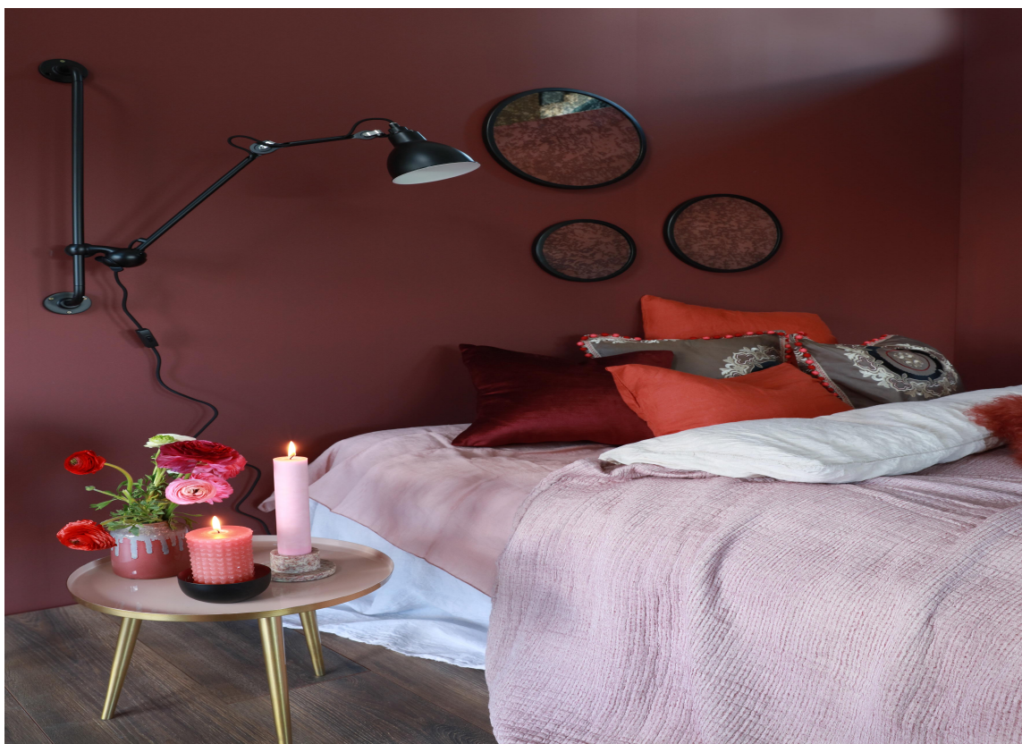
HULE: Skap din egen hule på soverommet med veggplater malt i en dyp farge.