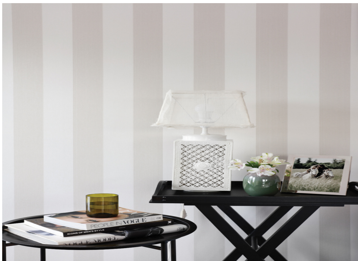
KLASSISK: Tapet med klassiske striper gir et elegant, tidløs uttrykk til soverommet. Walls4You Narrow Stripe Offwhite Beige.

– Du er ikke nødt til å slippe, pusse, sparkle eller grunne for å få drømmen om en slett vegg oppfylt. Ved å sette opp slette, forbehandlede veggplater, enten ferdigtapetserte eller klare for tapet eller maling, sparer du mye tid, forklarer Mangseth.