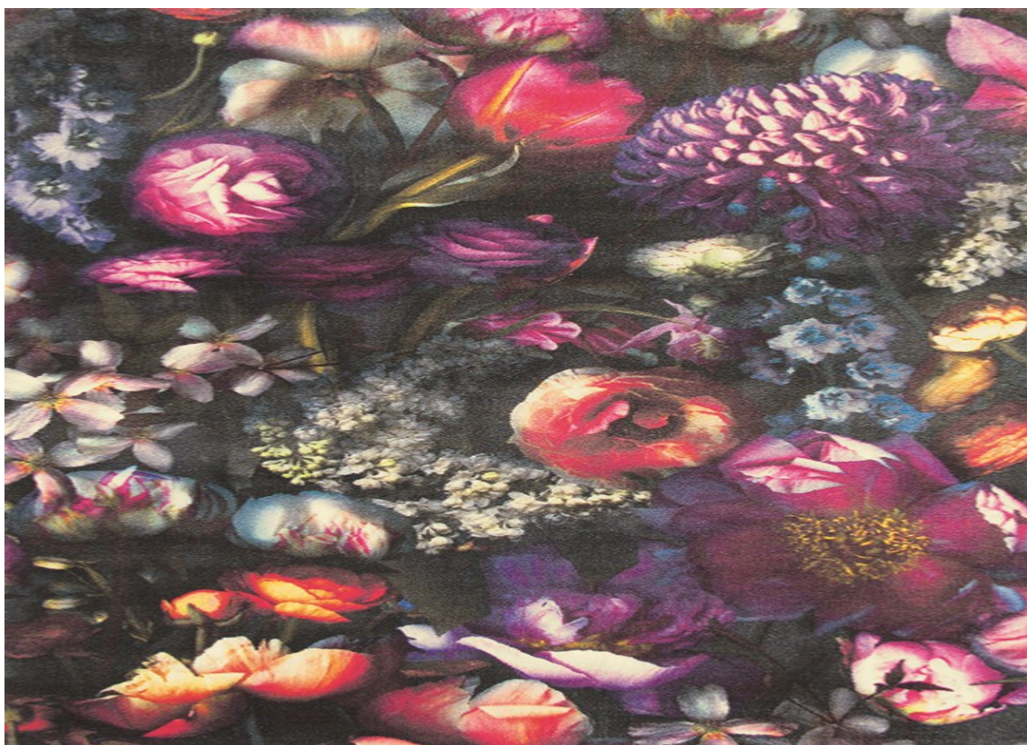
TEPPEKUNST: Dette teppet blir som et maleri på gulvet, og kommer til sin fulle rett når det kan ligge fritt i rommet. Teppet Shadow Floral er fra Ted Baker, og føres av Tapethuset.