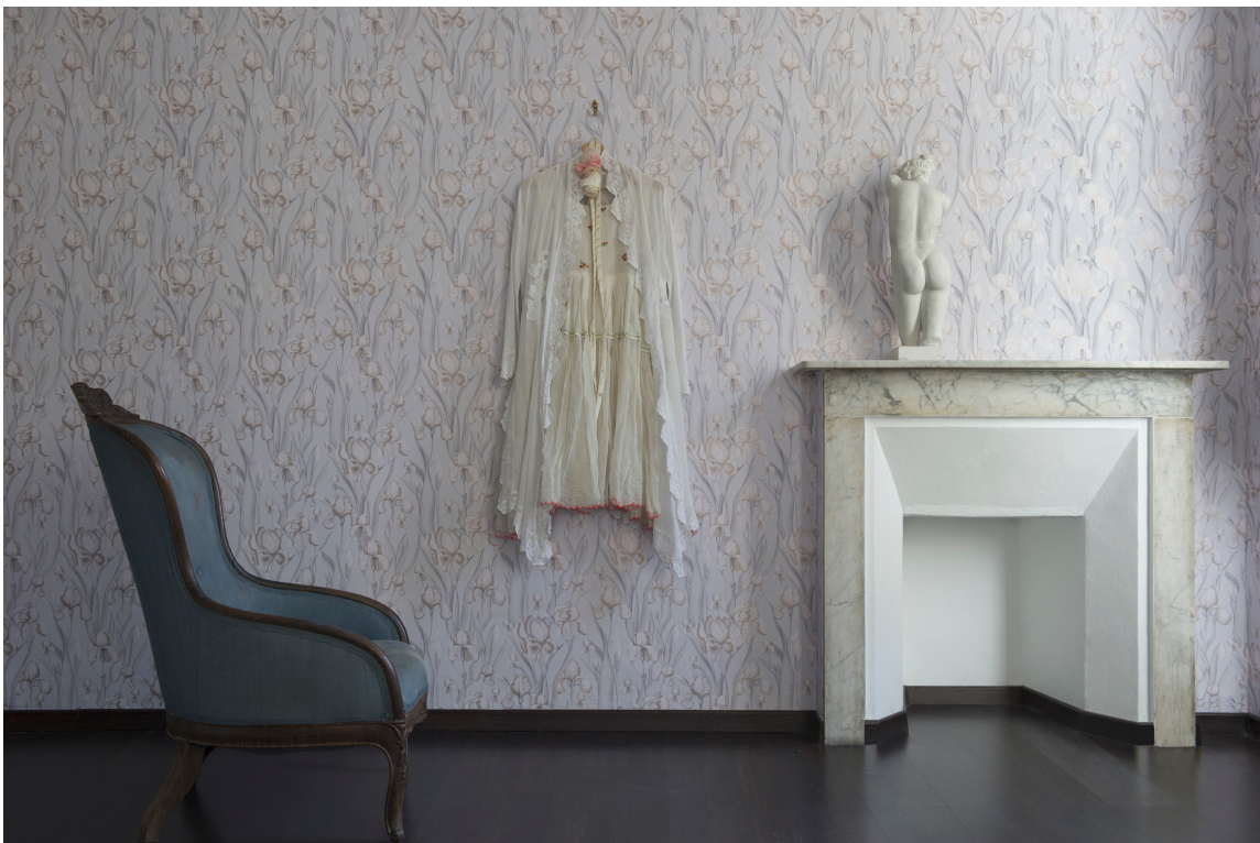
LYS IRIS: Atmosfæren her er dempet og feminin, nesten litt forsiktig. Tapetet heter da også Iris Whisper, og er fra kolleksjonen Elisir/Fantasi Interiør.