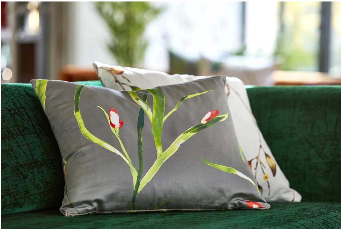
PUTE: Start med en pute i sofaen dersom du er usikker på om blomster er noe for deg. Denne er fra Tapethuset, tekstil fra Harlequin/Zapara.