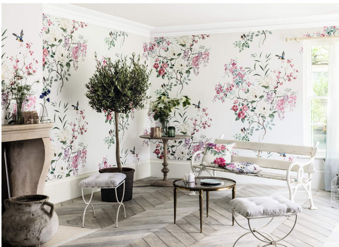
HAGESTUE: Engelske Sanderson er en klassisk leverandør av blomstermotiv. Deres kolleksjoner kan inspirere til en hel hagestue. Inntag fører Sanderson i Norge.