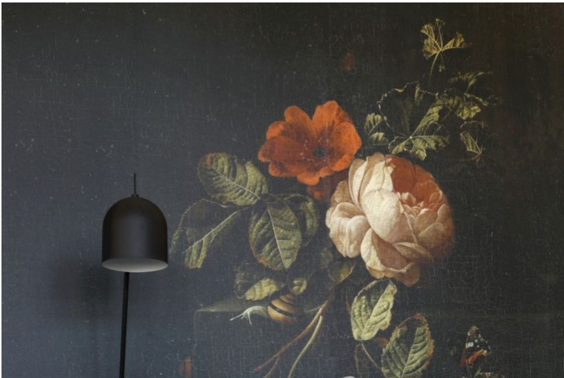
HISTORISK: Et rosemotiv på krakelert bunn ser ut som det er malt rett på veggen for lenge siden og gir et lite pust av historie. Tapetet er fra kolleksjonen Blush hos Storeys.