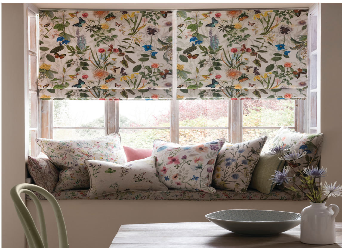
LITT SOMMER: Med en blomstrete liftgardin og matchende puter har du litt sommer i kjøkkenkroken hele året. Tekstilene er fra kolleksjonen Country Garden hos Borge.