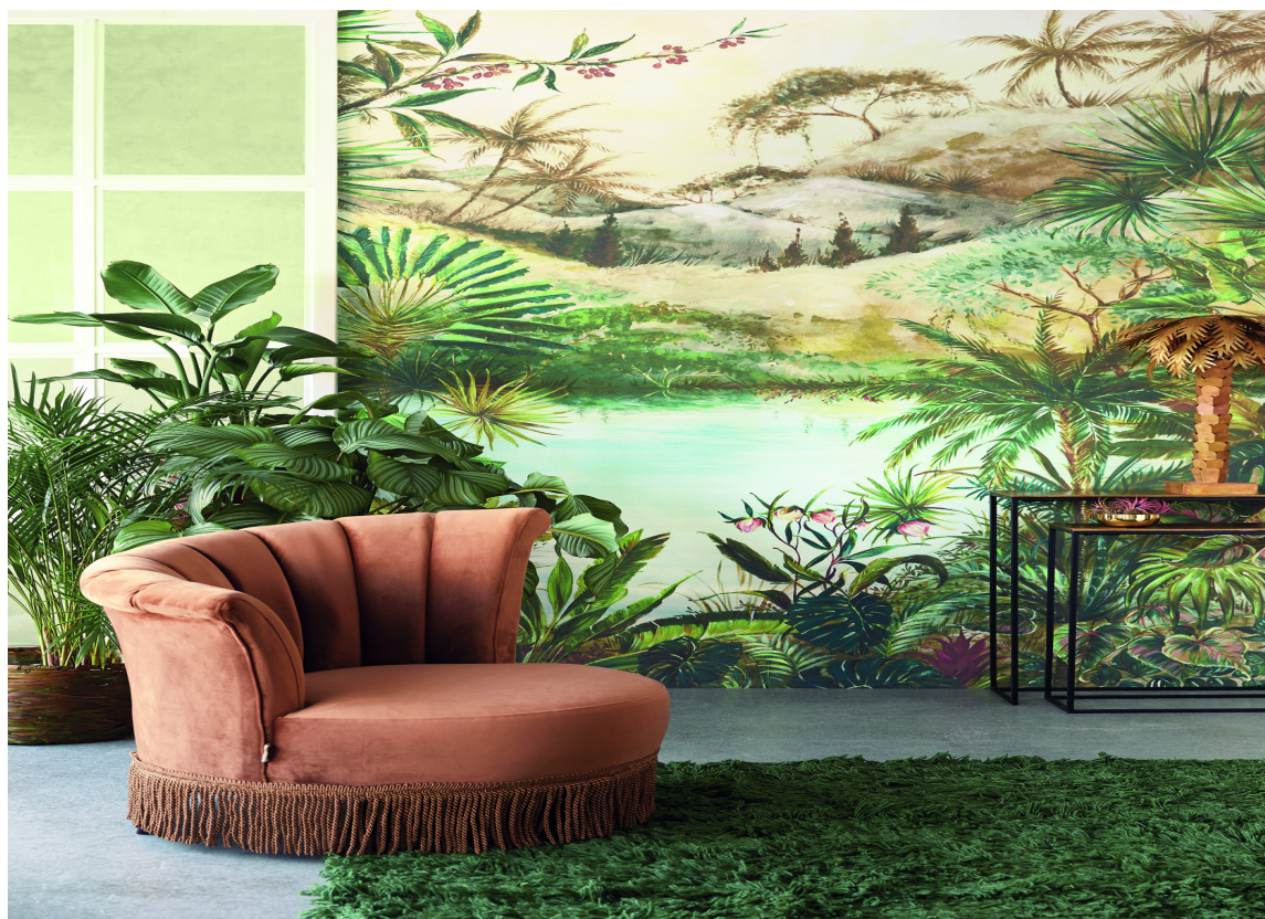
HEL VEGG: Tapet med motiv som dekker hele vegger er tilbake. Her et fredfullt landskap fra kolleksjonen Vivid hos Storeys.