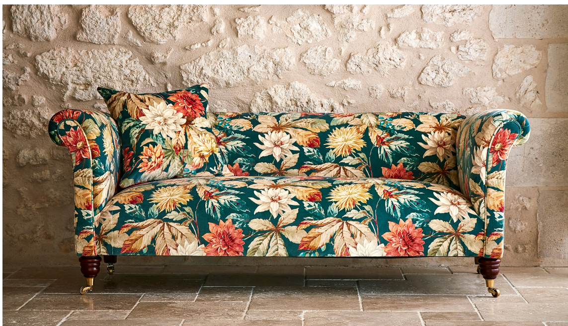
MØBELTREND: En blomstrete sofa eller stol kan bli prikken over i-en i stuen. Denne er trukket i et stoff fra Sandersons kolleksjon Elysian. Det føres av Intag.