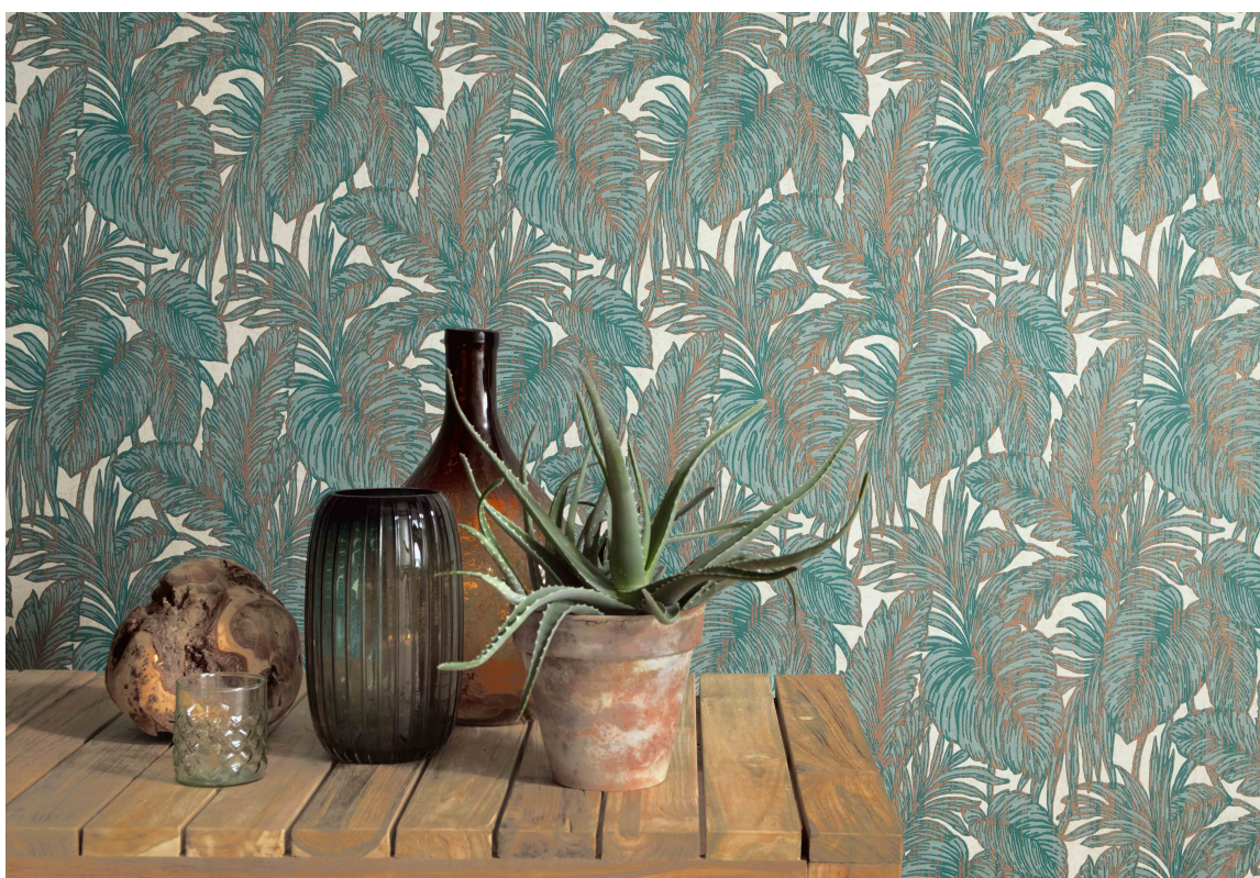
GRØNT: Grønne planter og jungelmotiv er en stor nisje i havet av blomstertapet. Dette er fra Fantasi Interiør, kolleksjon Hacienda.